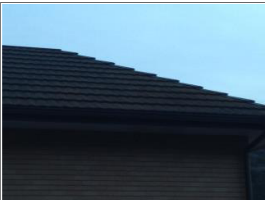
洋風コンクリート瓦（モニエル）

洋風コンクリート瓦はセメント：骨材＝1：3（通常のセメント瓦はセメント：骨材＝1：2）で作られており、その上にカラースラリー層とアクリルクリヤーでできております。