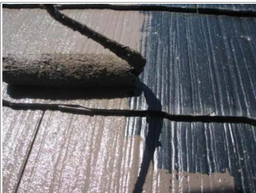
屋根中塗り施工中