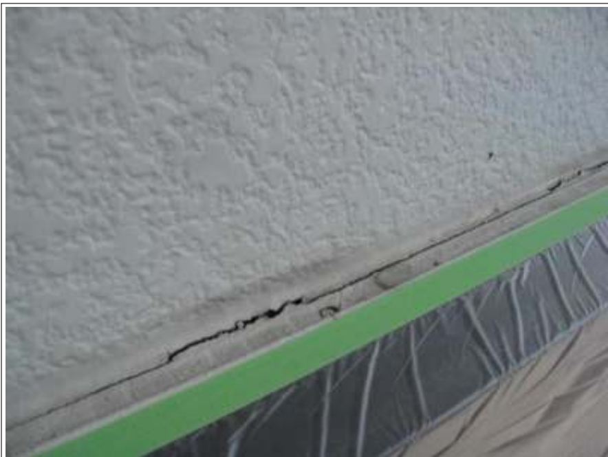
外壁シーリング補修施工前