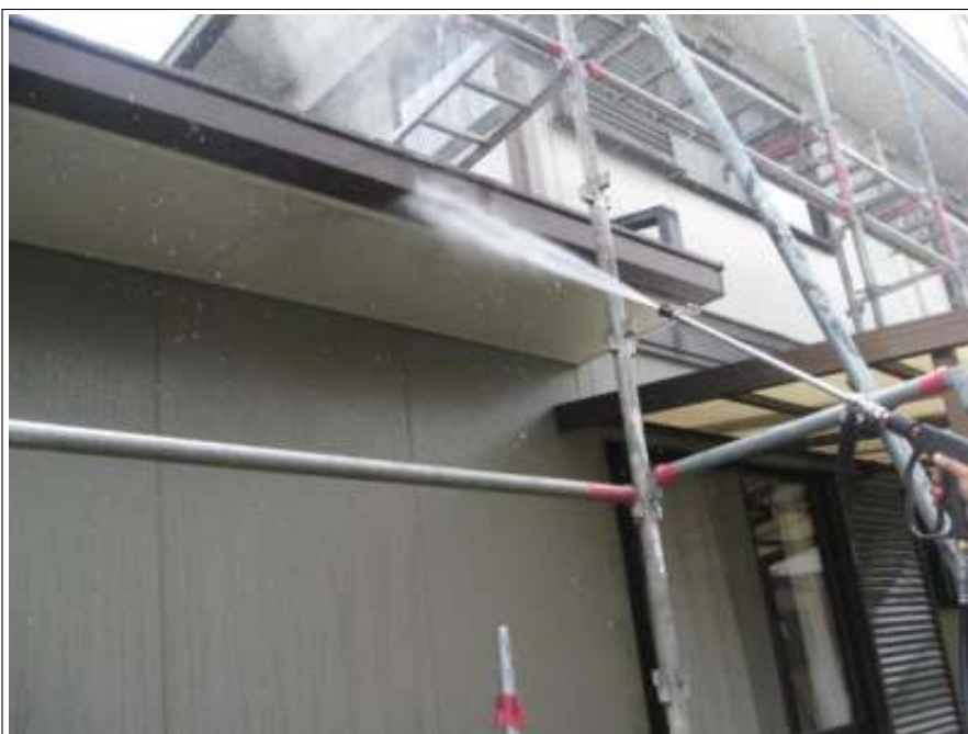
破風高圧洗浄施工状況