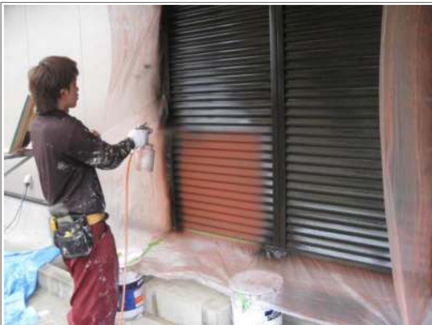
雨戸上塗り施工状況