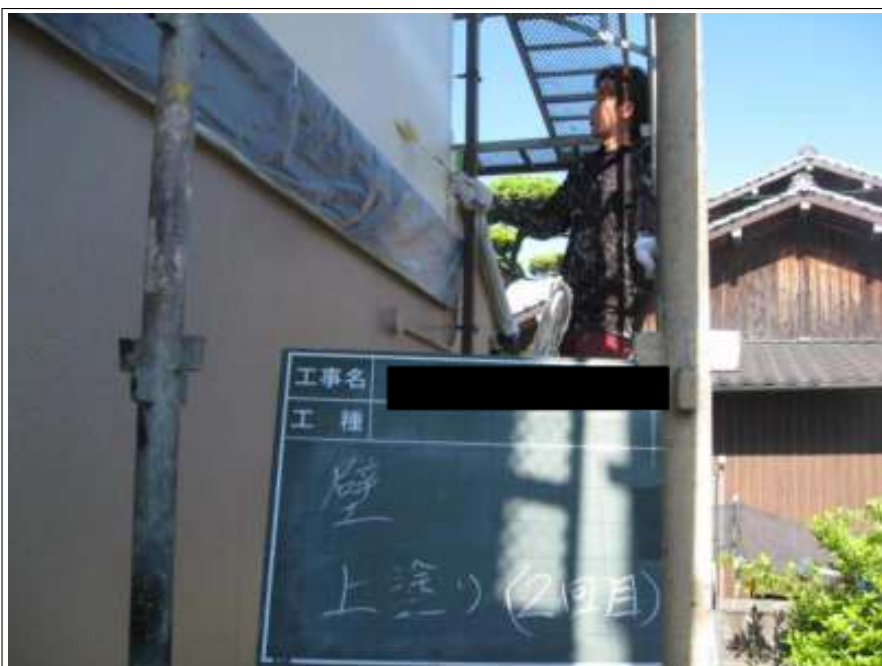
外壁上塗り施工状況2回目 (2階)