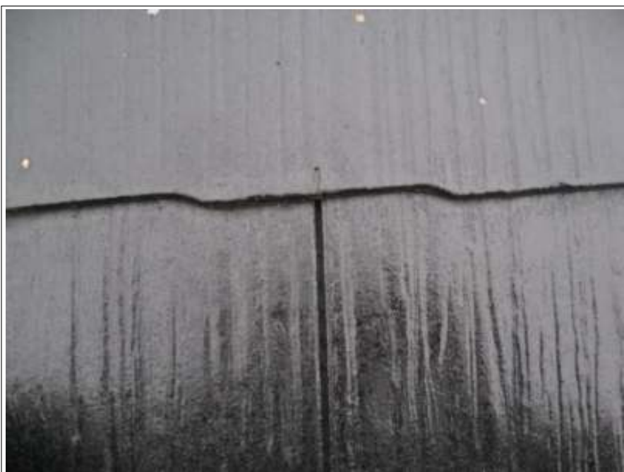
タスペーサー取付前