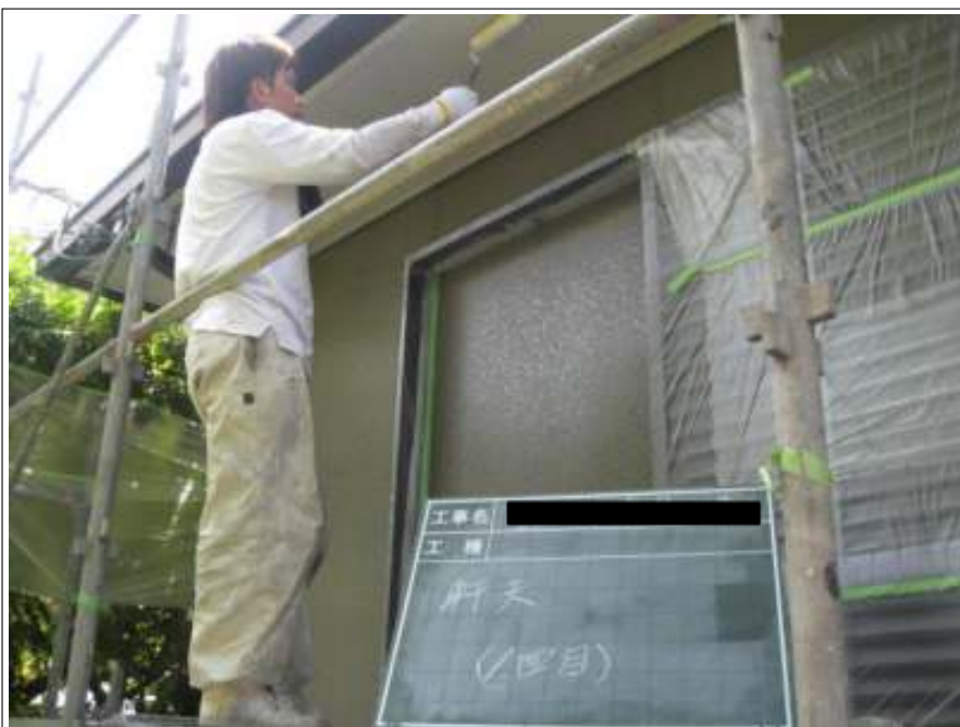
軒天下塗り施工状況