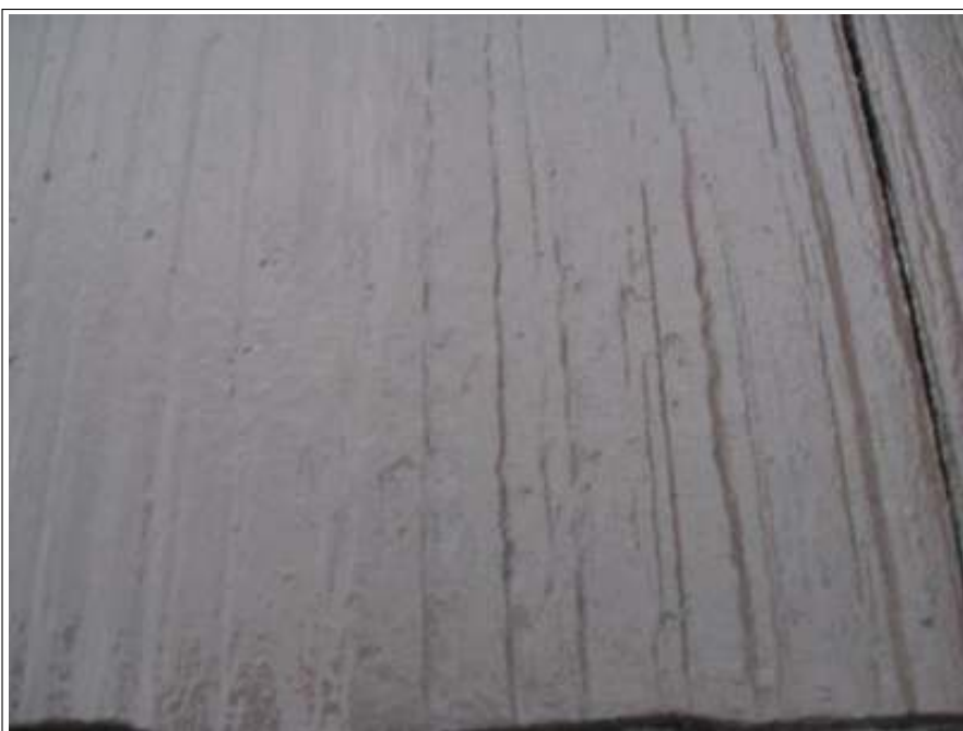
屋根上塗り施工完了