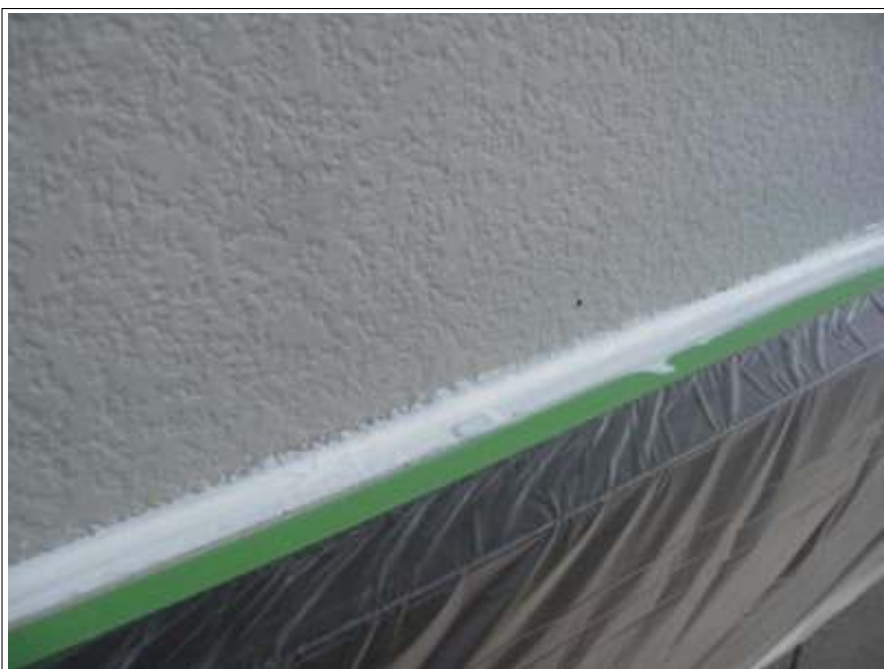
外壁シーリング補修施工完了