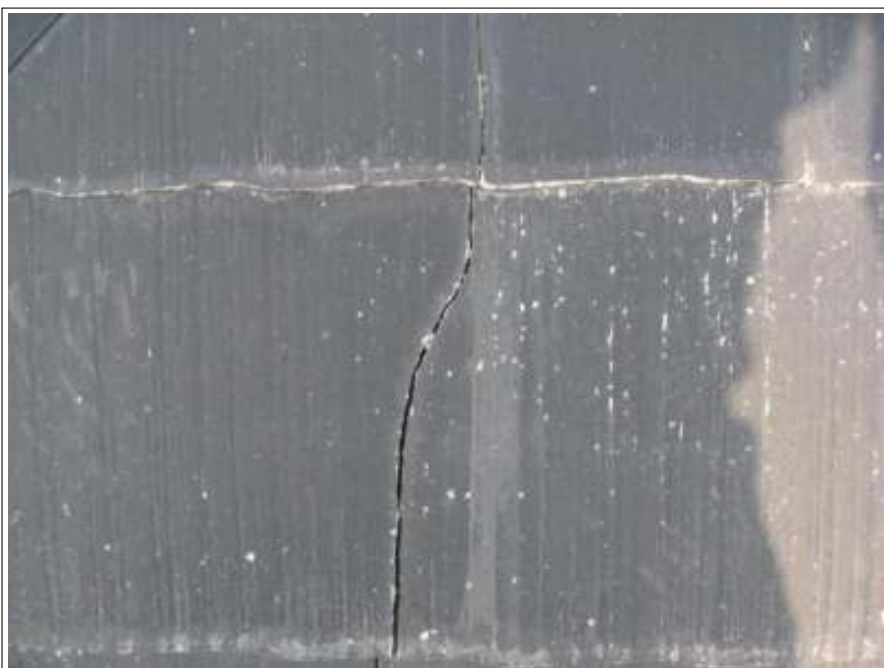
屋根クラック補修施工前