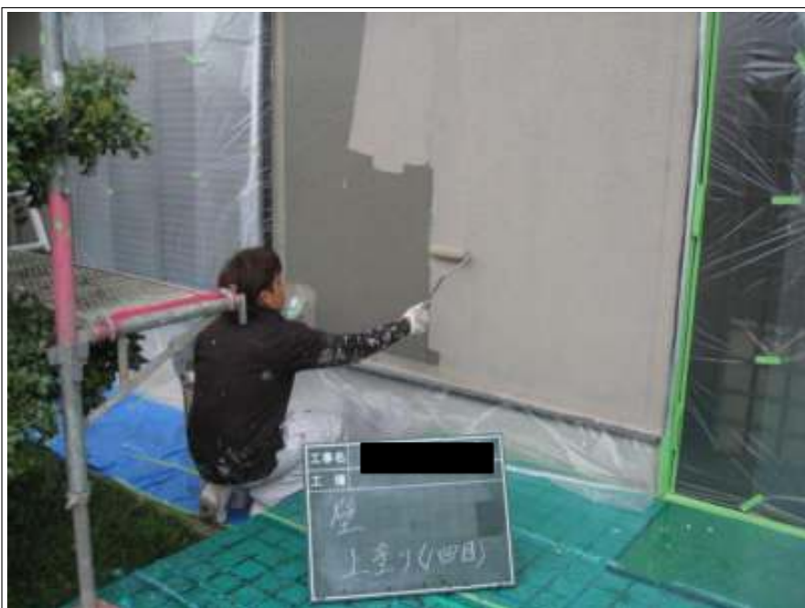
外壁上塗り施工状況1回目 (1階)