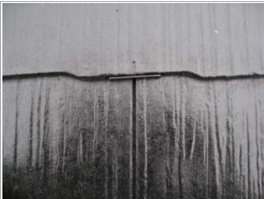
タスペーサー取付完了