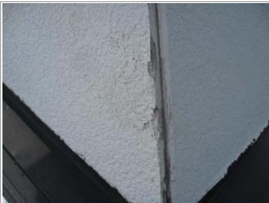
外壁シーリング補修施工前