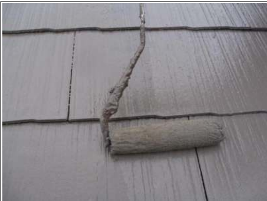
屋根上塗り施工状況