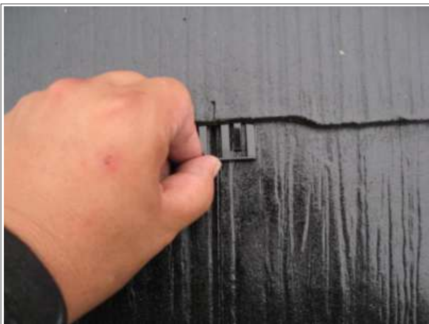
タスペーサー取付状況