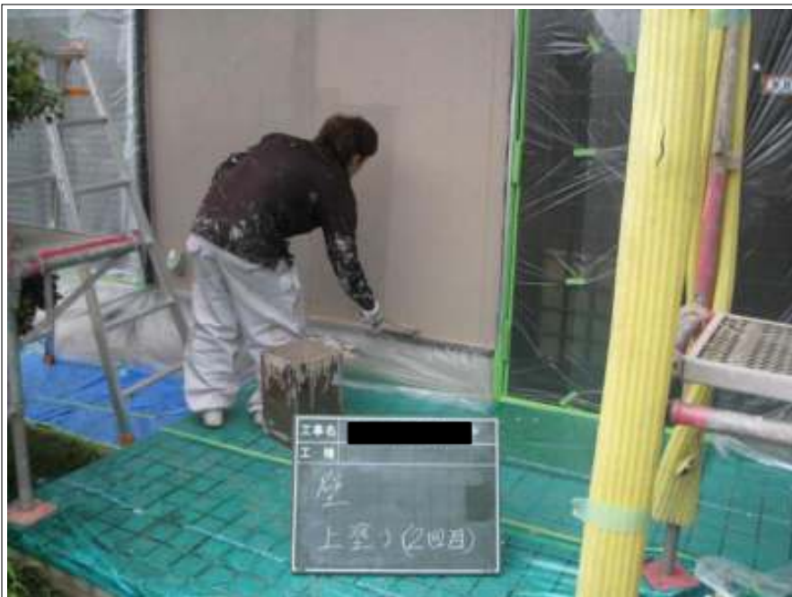
外壁上塗り施工状況2回目 (1階)