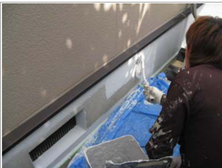
基礎部分下塗り施工状況