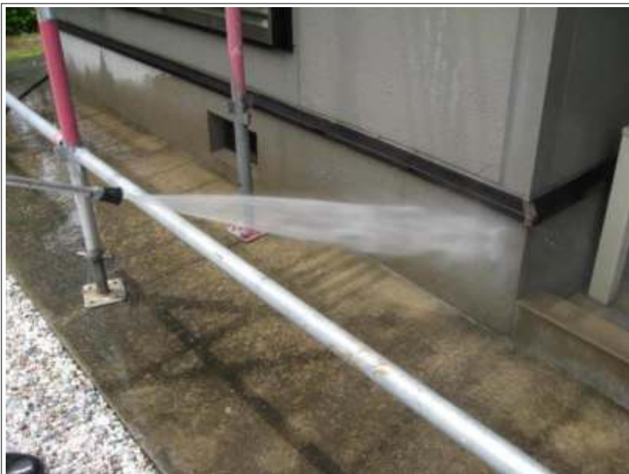
基礎部分高圧洗浄施工状況