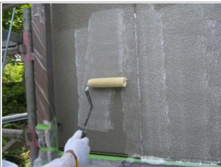
外壁バリアー施工状況