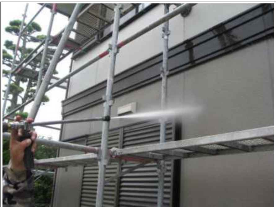
外壁高圧洗浄施工状況