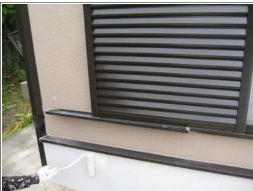
基礎部分上塗り施工状況