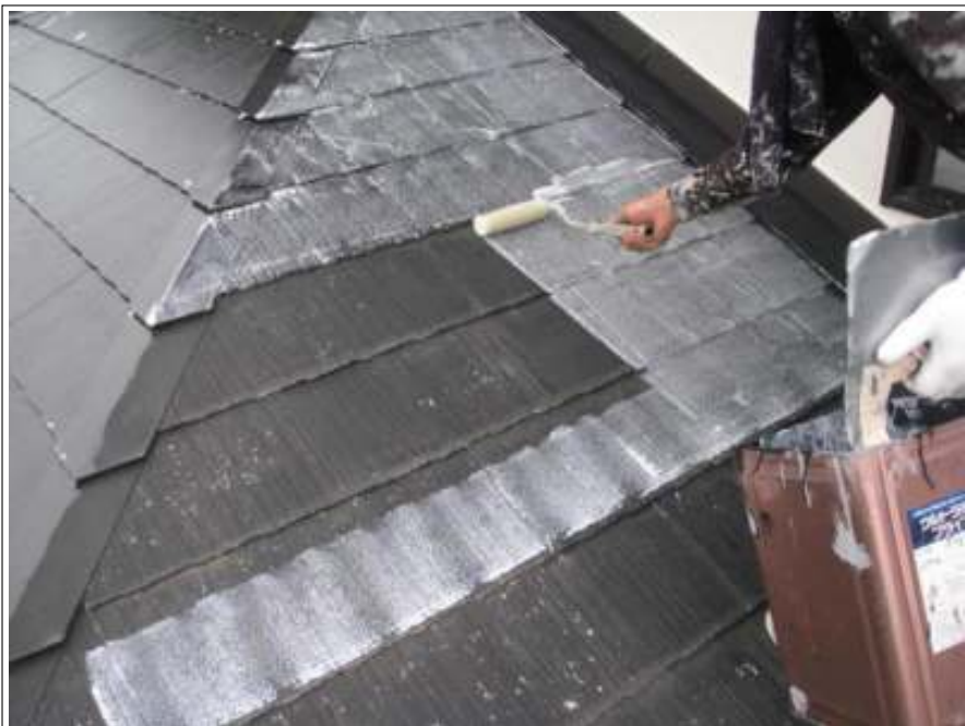
屋根下塗り施工状況