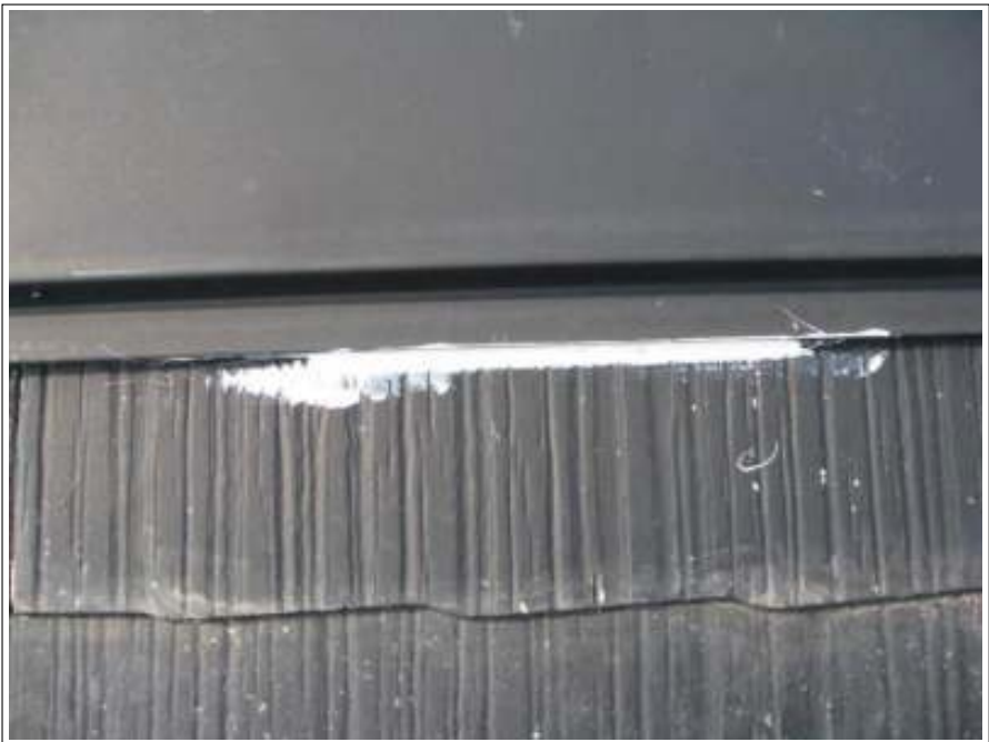
屋根ラバー止め施工完了