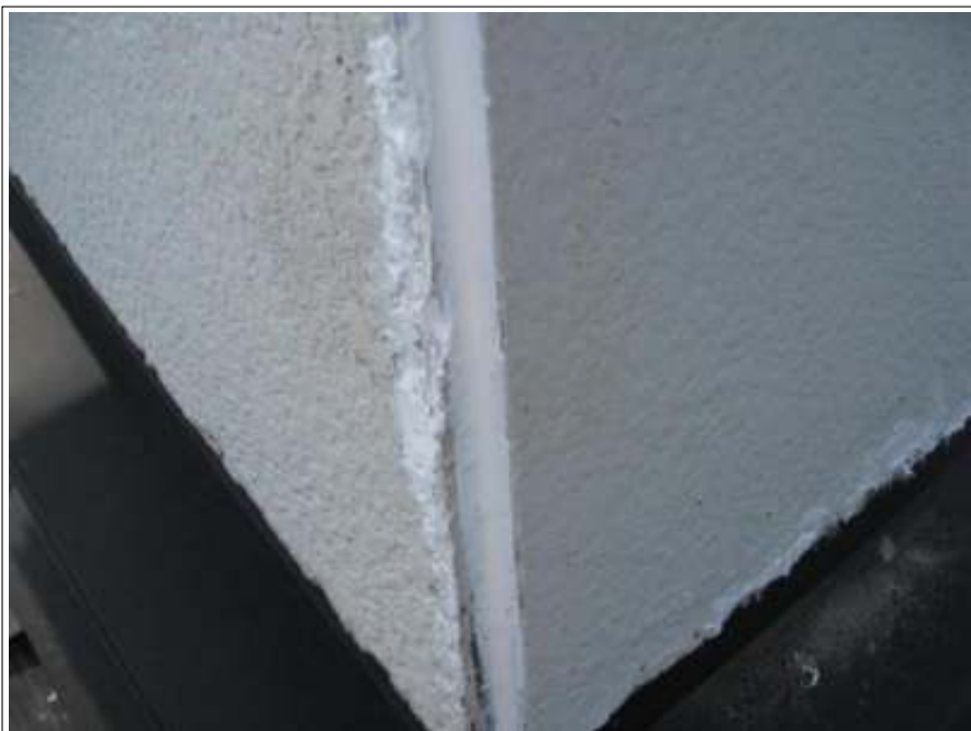
外壁シーリング補修施工完了