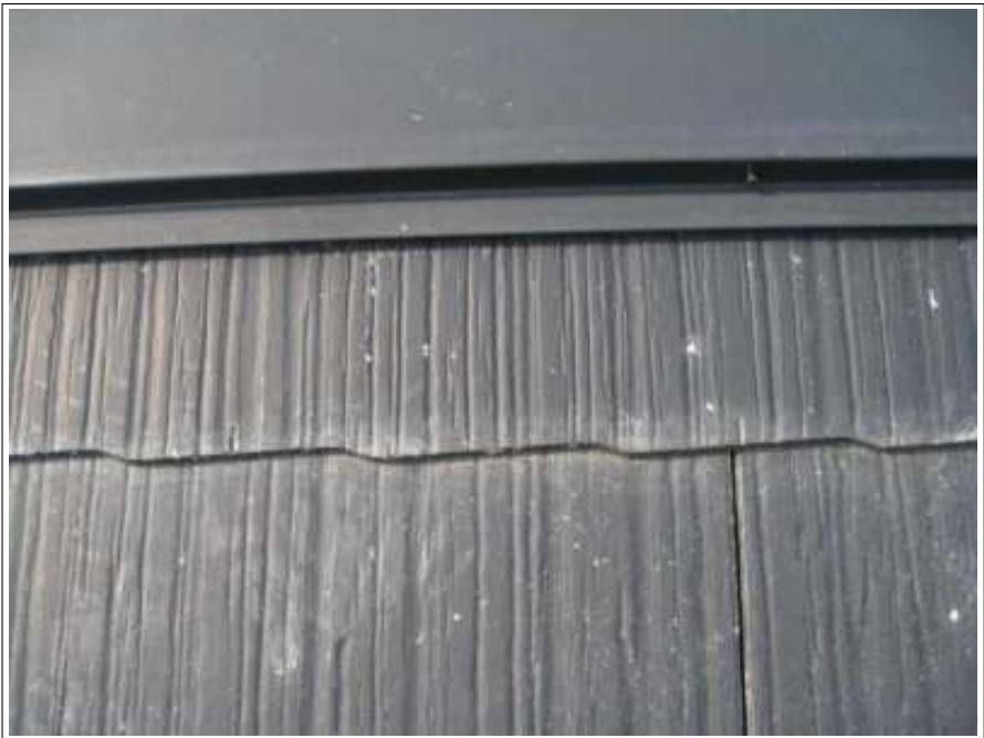
屋根ラバー止め施工前