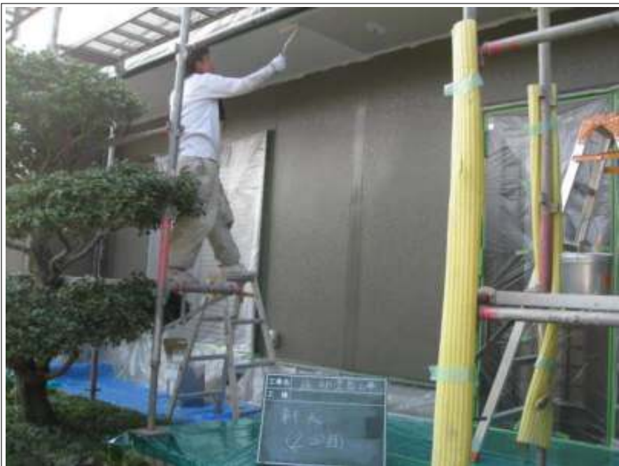
軒天上塗り施工状況