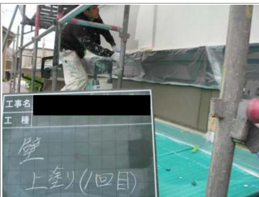
外壁上塗り施工状況1回目 (2階)