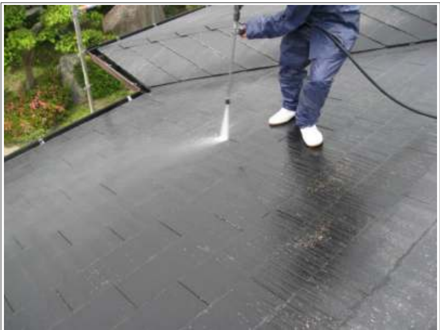
屋根高圧洗浄施工状況