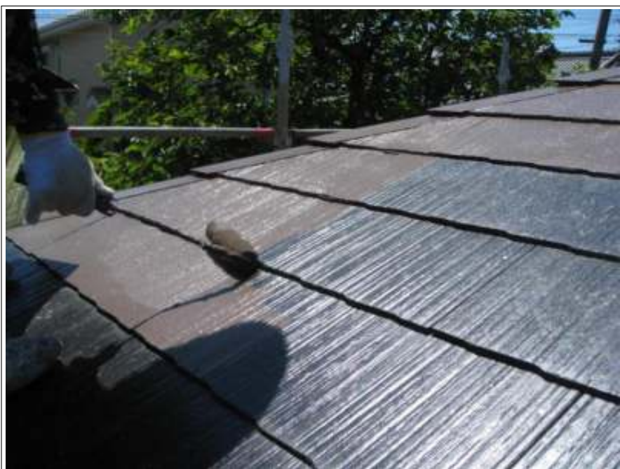
屋根中塗り施工状況