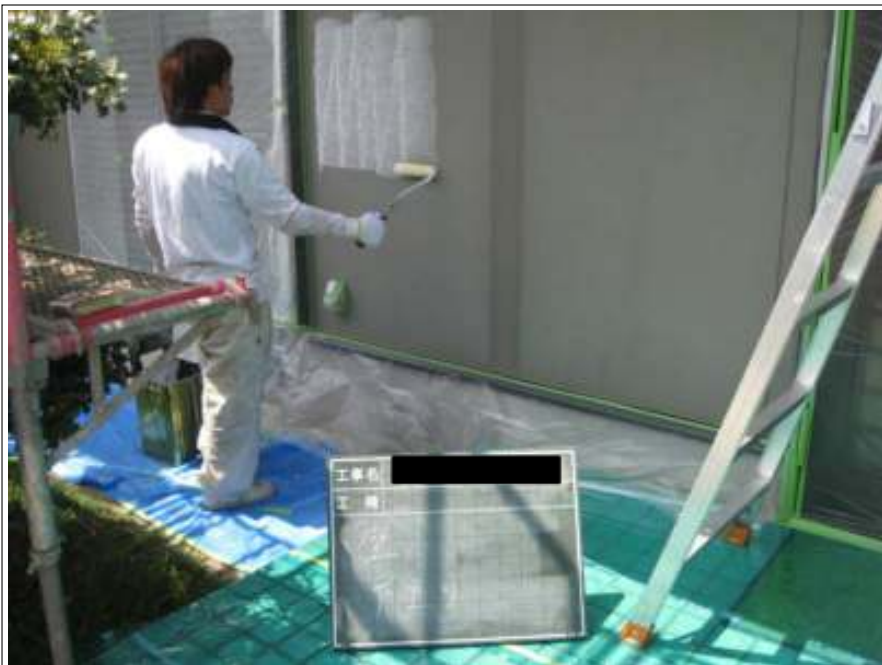
外壁下塗り施工状況