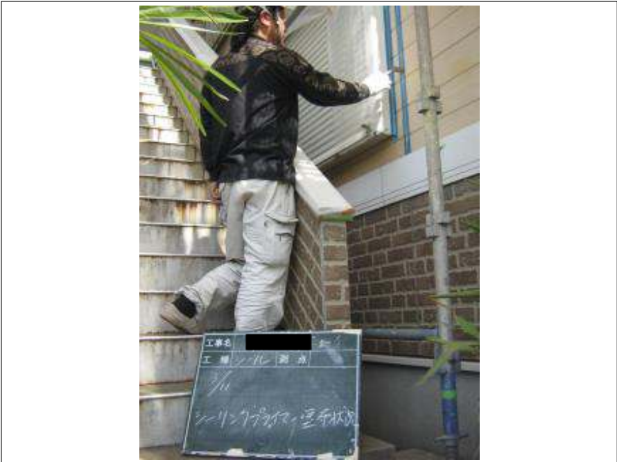
シーリングプライマー塗布施工中