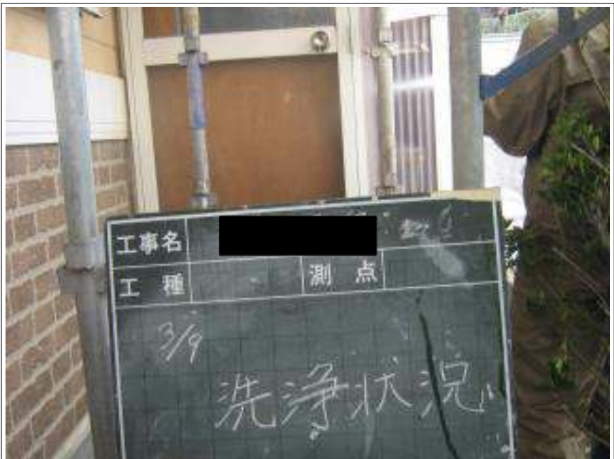
ストックヤード高圧洗浄施工中