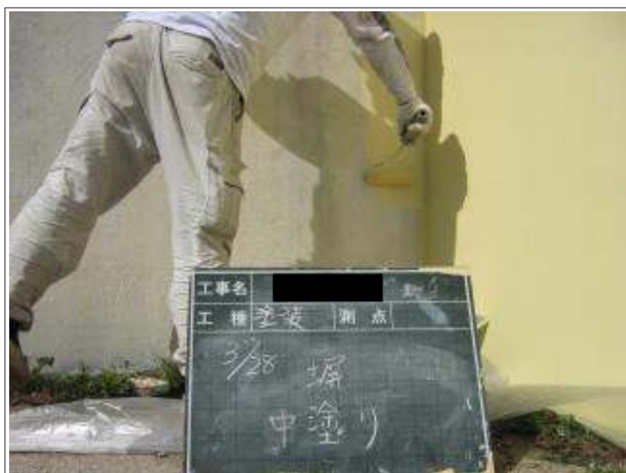
塀塗装中塗り施工中