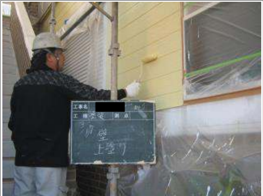
外壁塗装上塗り施工中