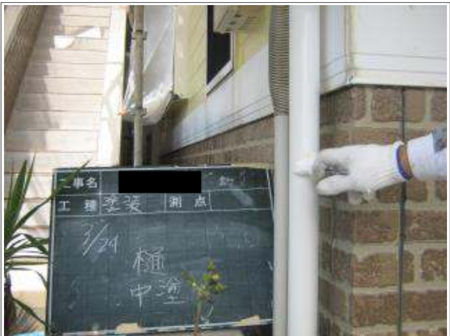
樋塗装中塗り施工中