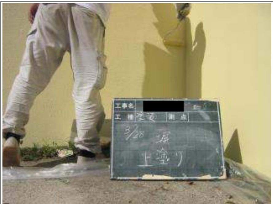
塀塗装上塗り施工中