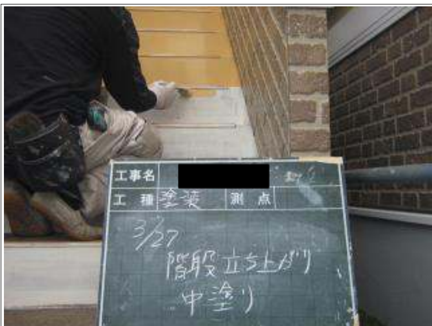
階段塗装中塗り施工中