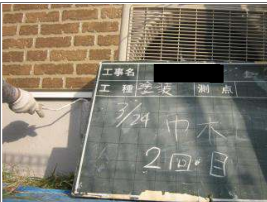
基礎塗装 2回目施工中