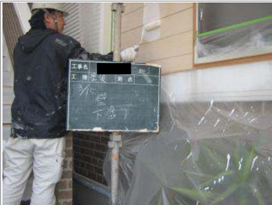
外壁塗装下塗り施工中