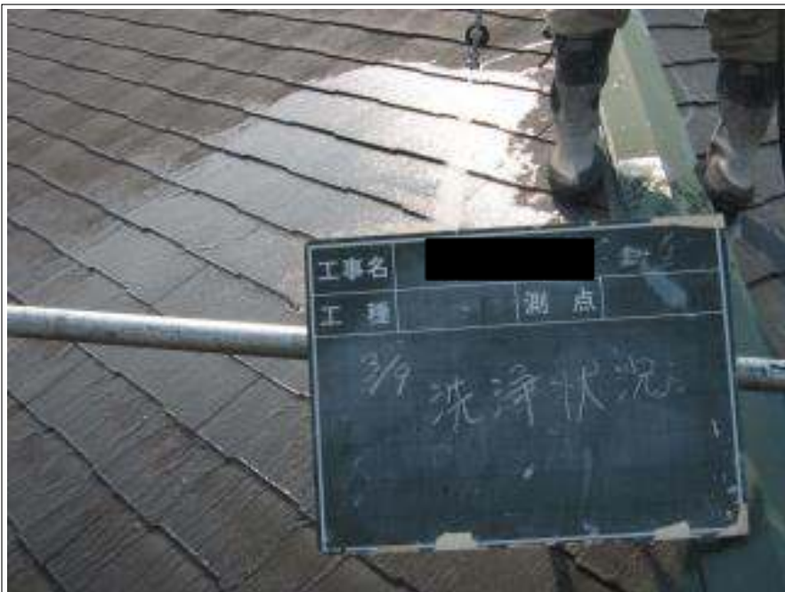
屋根高压洗浄施工中