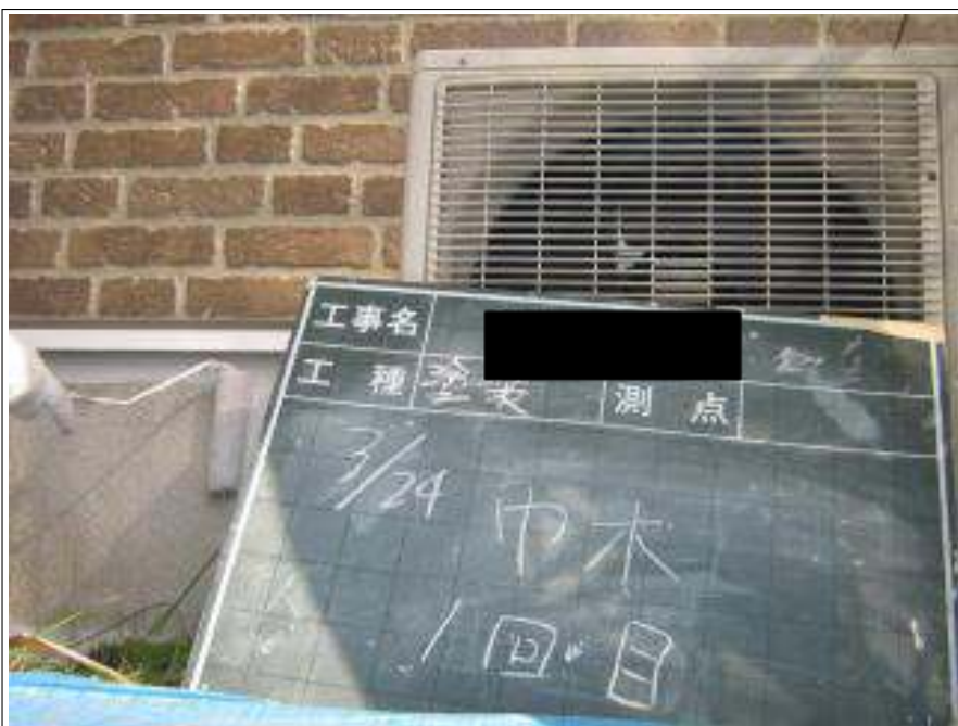
基礎塗装 1回目施工中