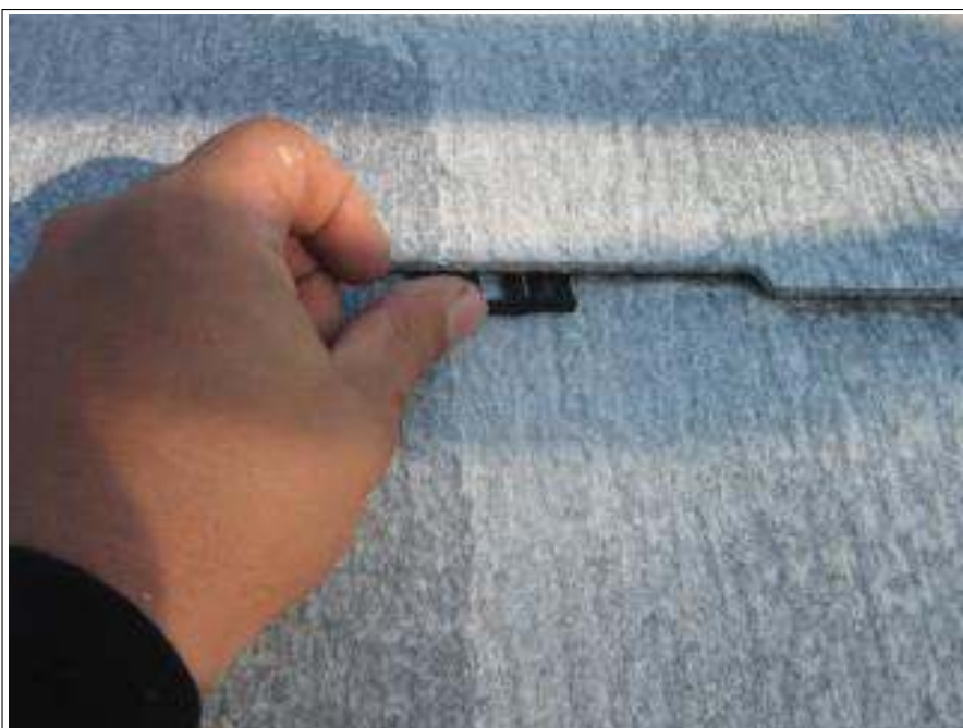
タスペーサー施工中