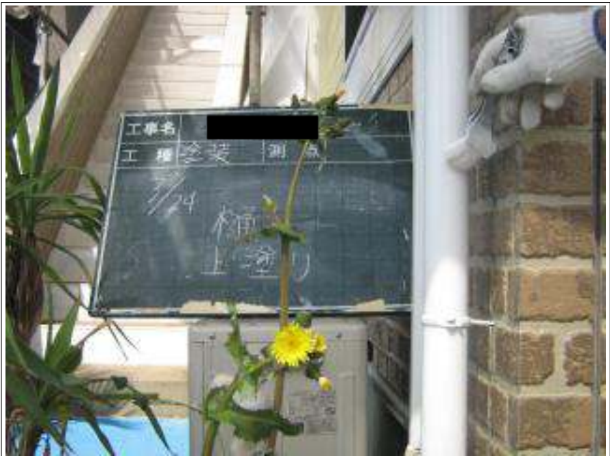
樋塗装上塗り施工中