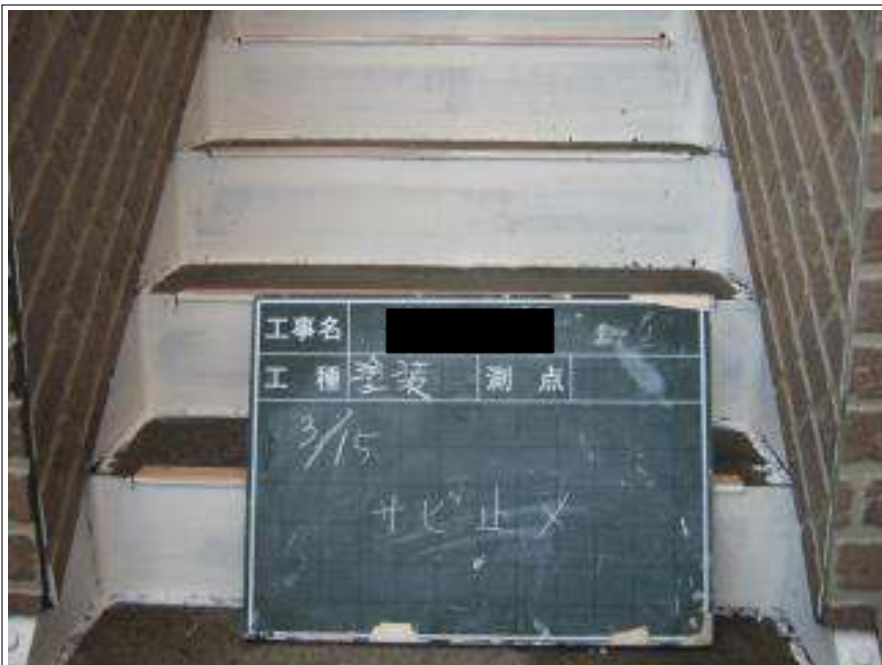
階段塗装サビ止め施工完了