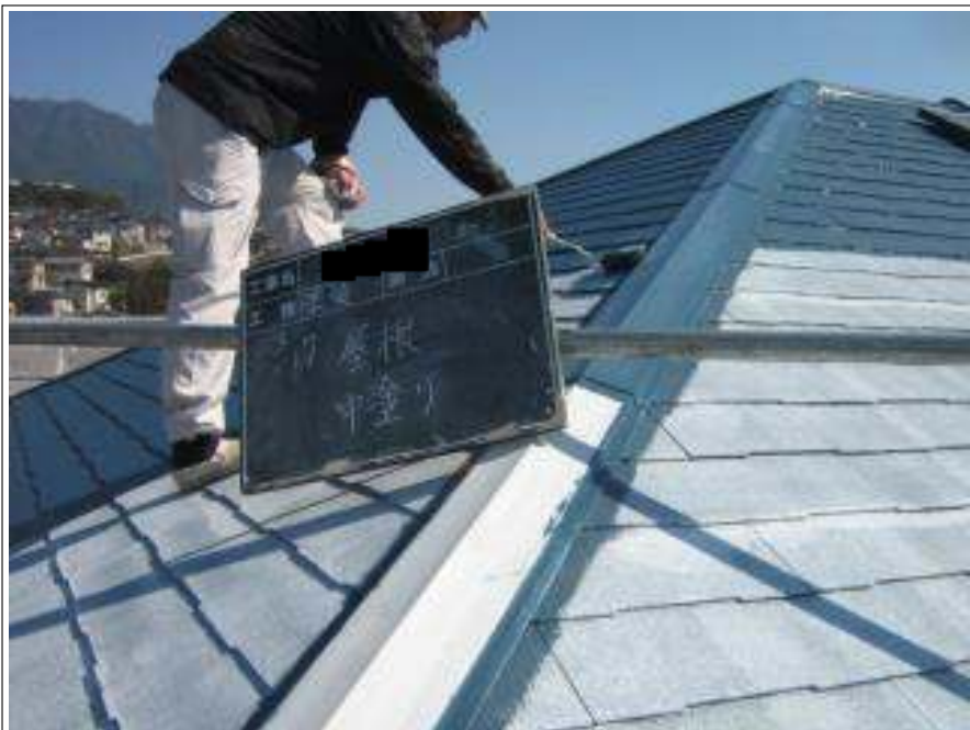
屋根塗装中塗り施工中