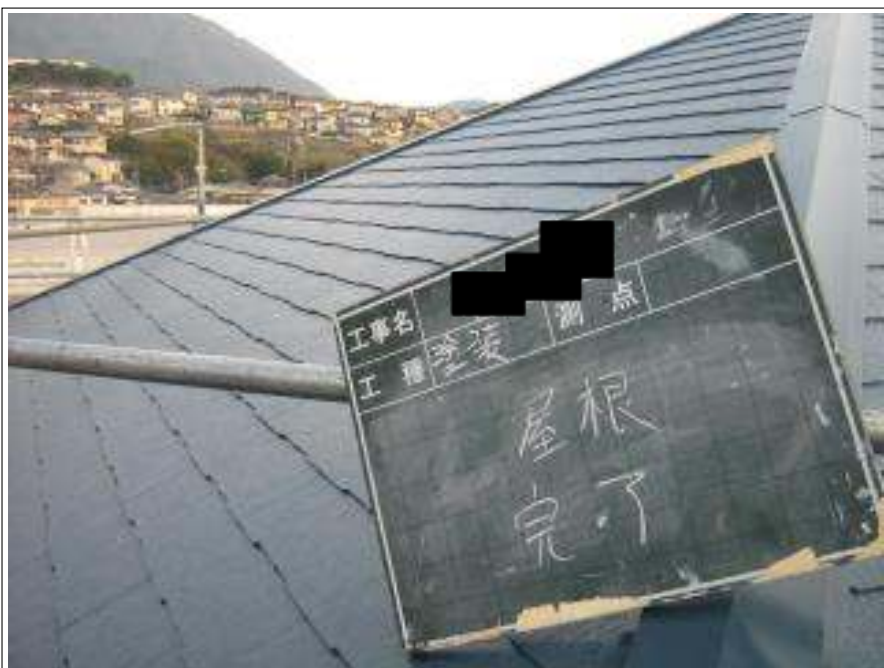
屋根塗装施工完了