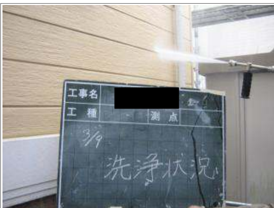
外壁高压洗浄施工中