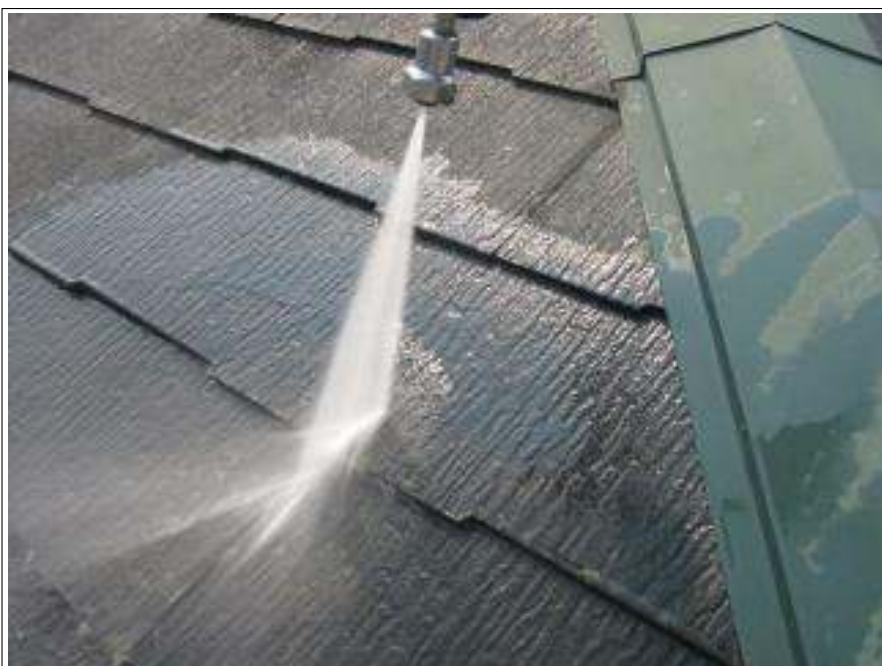
屋根高压洗浄施工中