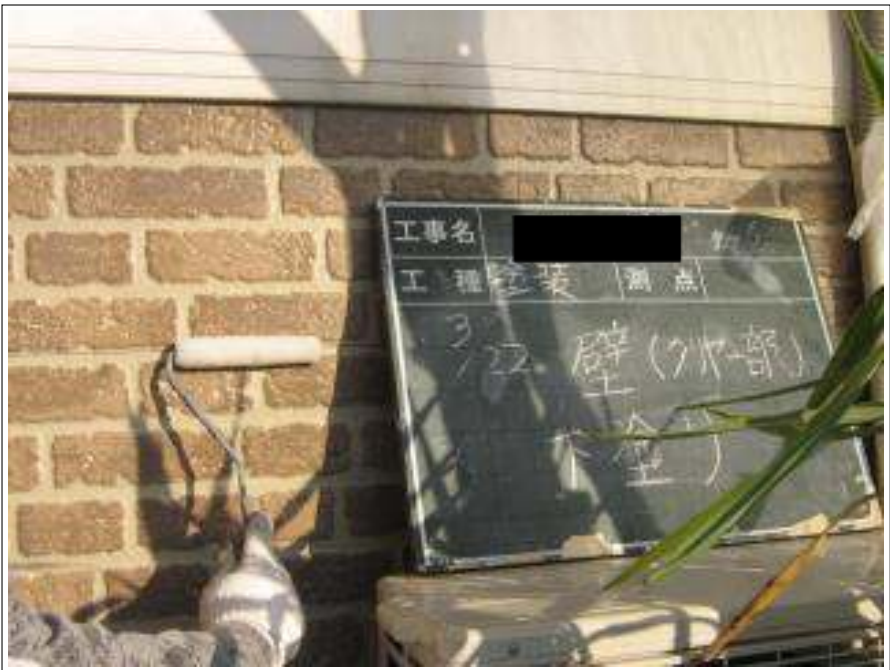
外壁塗装クリヤー部下塗り施工中