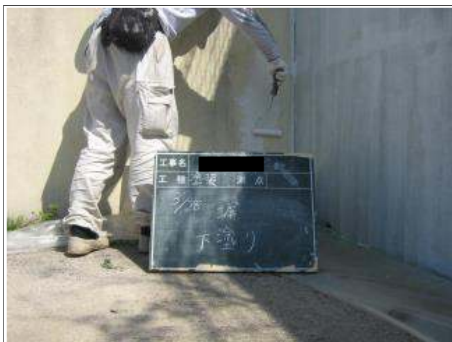
塀塗装下塗り施工中