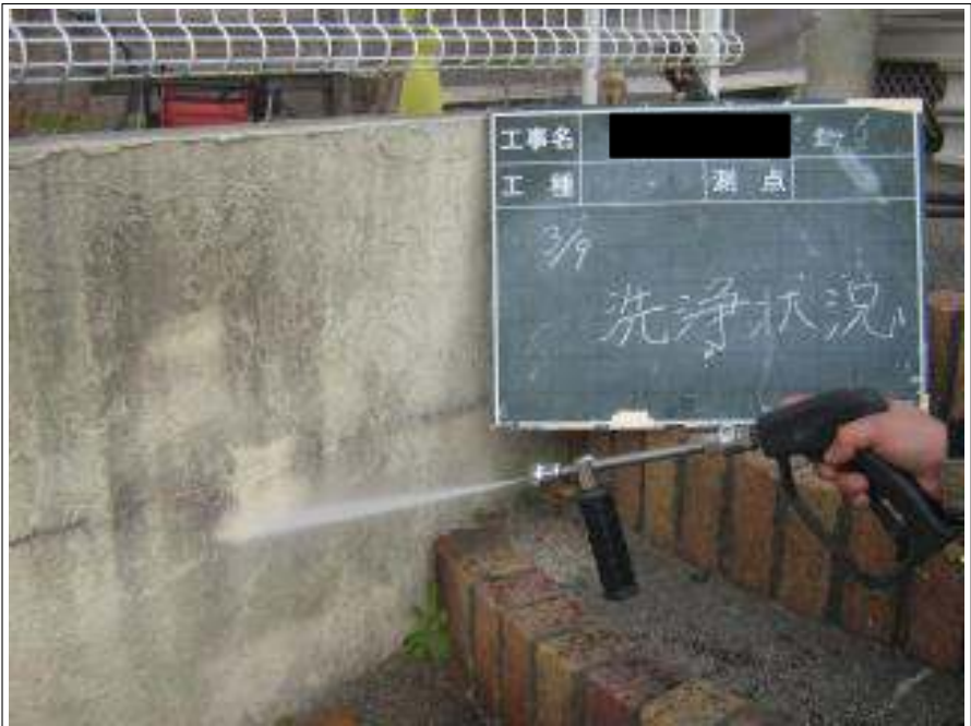
塀高圧洗浄施工中