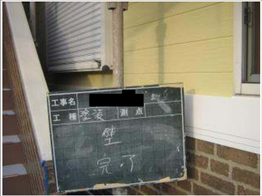
外壁塗装施工完了