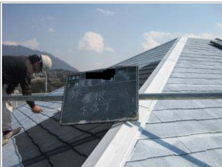
屋根塗装下塗り施工中