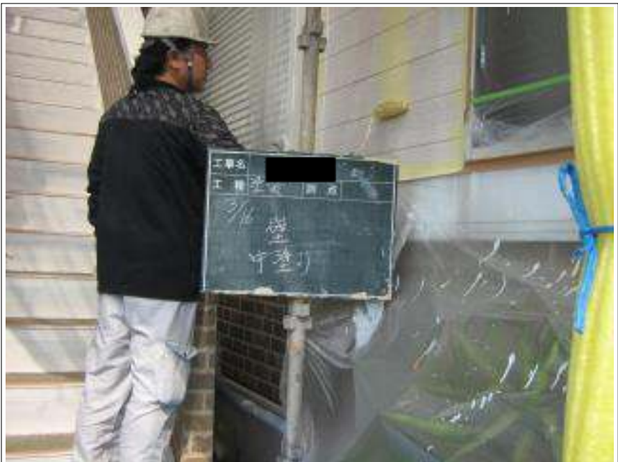
外壁塗装中塗り施工中