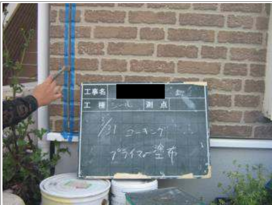
コーキングプライマー塗布施工中