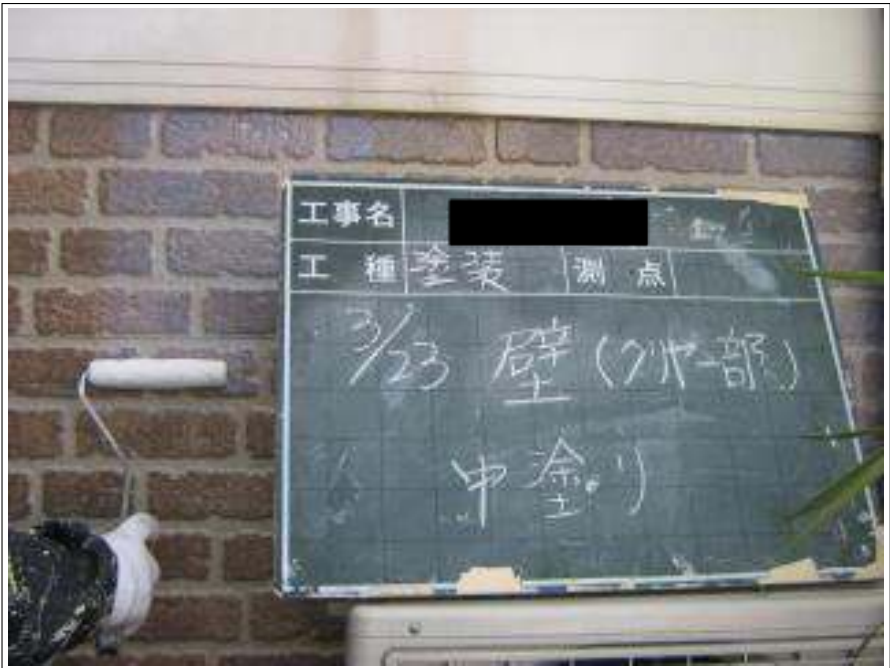
外壁塗装クリヤー部中塗り施工中