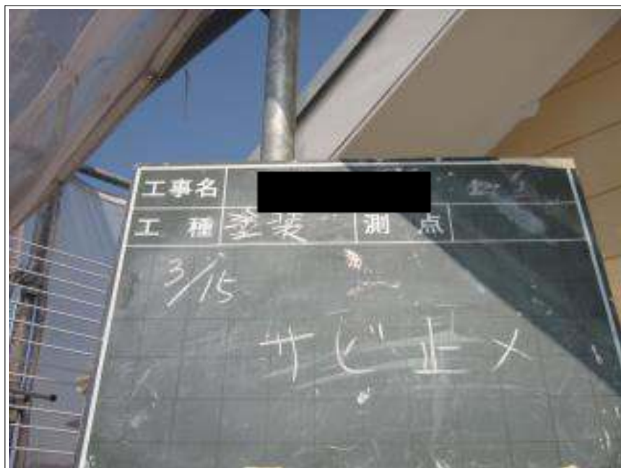
サビ止め施工完了