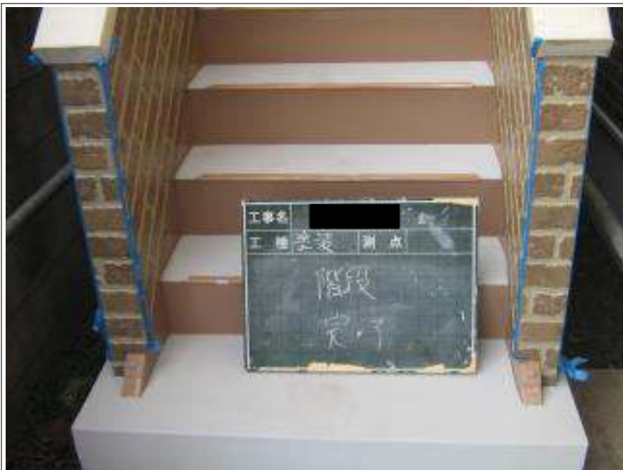
階段塗装施工完了