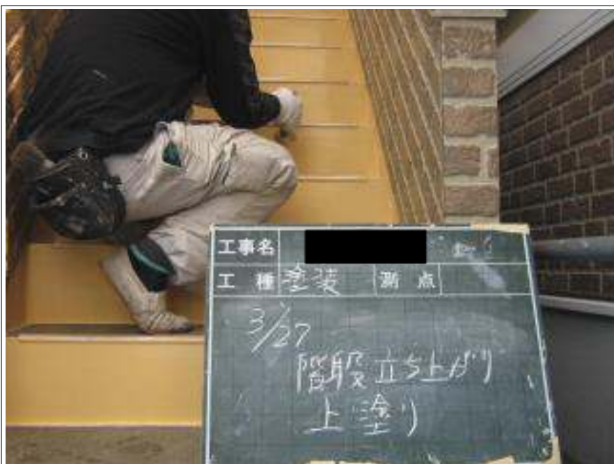
階段塗装上塗り施工中