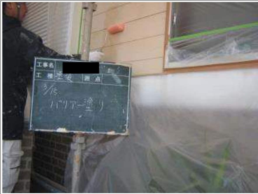
外壁バリアー施工中