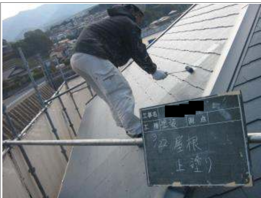
屋根塗装上塗り施工中