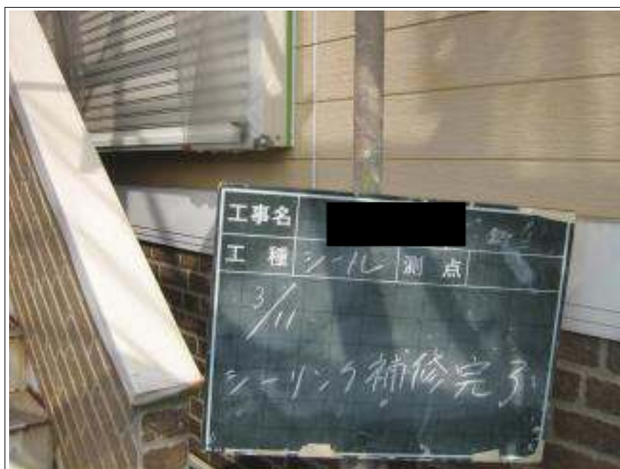
シーリング補修施工完了