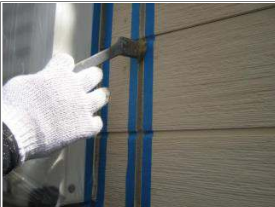
シーリングプライマー塗布施工中