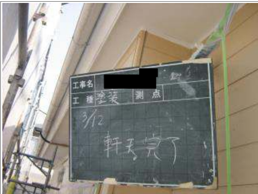
軒天塗装施工完了