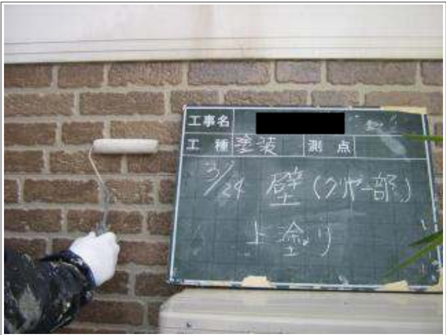
外壁塗装クリヤー部上塗り施工中