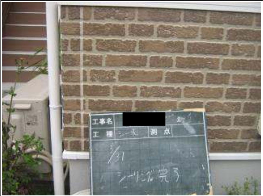
コーキング補修施工完了