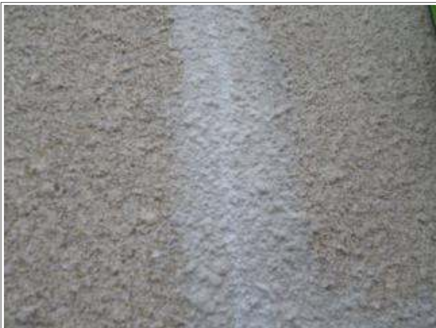
外壁クラック補修施工完了