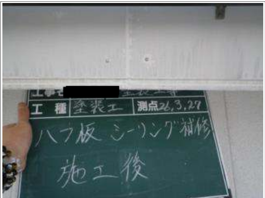
破風板シーリング補修施工完了