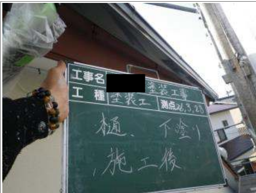
樋塗装下塗り施工完了