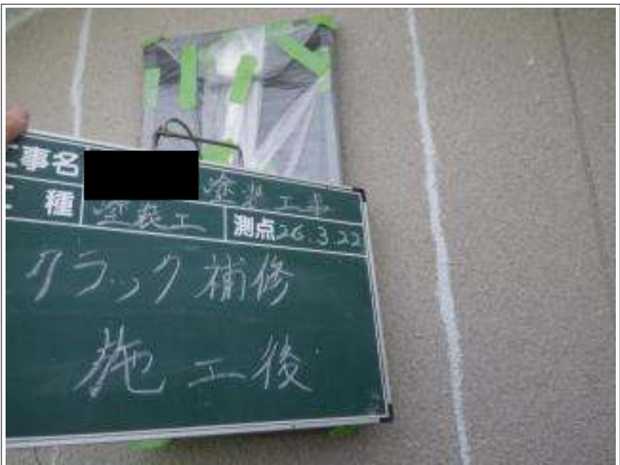
外壁クラック補修施工完了