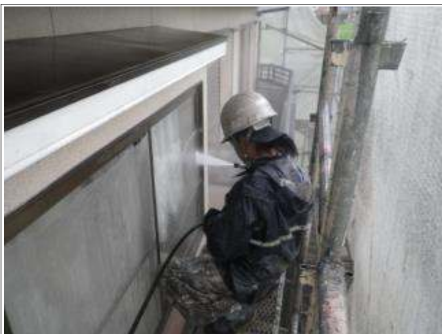
窓高压洗净施工中