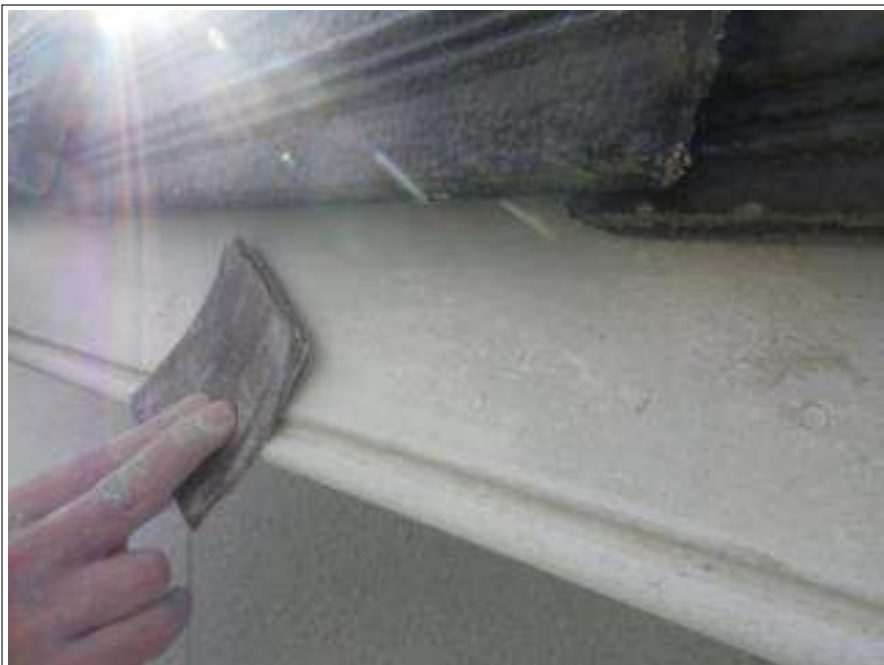
破風板ケレン施工中