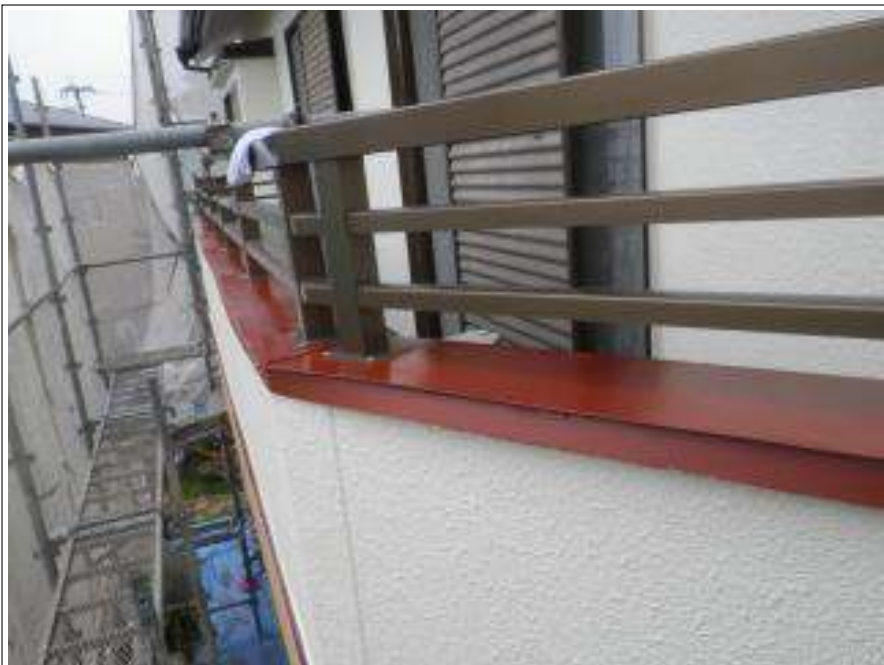
ベランダ笠木サビ止め施工完了