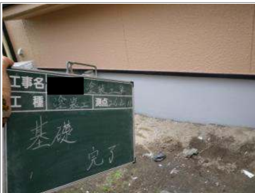
基礎塗装上塗り施工完了