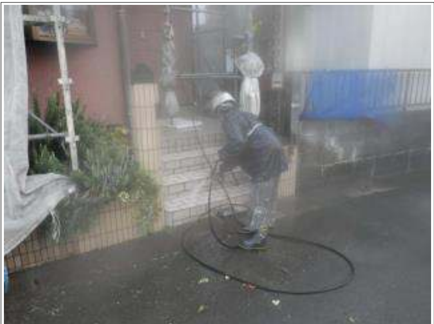
階段高圧洗浄施工中