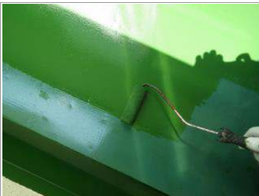
バルコニー防水塗装上塗り施工中