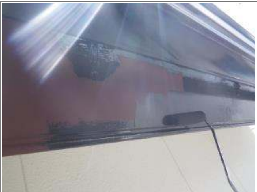
破風板塗装上塗り施工中