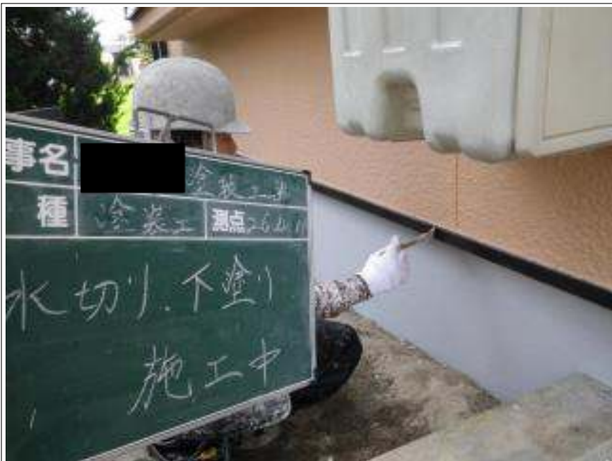
水切り塗装下塗り施工中