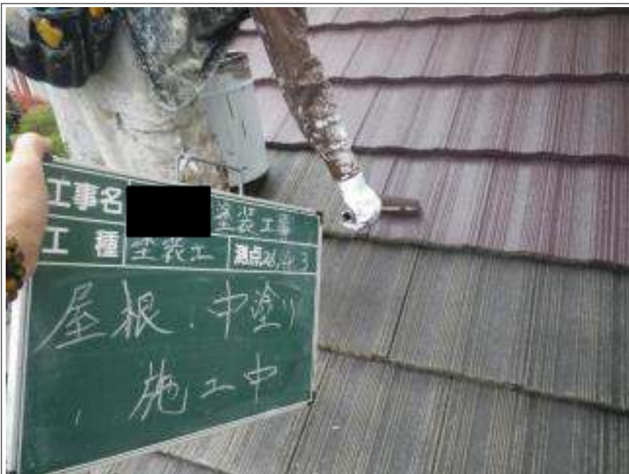
屋根塗装中塗り施工中