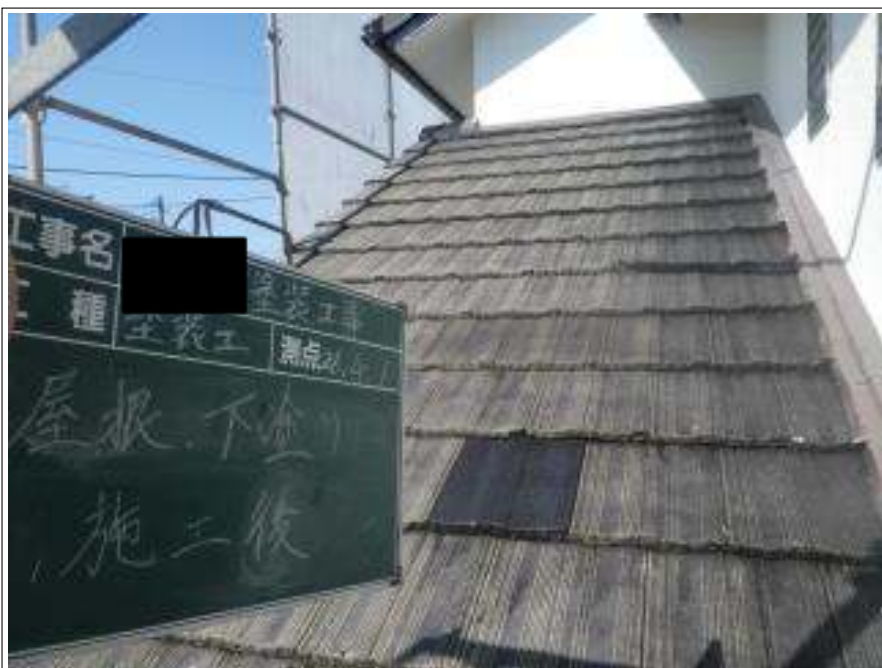
屋根塗装下塗り施工完了