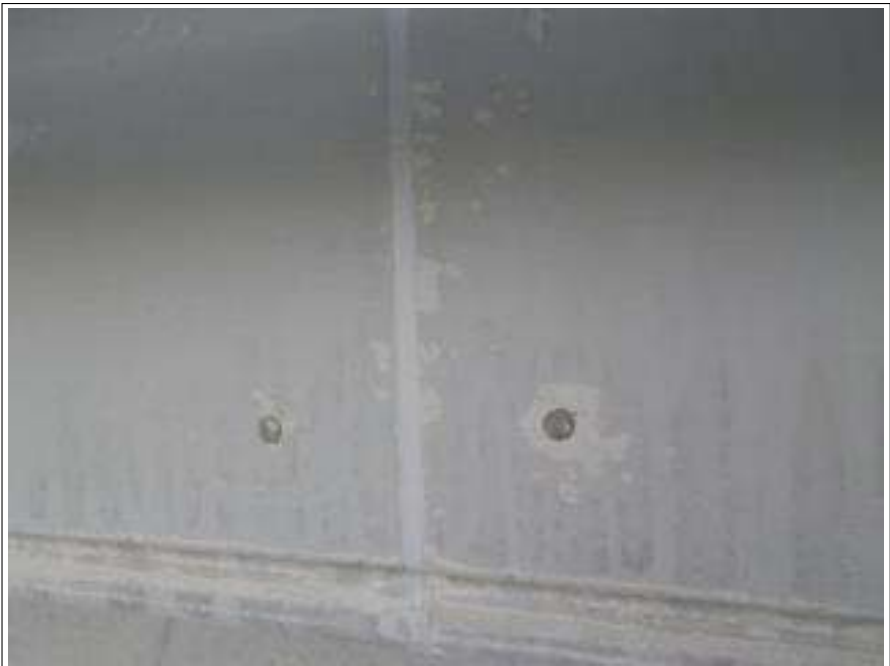
破風板シーリング補修施工完了