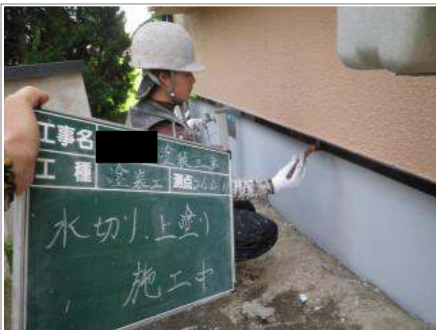
水切り塗装上塗り施工中