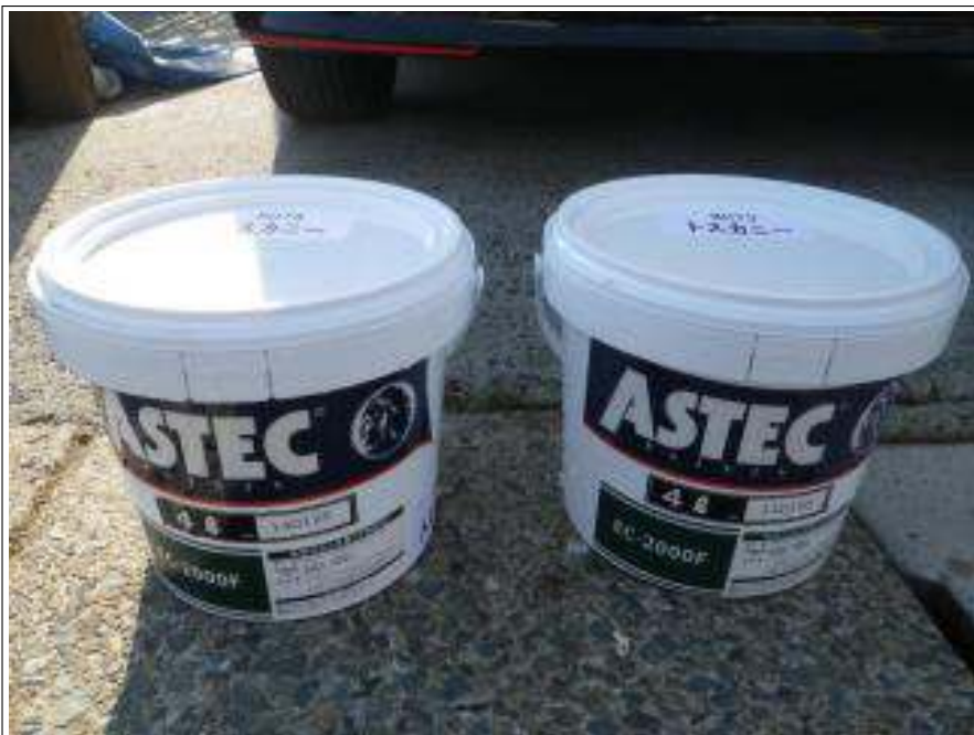
外壁上塗り使用材料