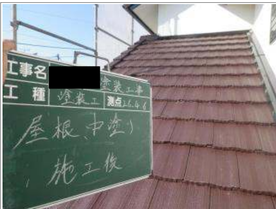
屋根塗装中塗り施工完了