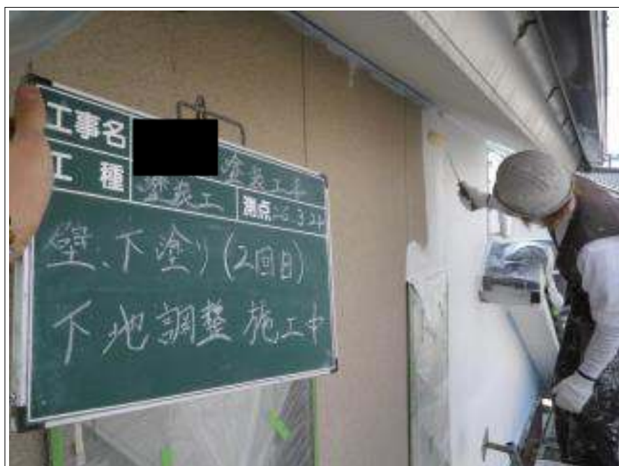
外壁塗装下塗り 2 回目施工中