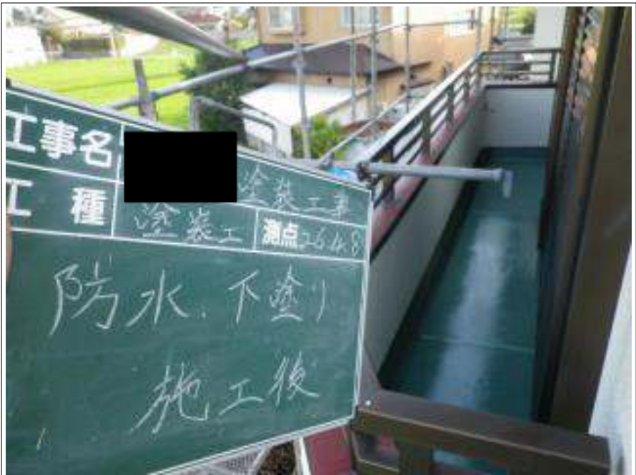
バルコニー防水塗装下塗り施工完了