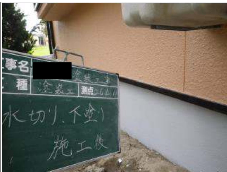
水切り塗装下塗り施工完了