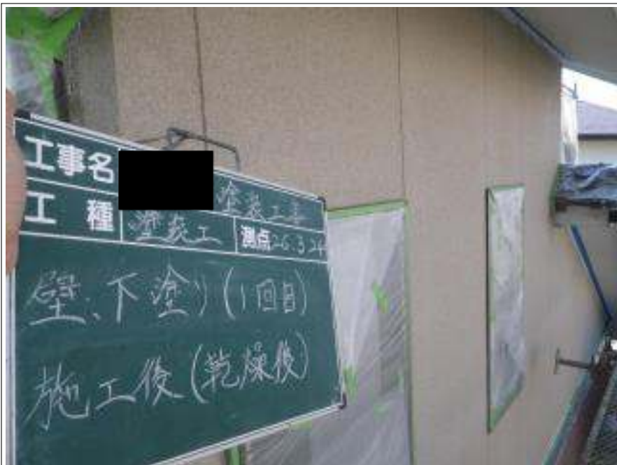
外壁塗装下塗り 1 回目施工完了