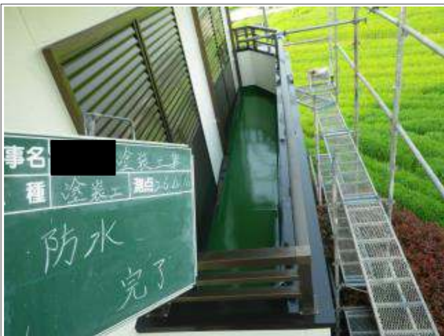
バルコニー防水塗装施工完了