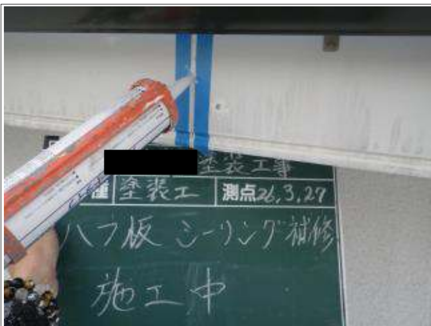
破風板シーリング補修施工中