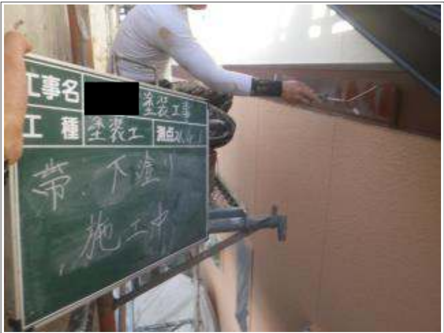
胴差し塗装下塗り施工中