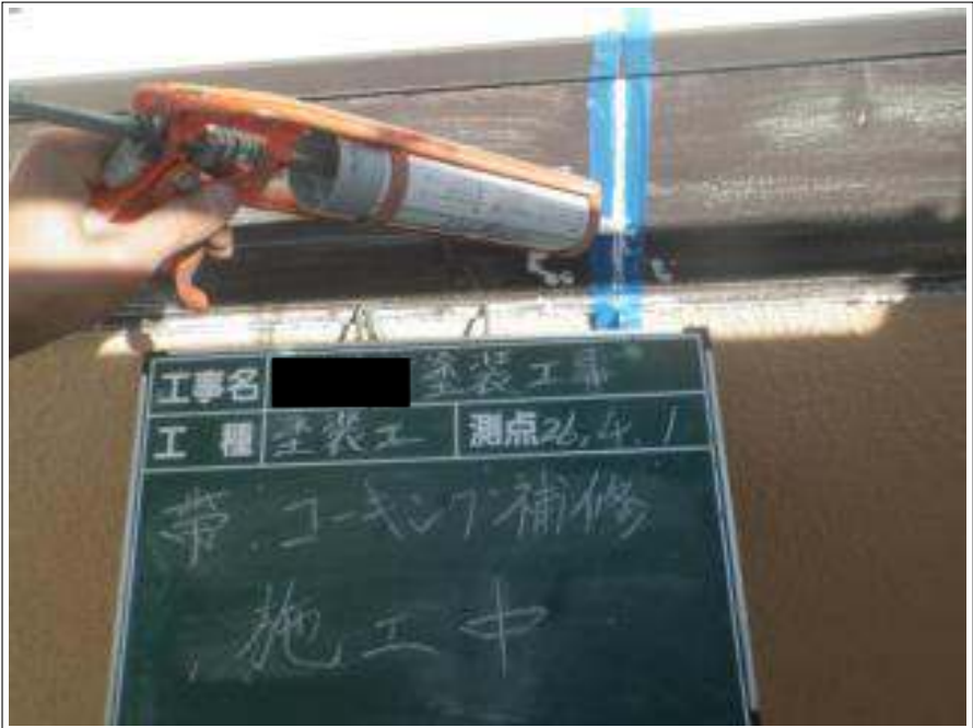
胴差しコーキング補修施工中