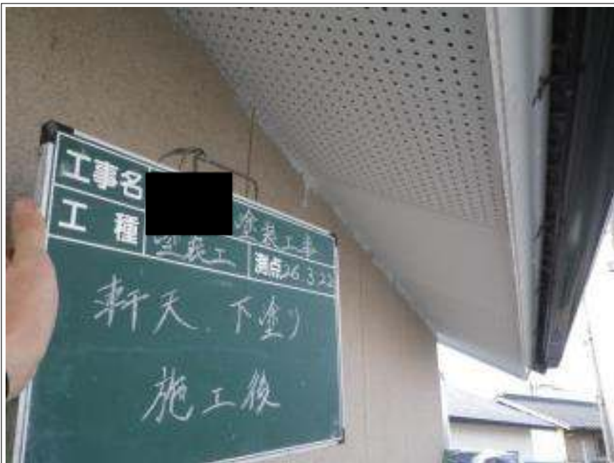
軒天塗装下塗り施工完了