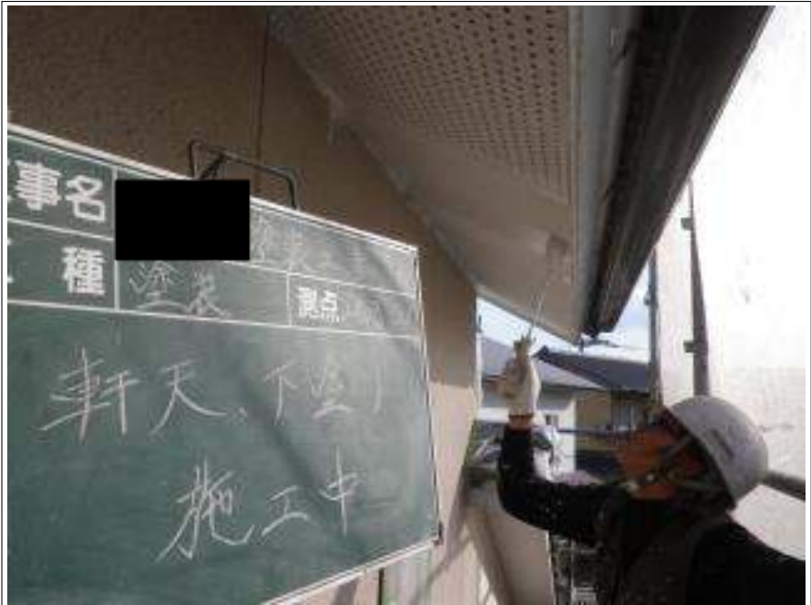
軒天塗装下塗り施工中