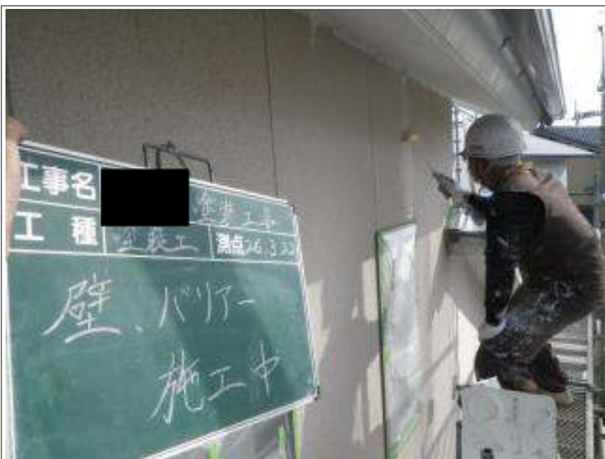
外壁塗装バリアー施工中