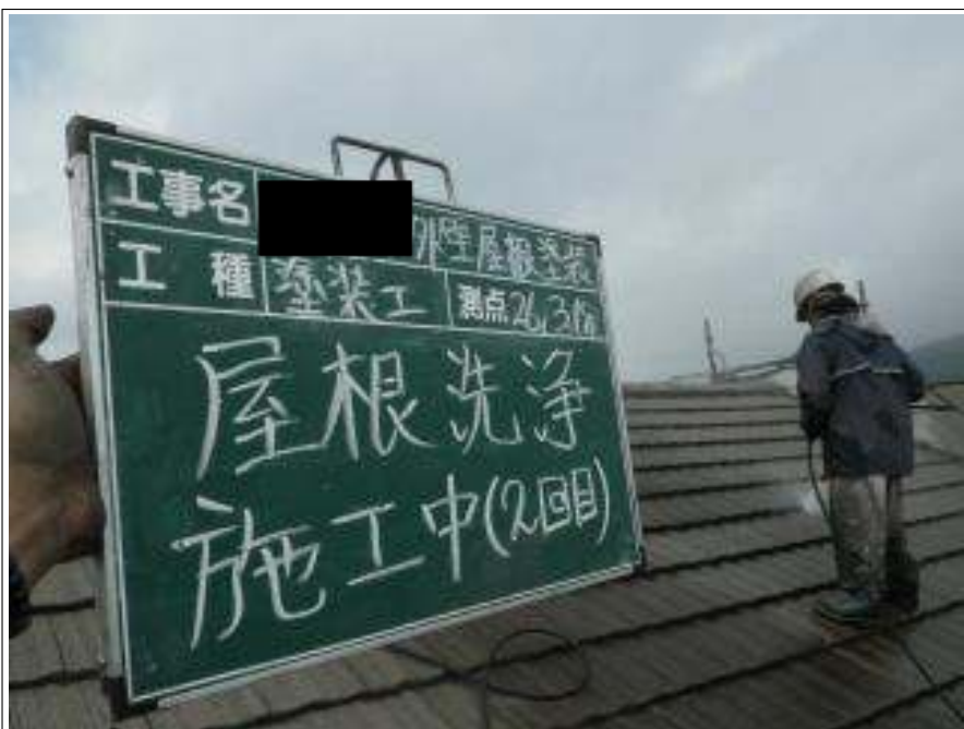
屋根高压洗净 2 回目施工中