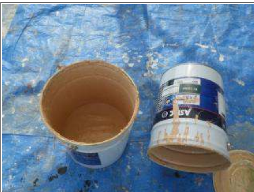
外壁上塗り使用材料空缶