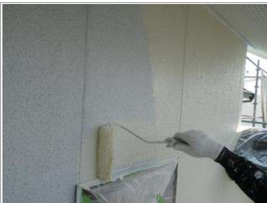
外壁塗装中塗り施工中