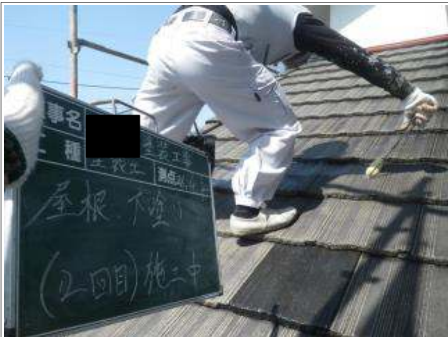
屋根塗装下塗り 2 回目施工中