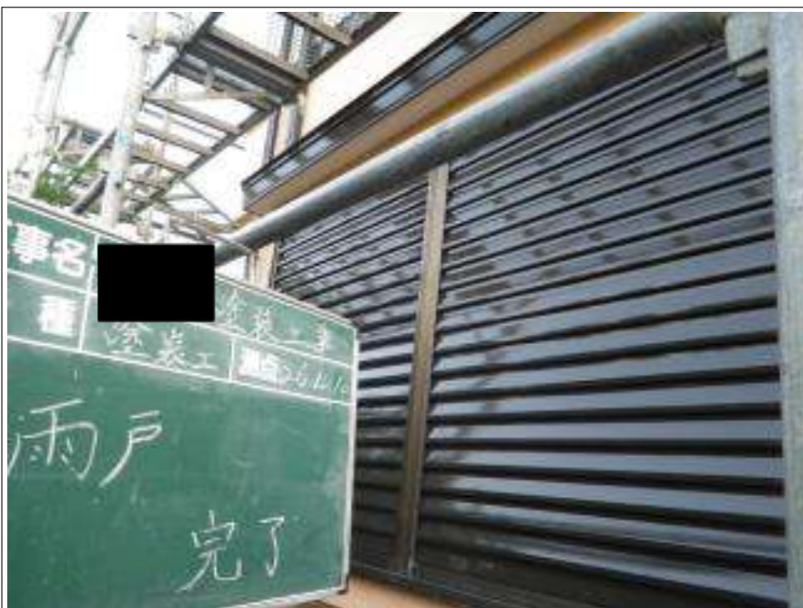
雨戸塗装施工完了