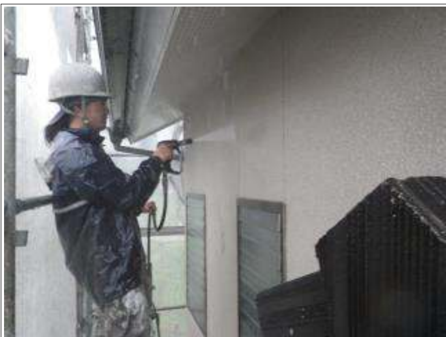
外壁高压洗净施工中