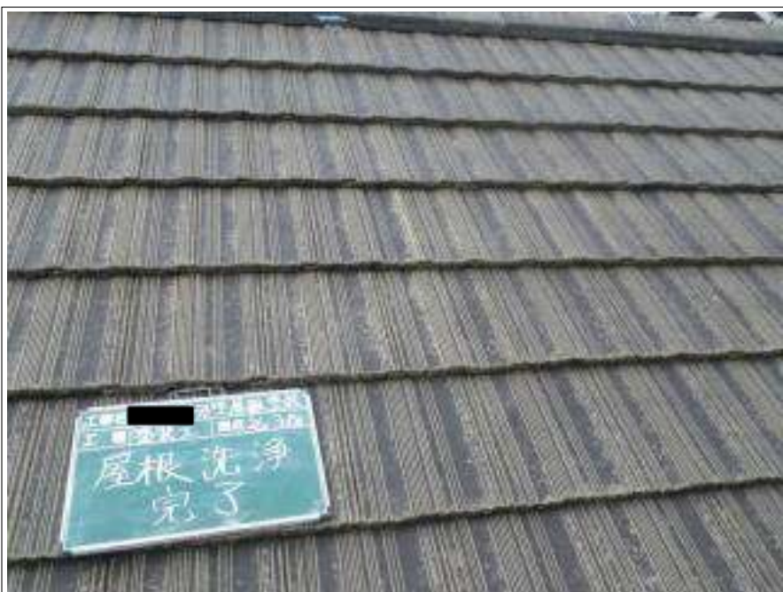
屋根高压洗净施工完了