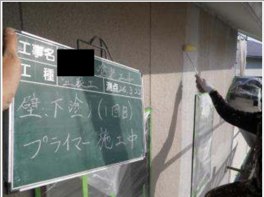
外壁塗装下塗り 1 回目施工中