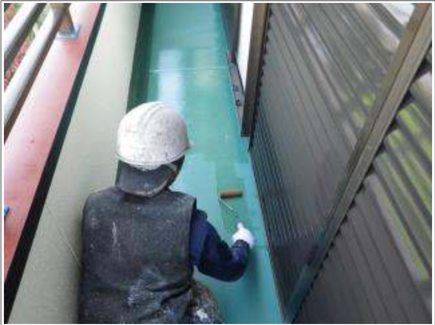
バルコニー防水塗装下塗り施工中