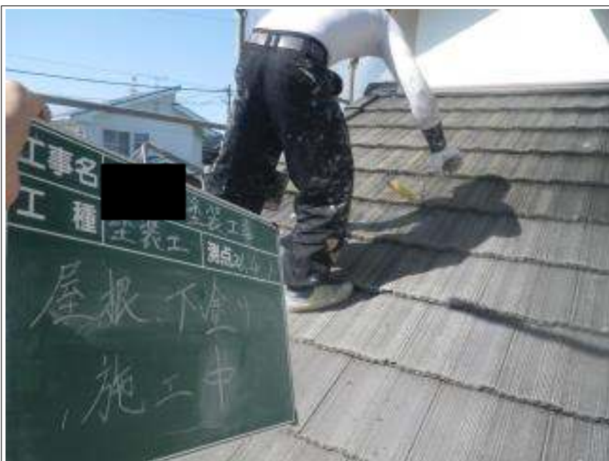
屋根塗装下塗り施工中