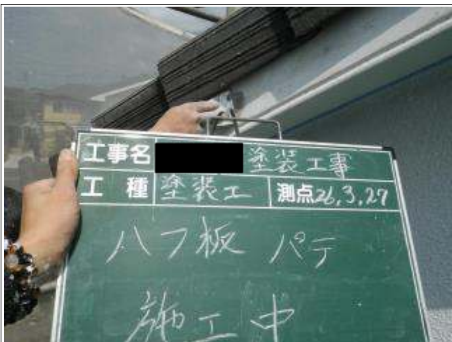
破風板パテ施工中