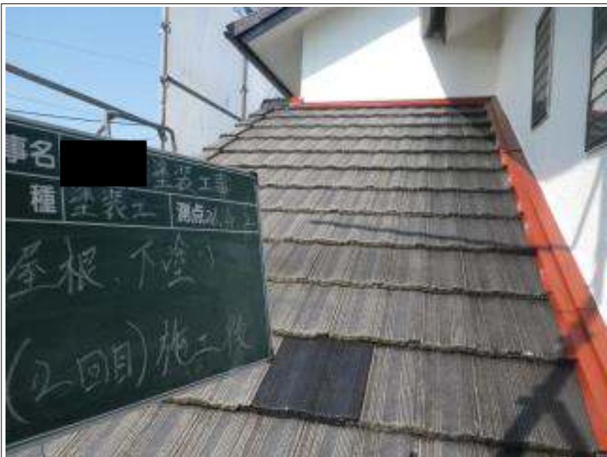
屋根塗装下塗り 2 回目施工完了