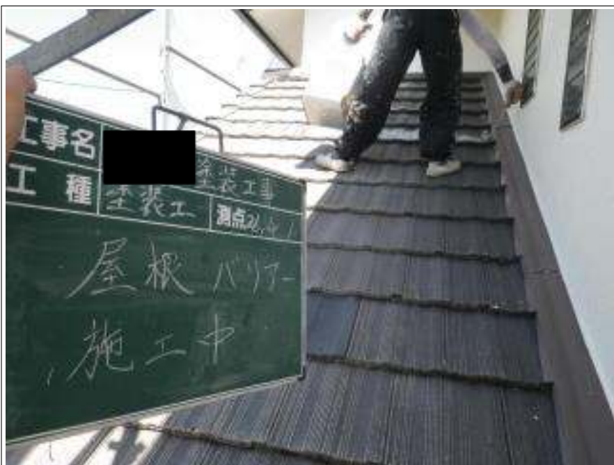
屋根塗装バリアー施工中