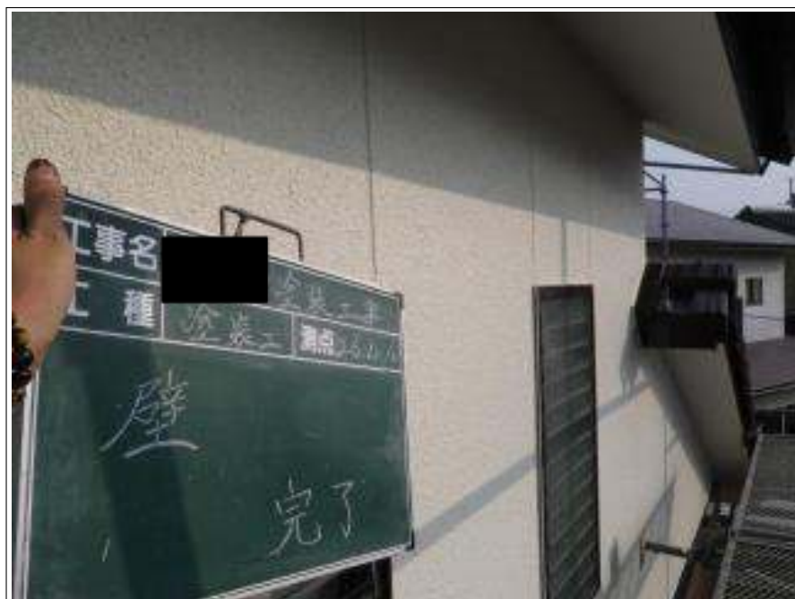
外壁塗装上塗り施工完了