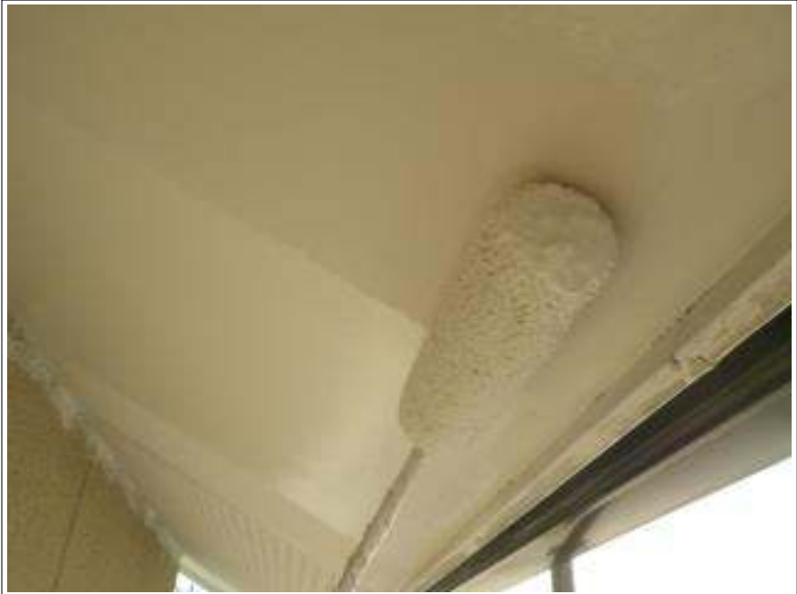
軒天塗装下塗り施工中