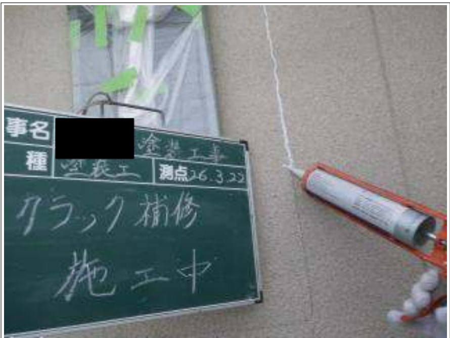
外壁クラック補修施工中