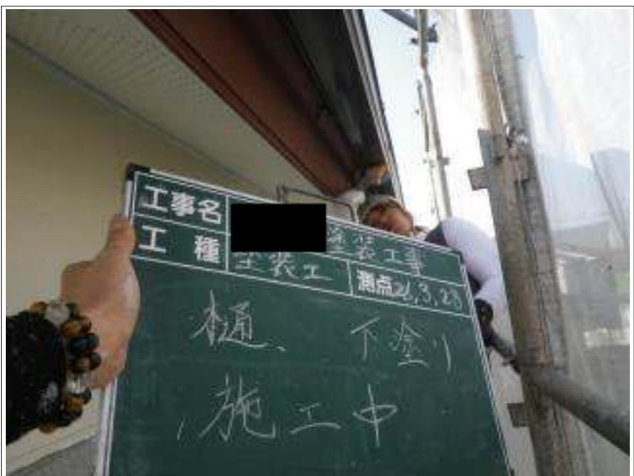
樋塗装下塗り施工中