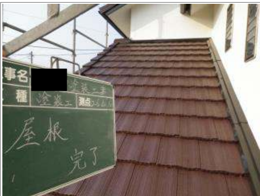
屋根塗装上塗り施工完了