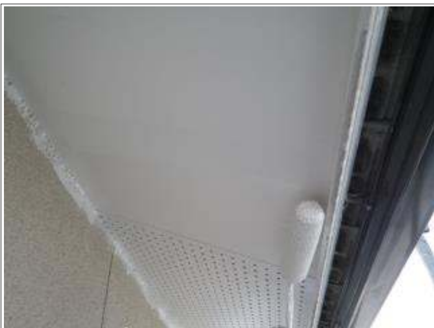
軒天塗装上塗り施工中