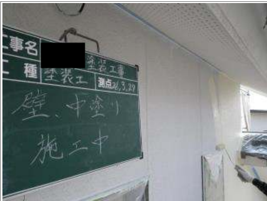
外壁塗装中塗り施工中