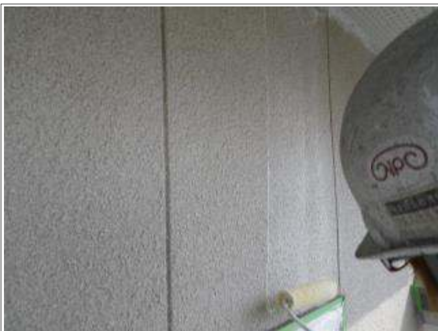
外壁塗装バリアー施工中