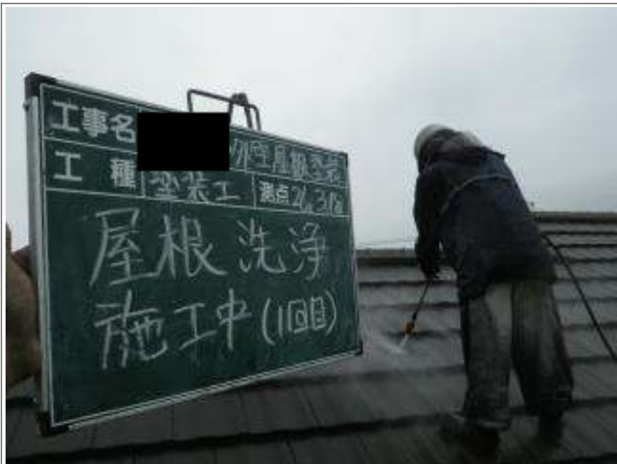
屋根高压洗净 1 回目施工中