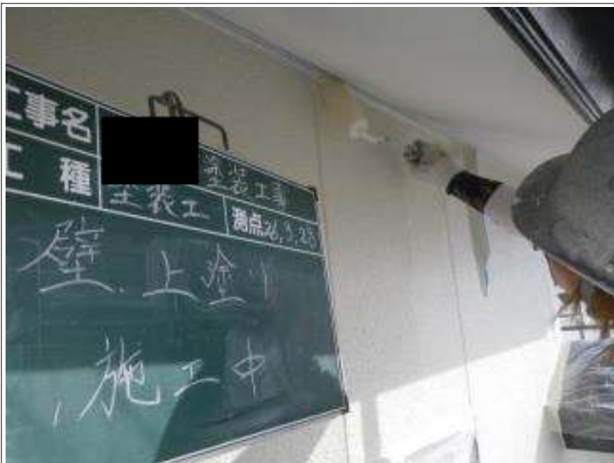
外壁塗装上塗り施工中