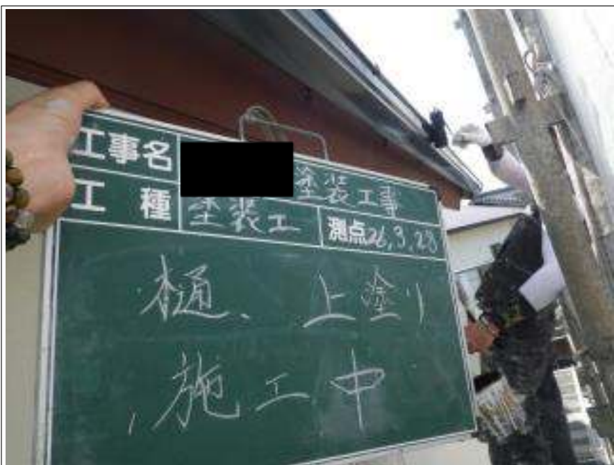
樋塗装上塗り施工中