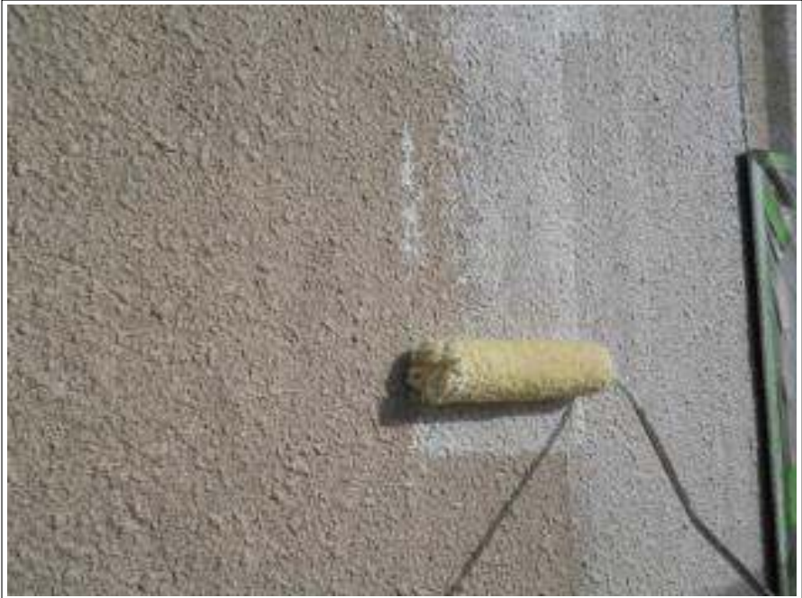
外壁塗装下塗り 1 回目施工中