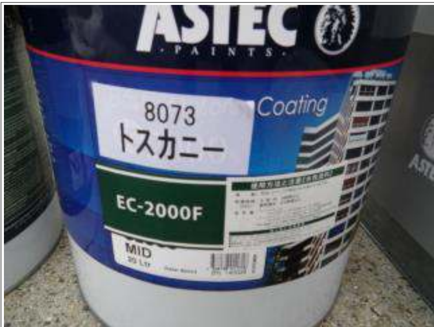
外壁上塗り使用材料