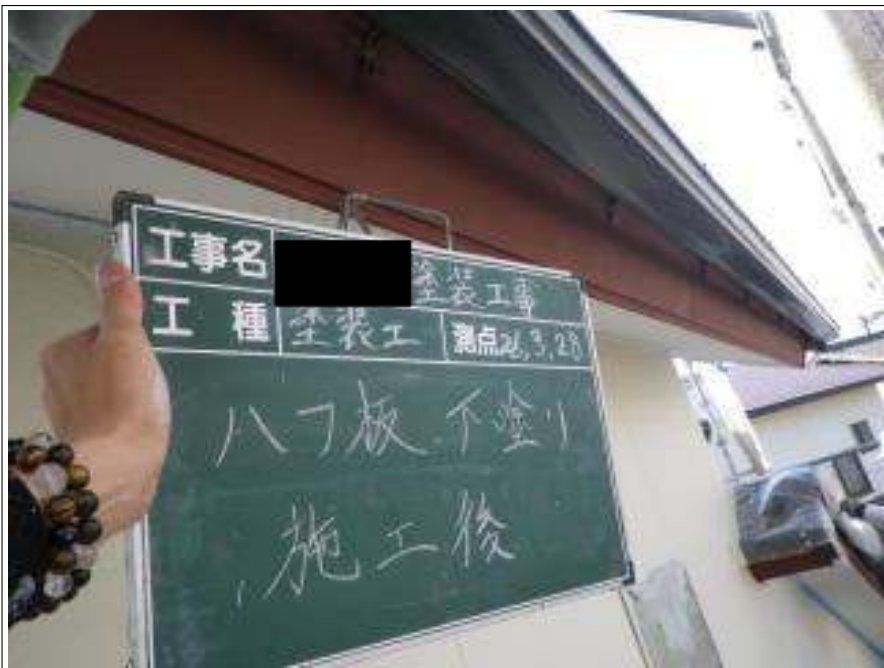
破風板塗装下塗り施工完了