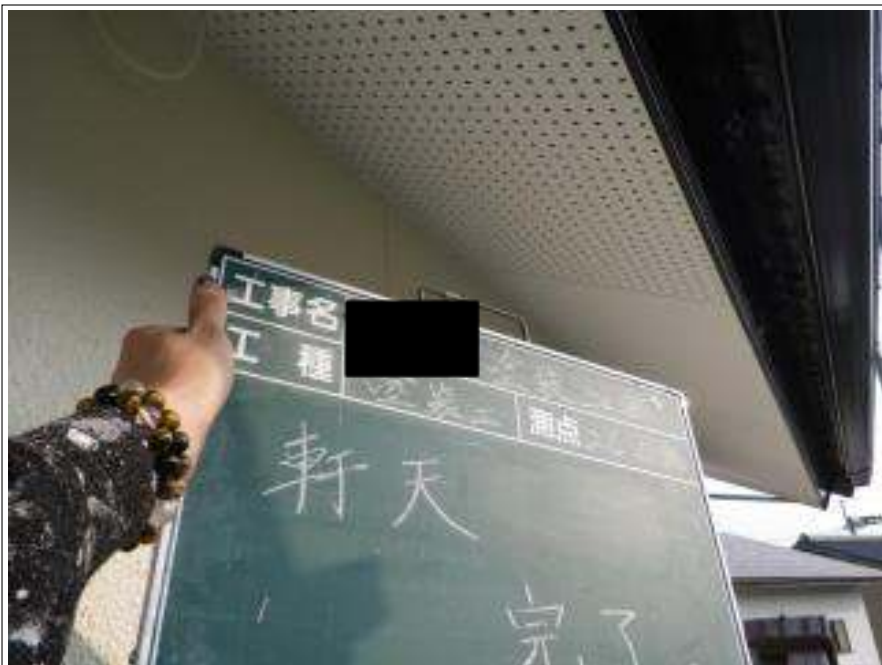
軒天塗装上塗り施工完了