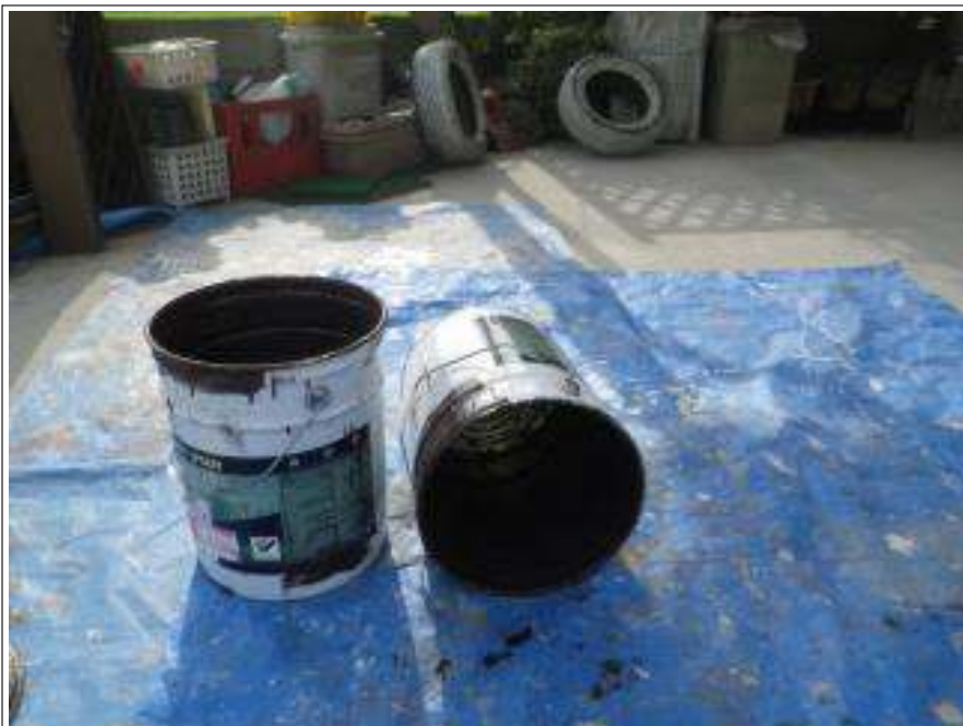
屋根上塗り使用材料空缶