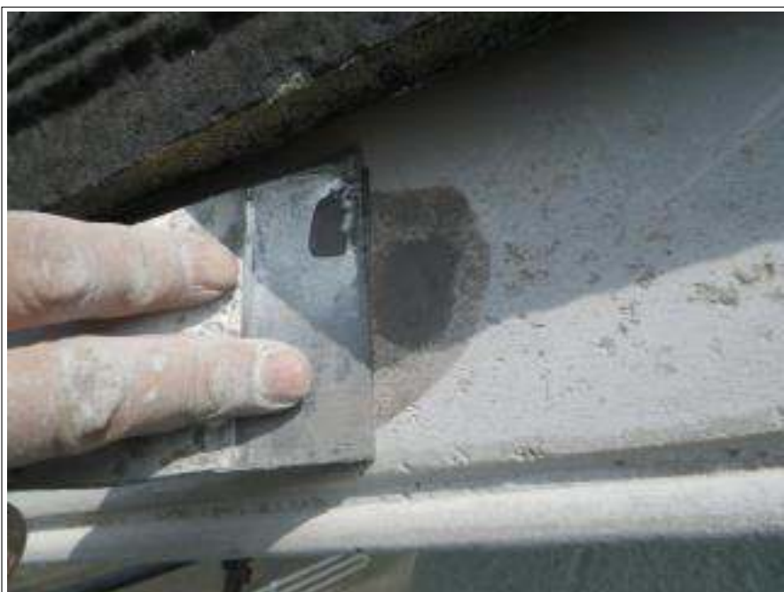
破風板パテ施工中