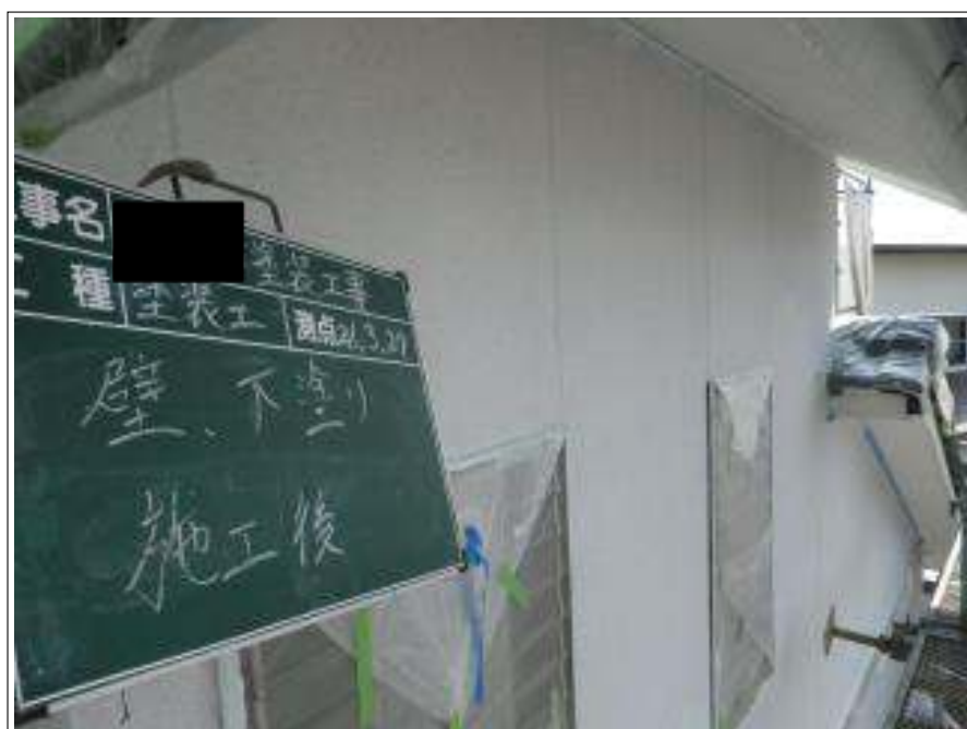
外壁塗装下塗り施工完了