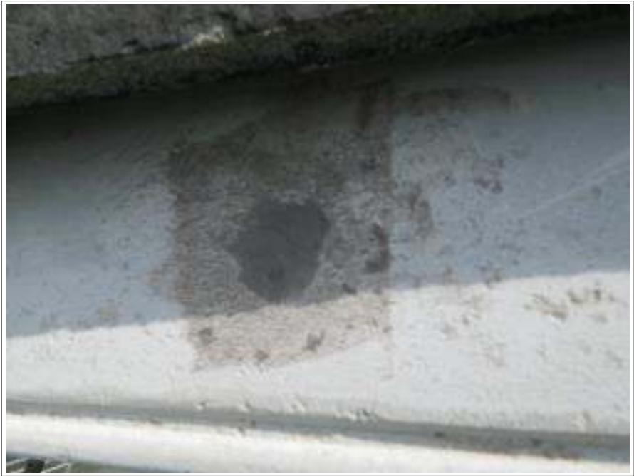
破風板パテ施工完了