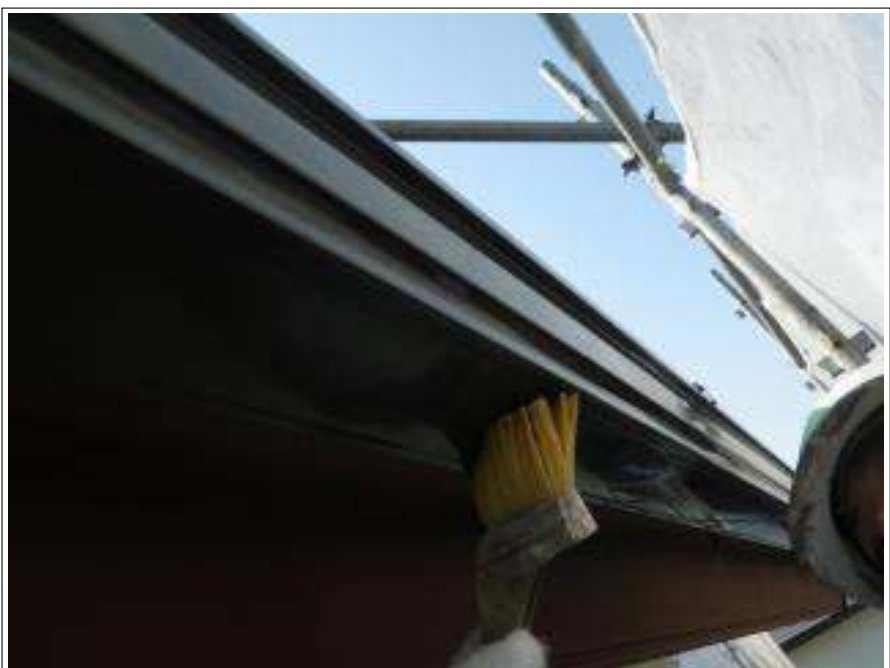
樋塗装下塗り施工中