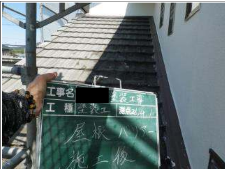
屋根塗装バリアー施工完了