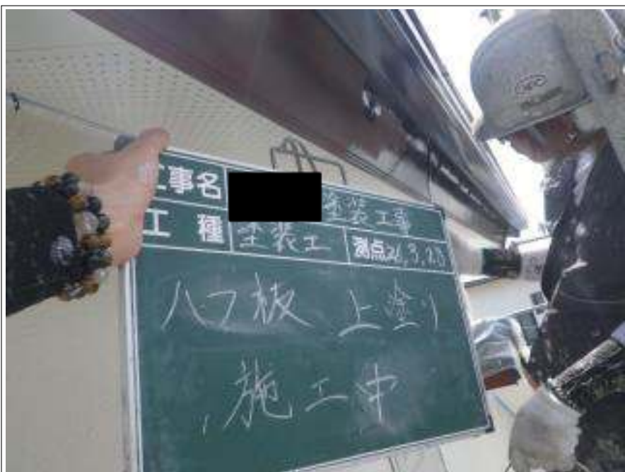
破風板塗装上塗り施工中