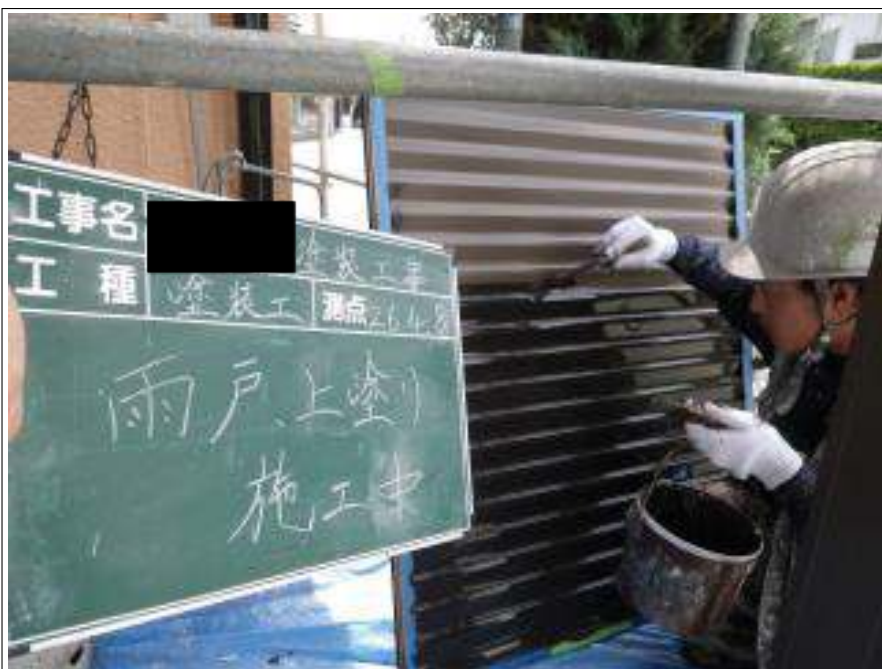
雨戸塗装上塗り施工中