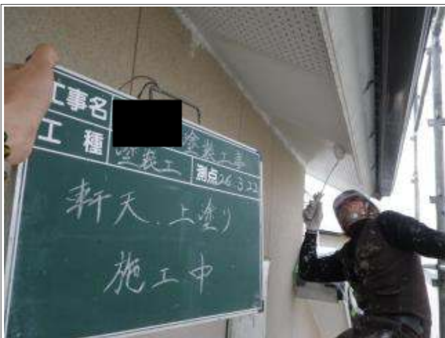
軒天塗装上塗り施工中