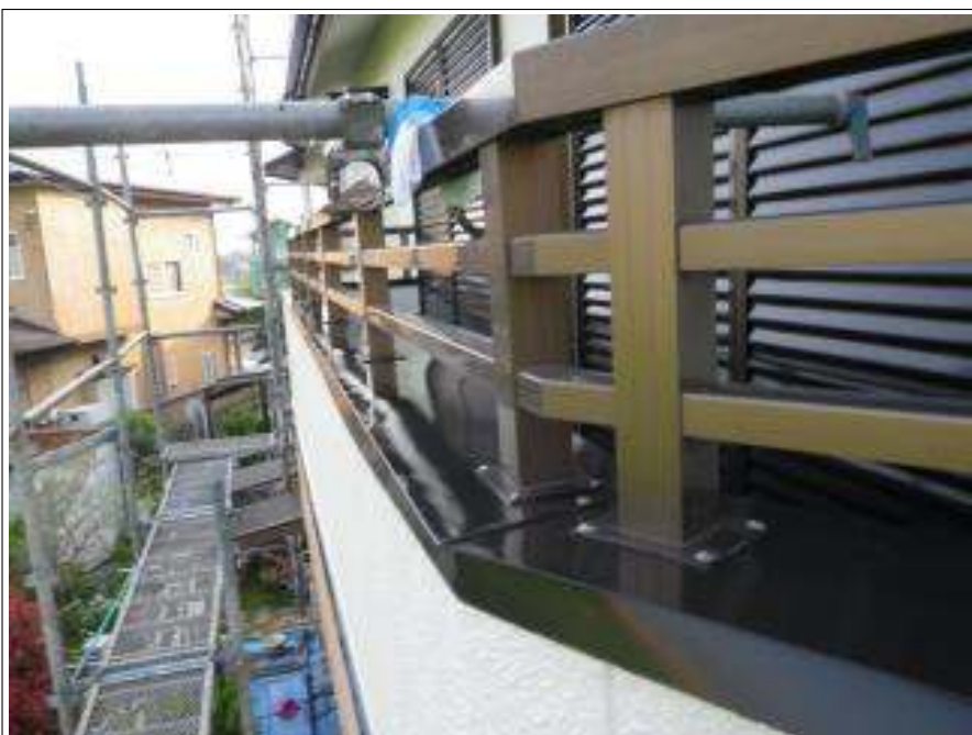
ベランダ笠木施工完了