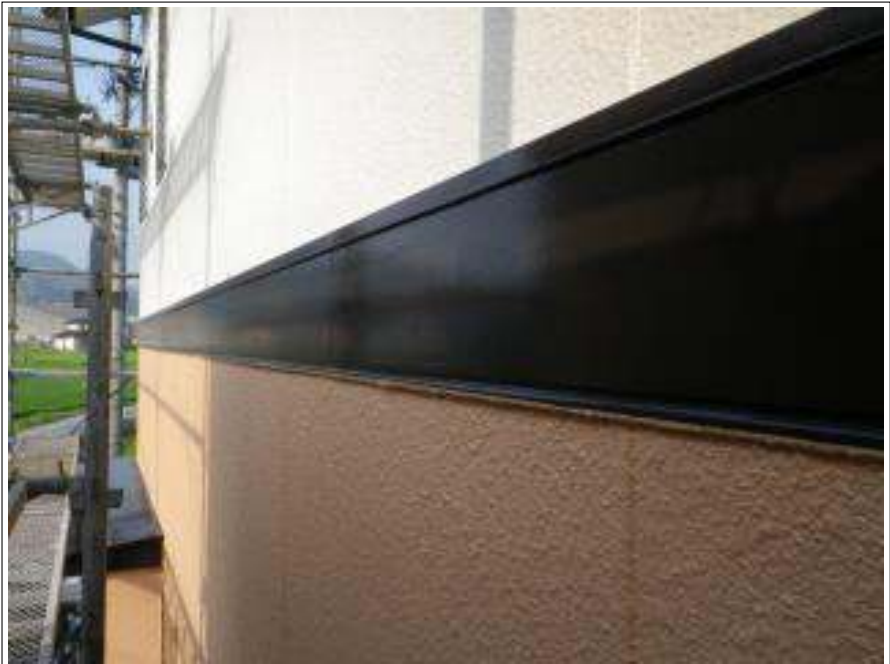
洞差し塗装施工完了