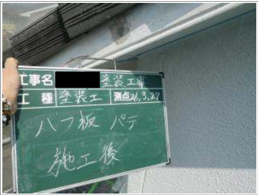
破風板パテ施工完了