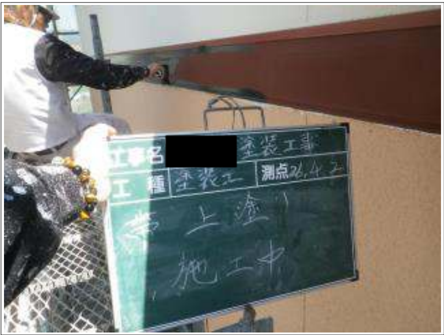
洞差し塗装上塗り施工中