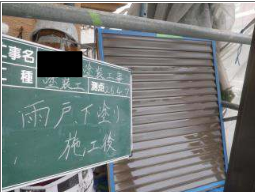
雨戸塗装下塗り施工完了