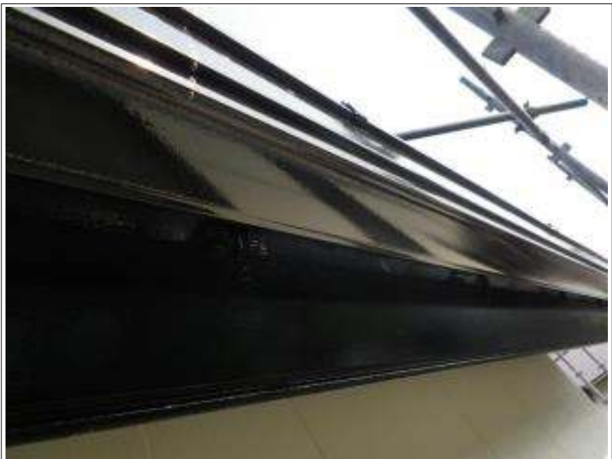
破風板・樋塗装施工完了