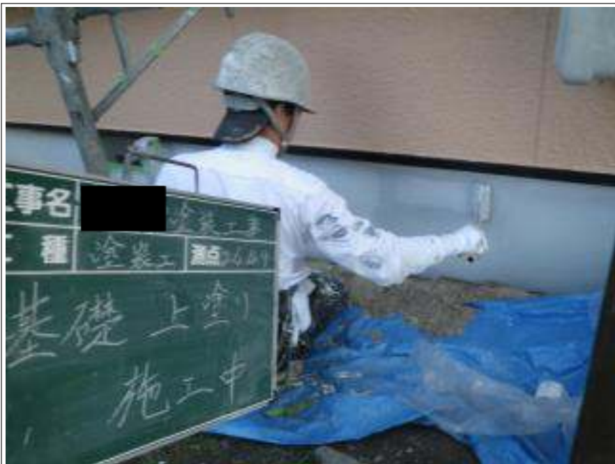
基礎塗装上塗り施工中