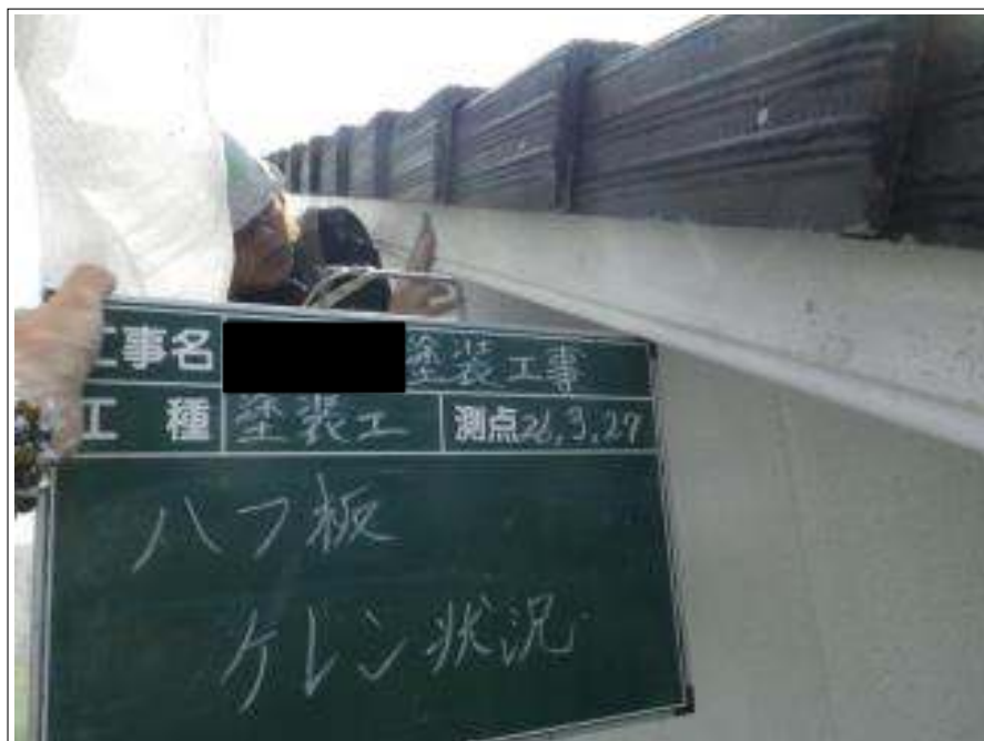
破風板ケレン施工中