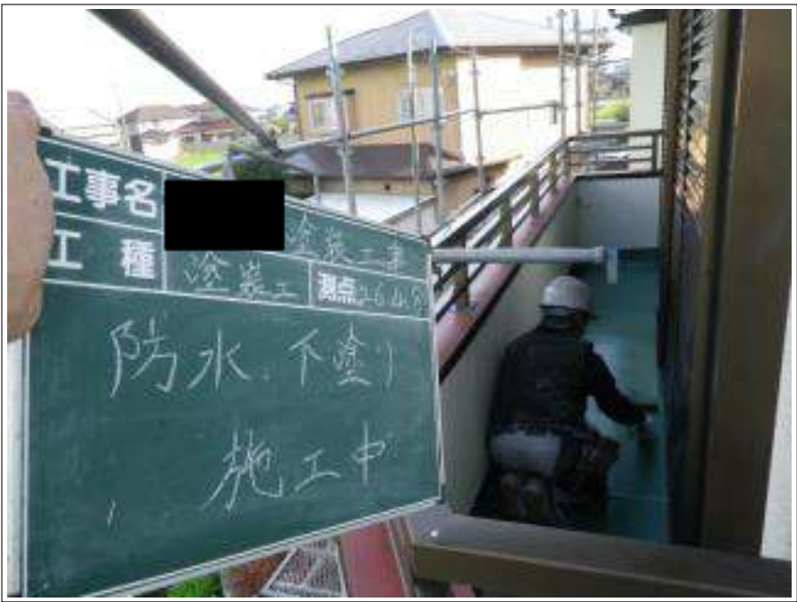
バルコニー防水塗装下塗り施工中