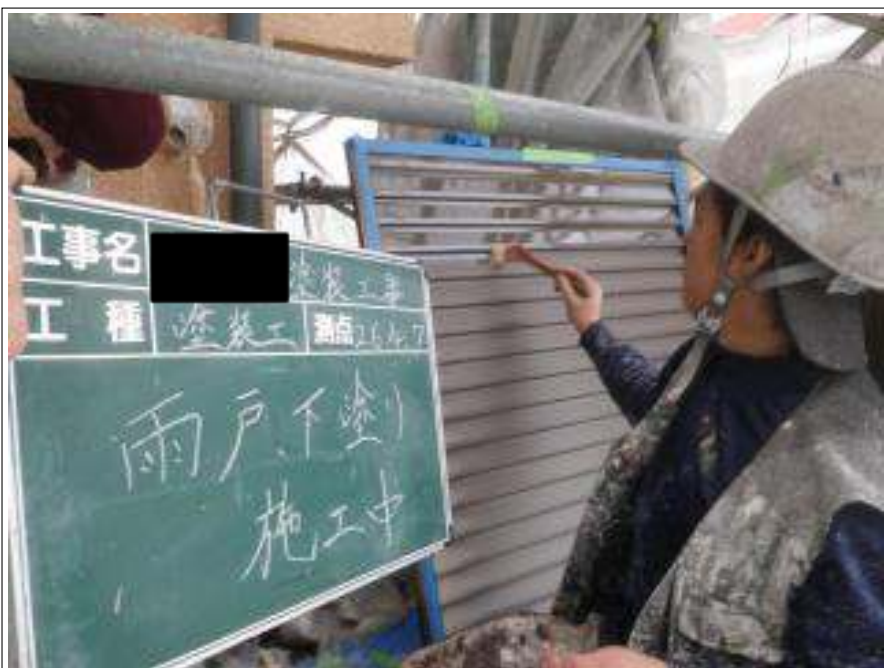
雨戸塗装下塗り施工中