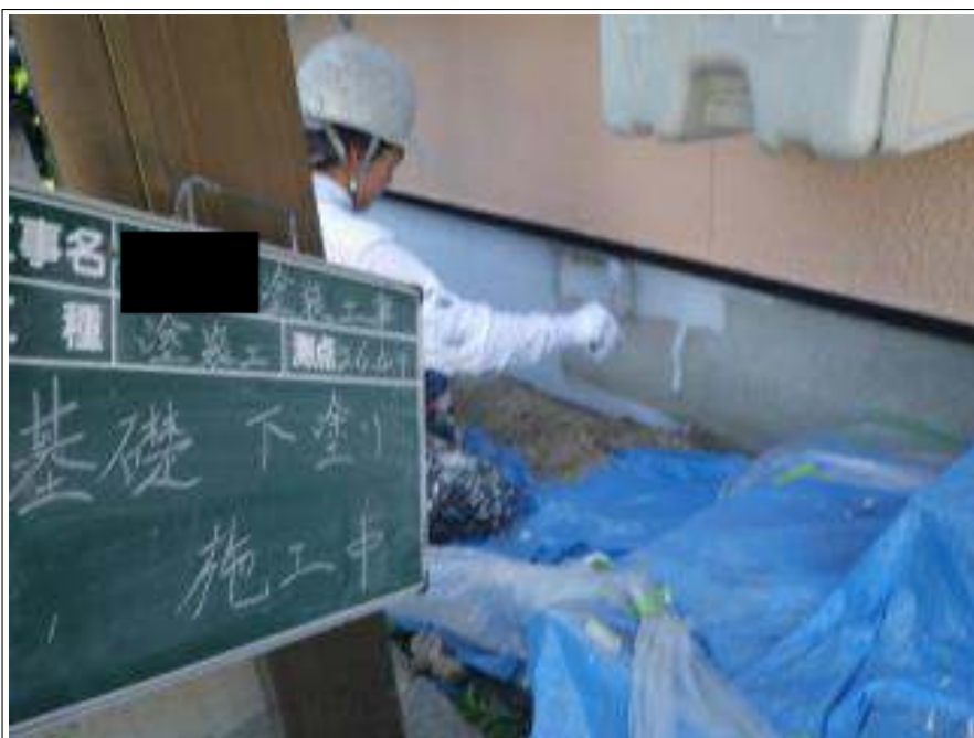
基礎塗装下塗り施工中