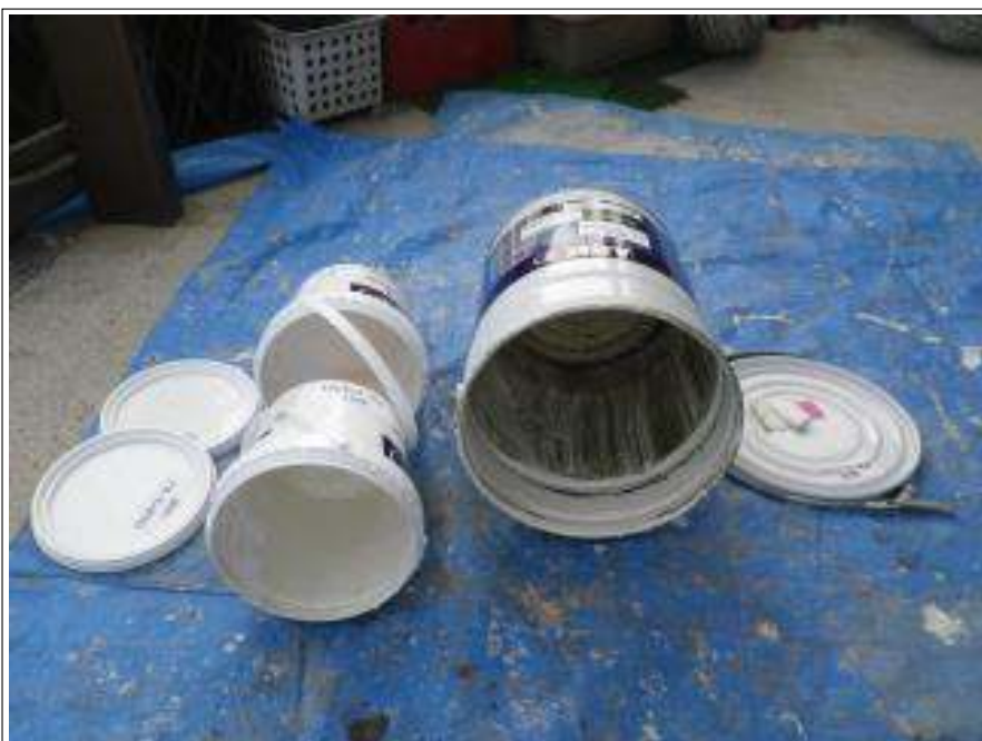
外壁上塗り使用材料空缶