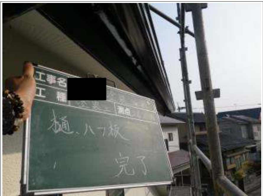
破風板・樋塗装施工完了