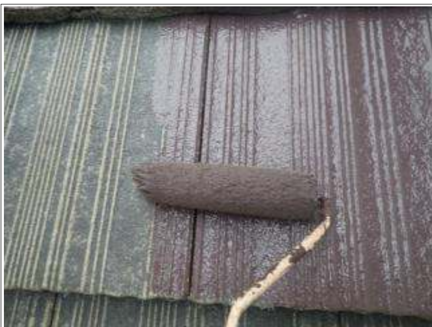
屋根塗装中塗り施工中