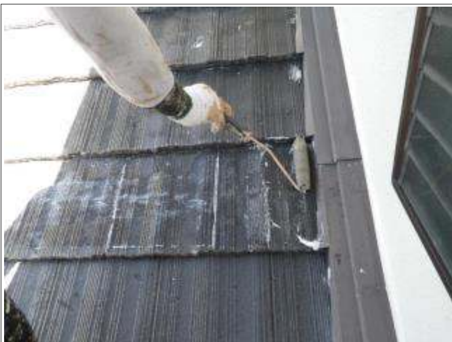
屋根塗装バリアー施工中