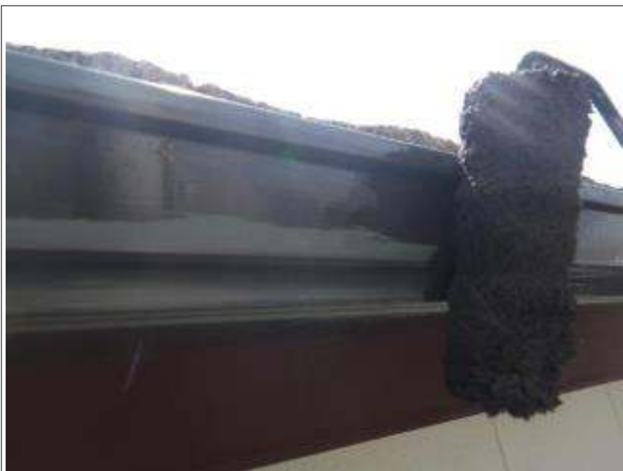
樋塗装上塗り施工中