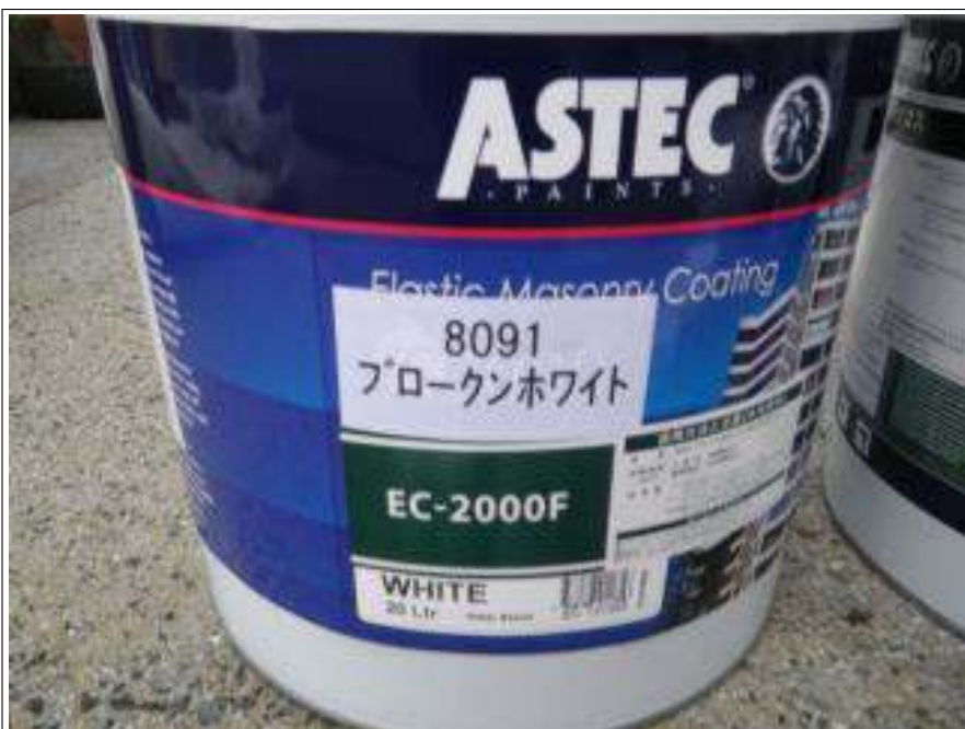
外壁上塗り使用材料