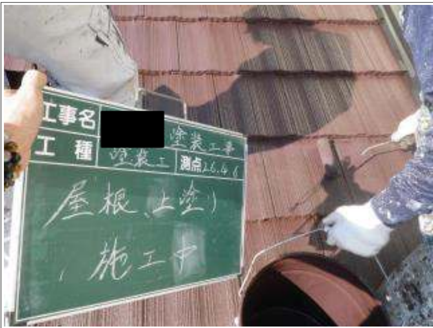
屋根塗装上塗り施工中