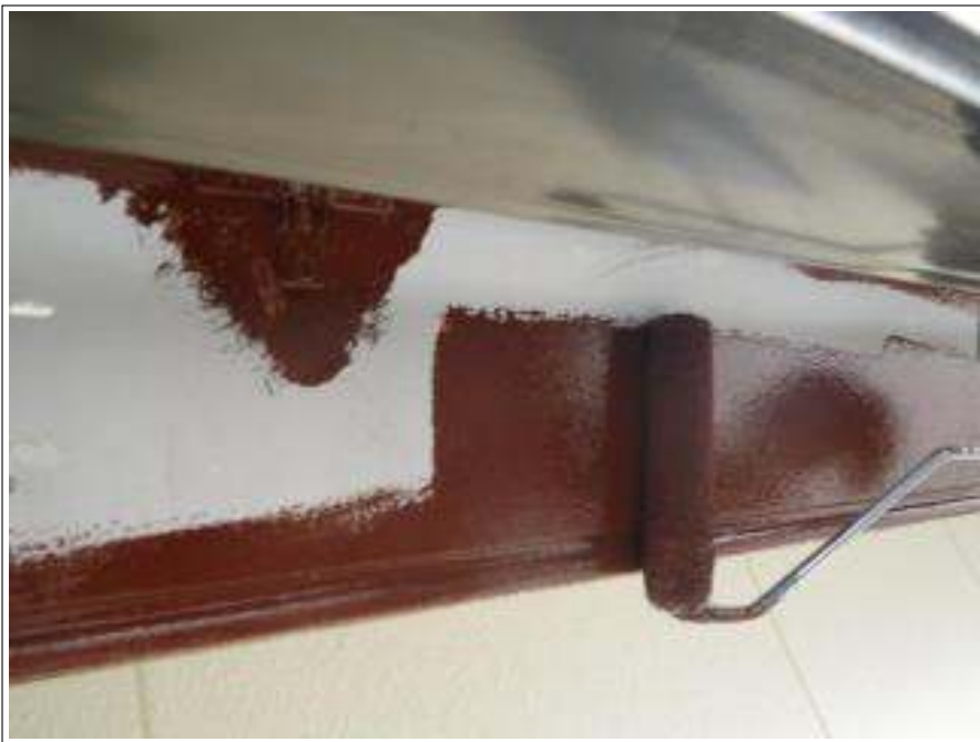
破風板塗装下塗り施工中