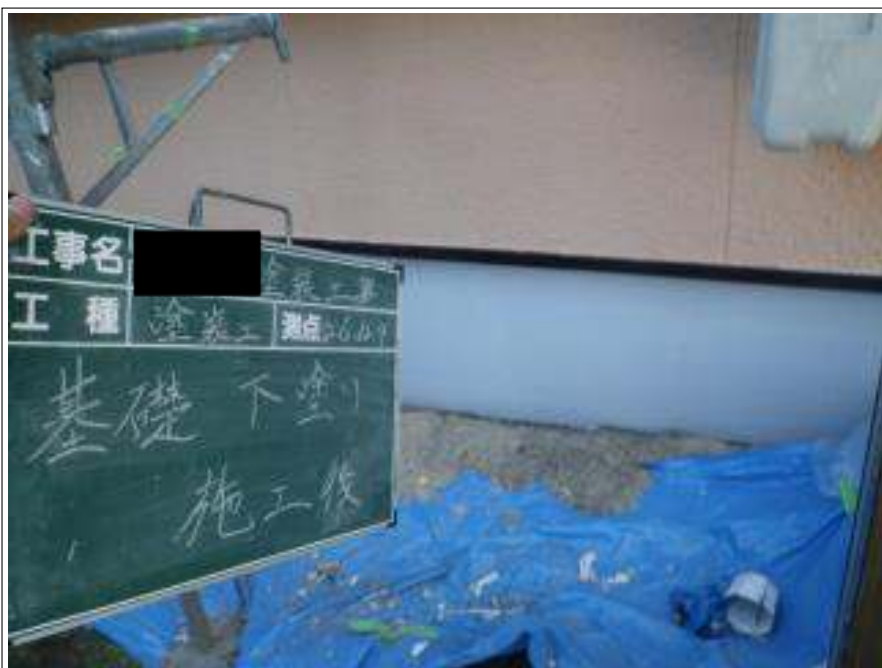
基礎塗装下塗り施工完了