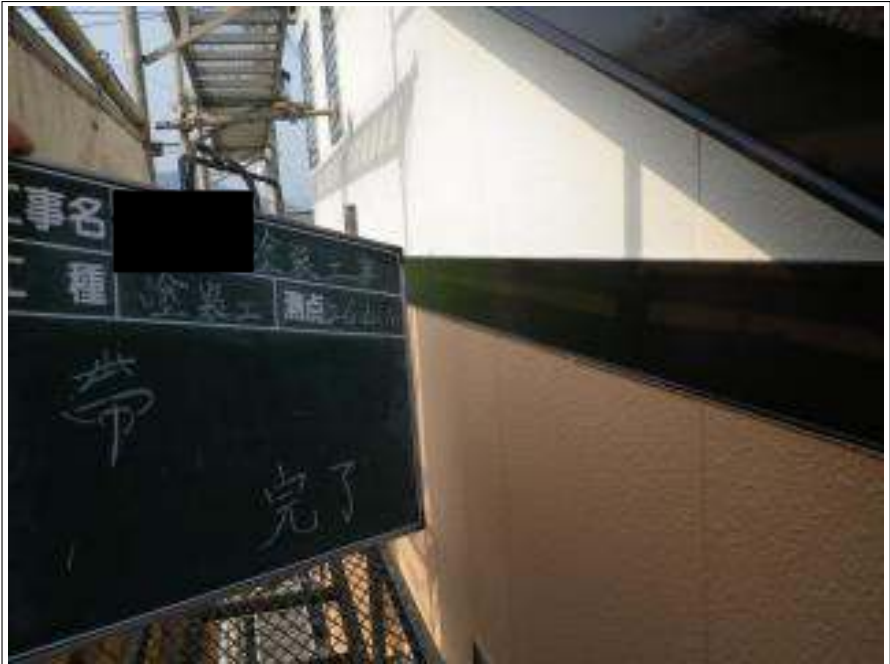
洞差し塗装施工完了