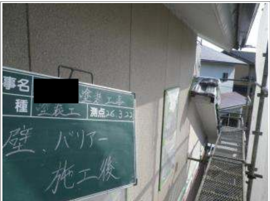
外壁塗装バリアー施工完了