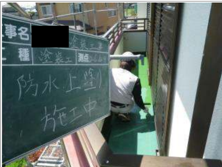
バルコニー防水塗装上塗り施工中