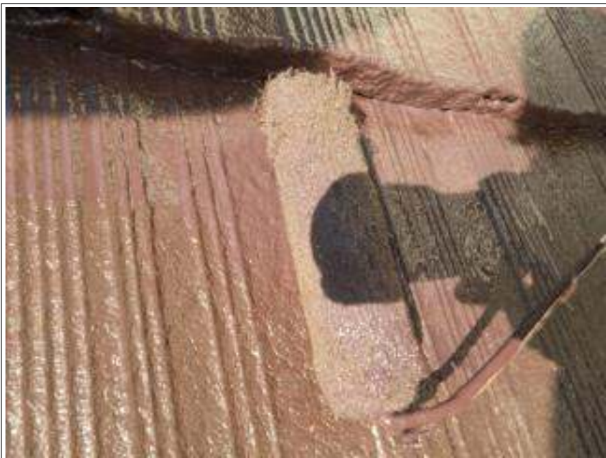
屋根塗装上塗り施工中