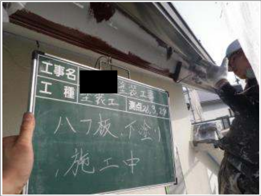
破風板塗装下塗り施工中