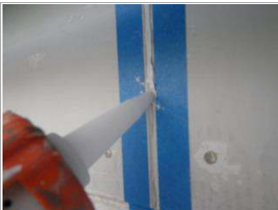
破風板シーリング補修施工中