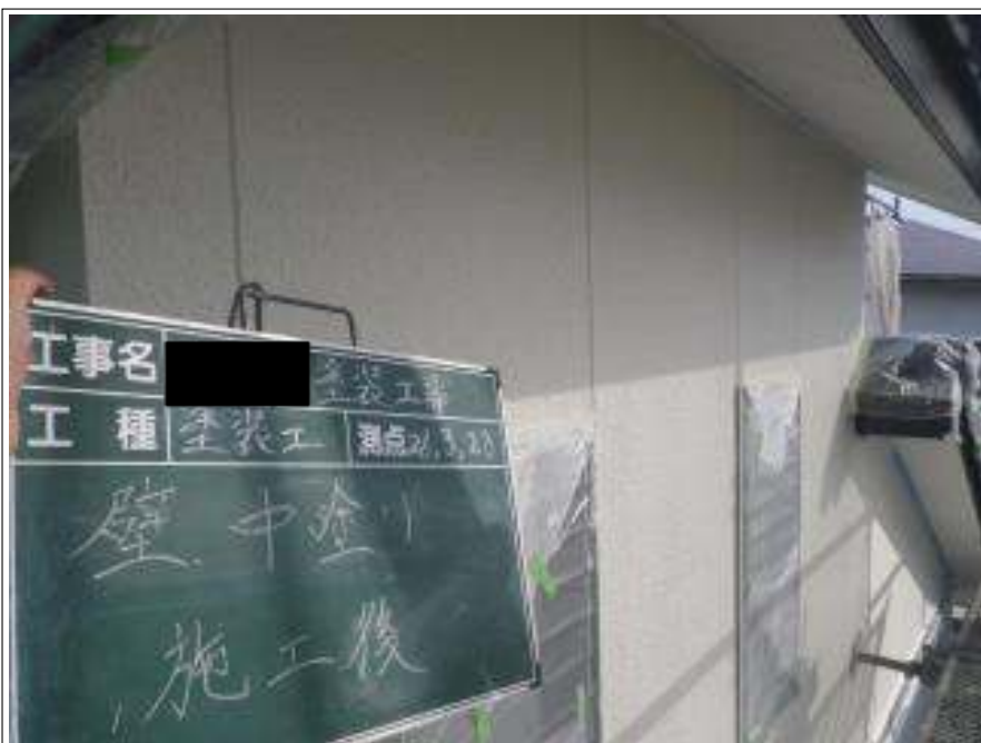
外壁塗装中塗り施工完了