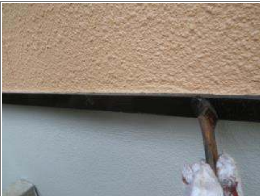
水切り塗装上塗り施工中