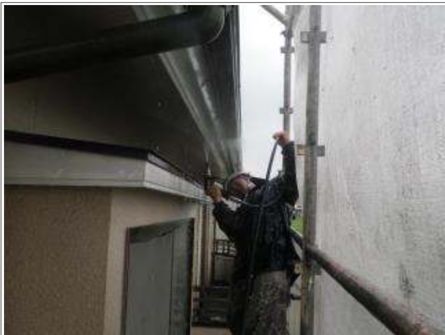
軒天高压洗净施工中