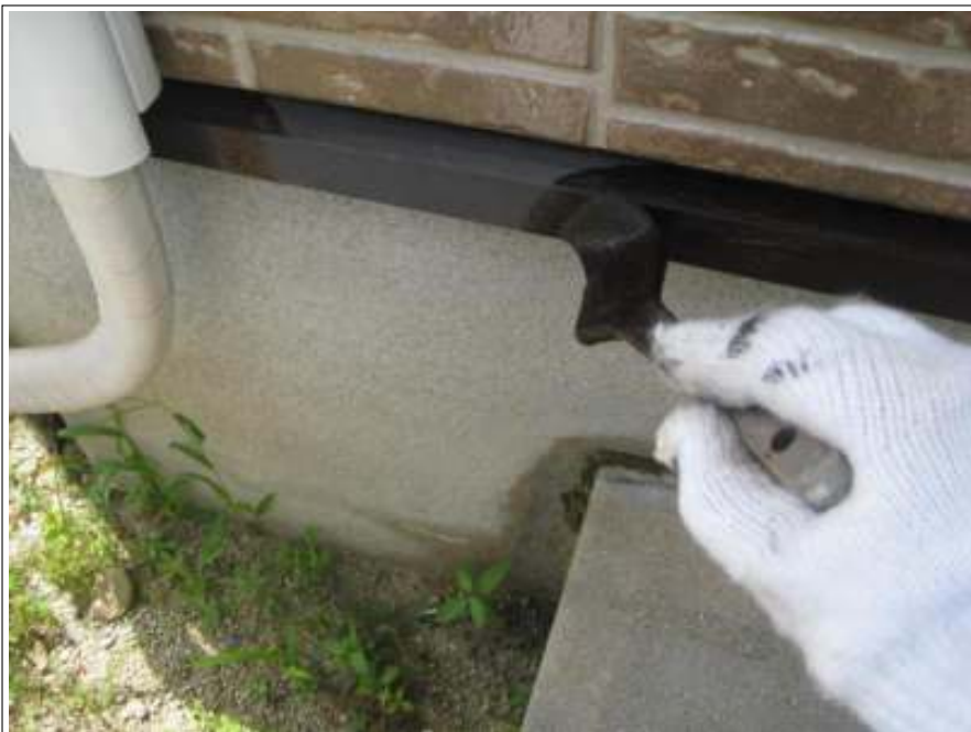
土台水切り塗装施工中