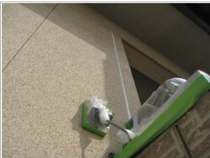
外壁クラック補修施工完了