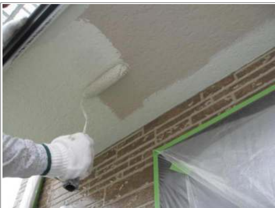
軒天塗装 2 回目施工中