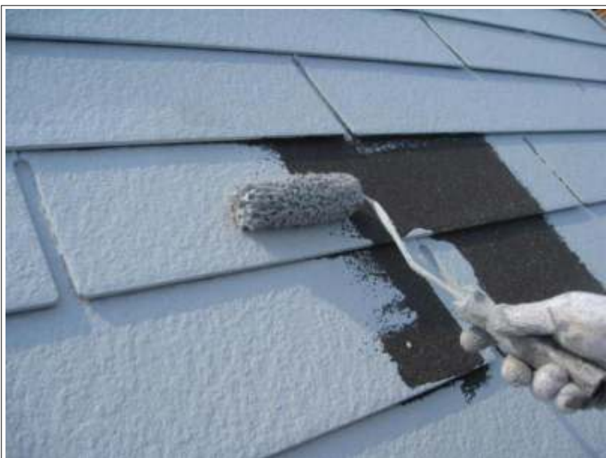
屋根塗装下塗り施工中