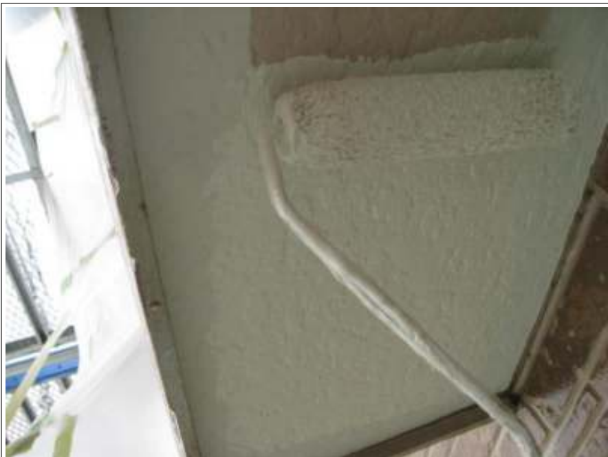
軒天塗装 1 回目施工中