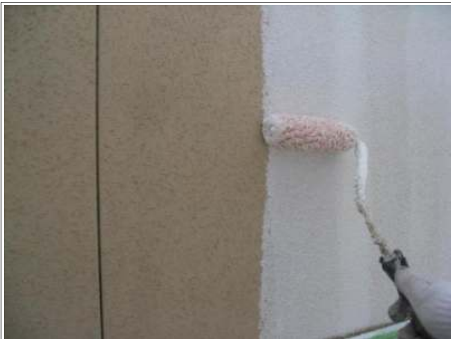
外壁塗装下塗り施工中