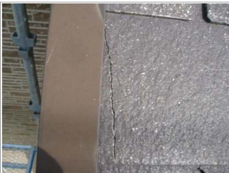
屋根クラック補修施工前