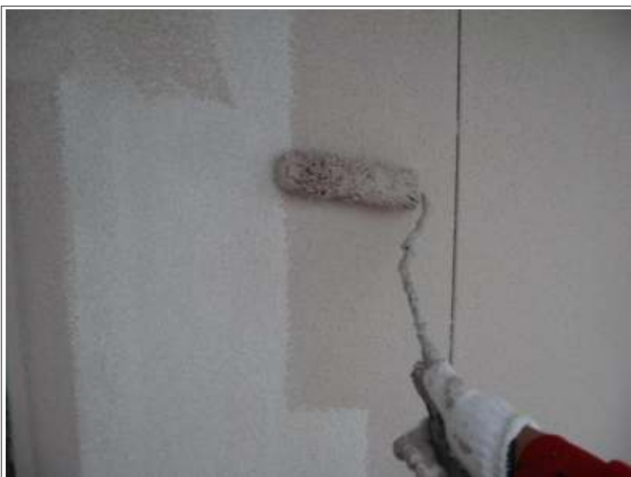
外壁塗装中塗り施工中