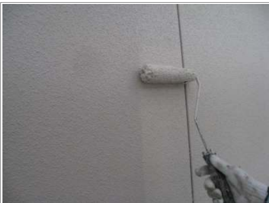
外壁塗装上塗り施工中