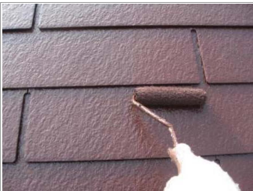
屋根塗装上塗り施工中