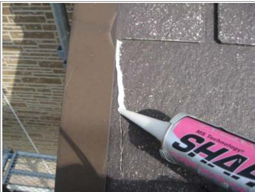
屋根クラック補修施工中