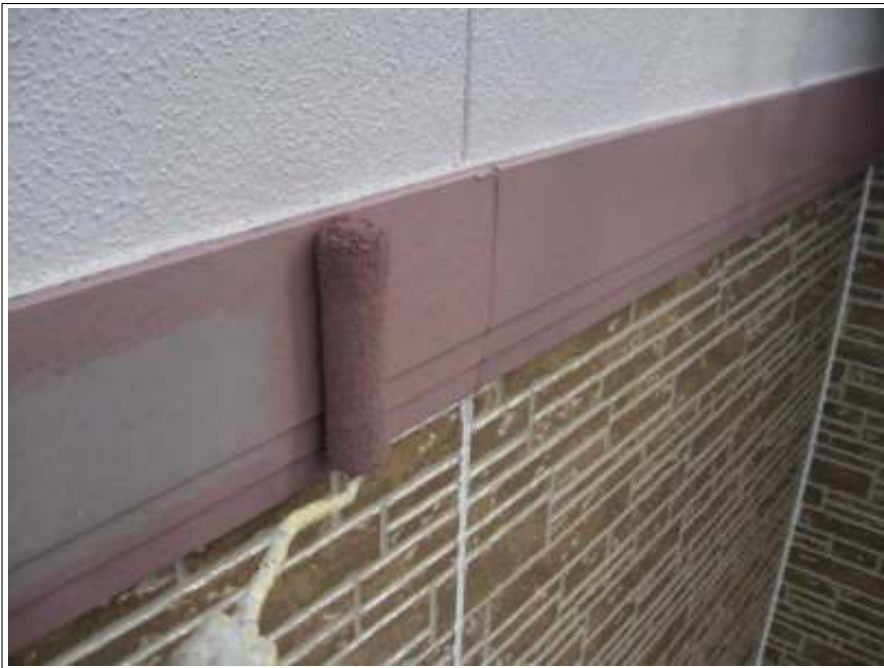
胴差し塗装 1 回目施工中