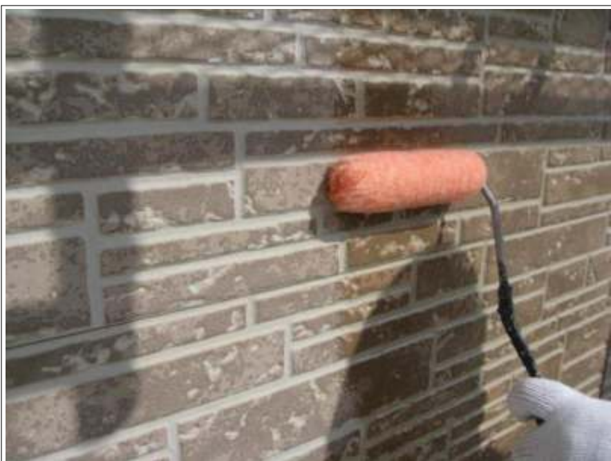
外壁塗装下塗り施工中