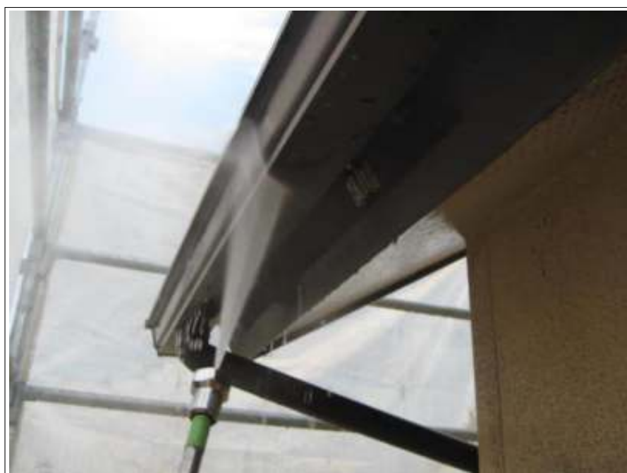
樋高压洗净施工中