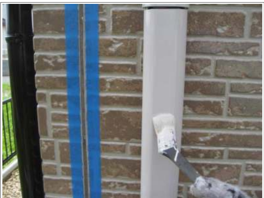
ダクトカバー塗装施工中