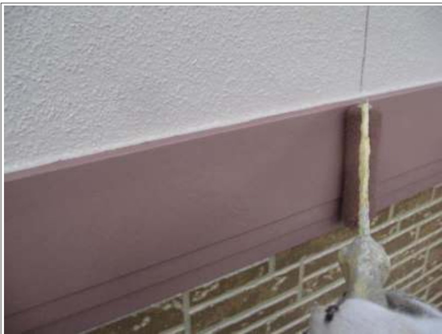
胴差し塗装 2 回目施工中