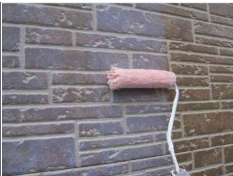
外壁塗装上塗り施工中