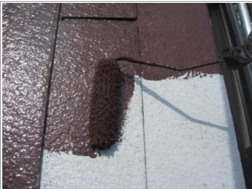
屋根塗装中塗り施工中