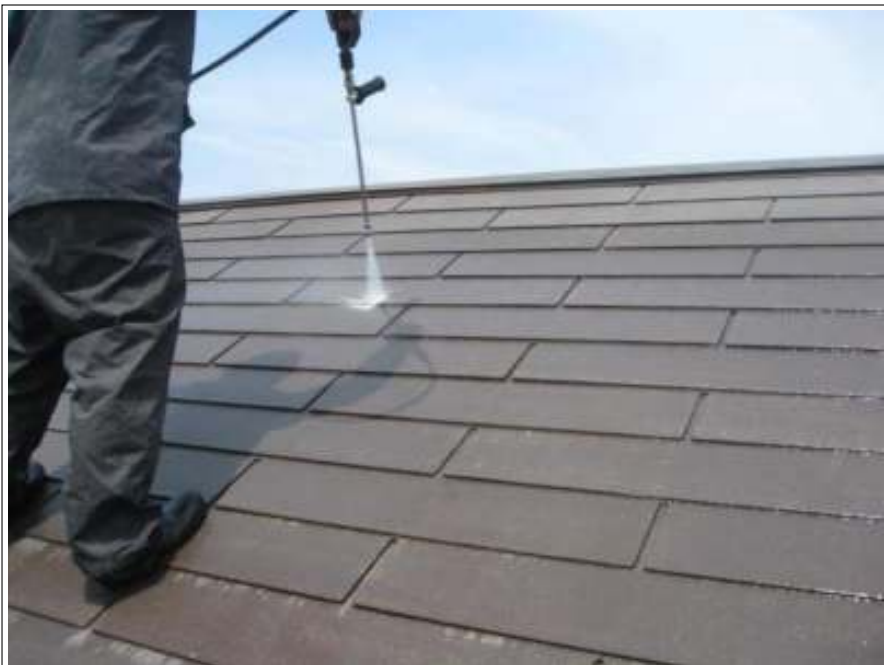
屋根高压洗净施工中