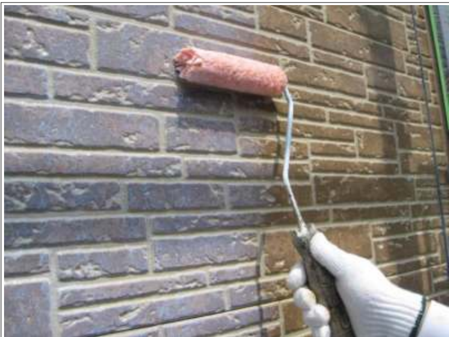
外壁塗装中塗り施工中