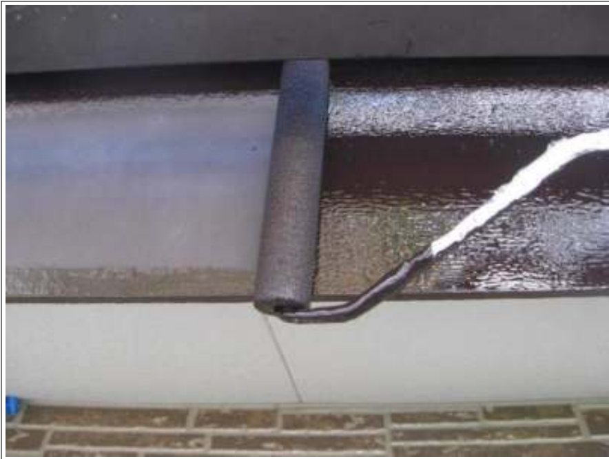
鼻かくし塗装施工中