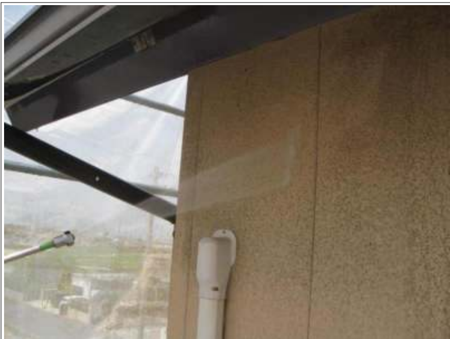
外壁高圧洗浄施工中