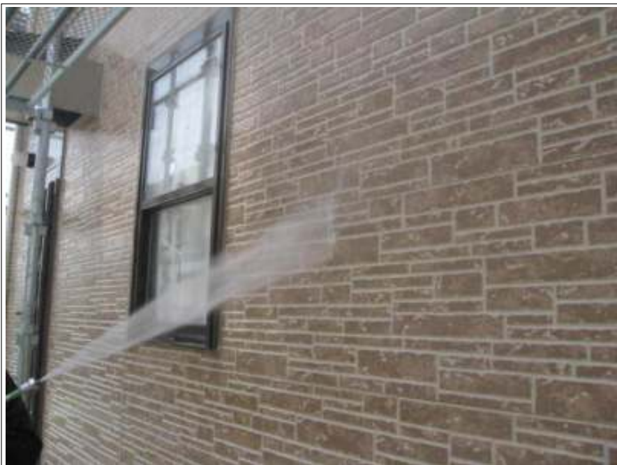
外壁高圧洗浄施工中