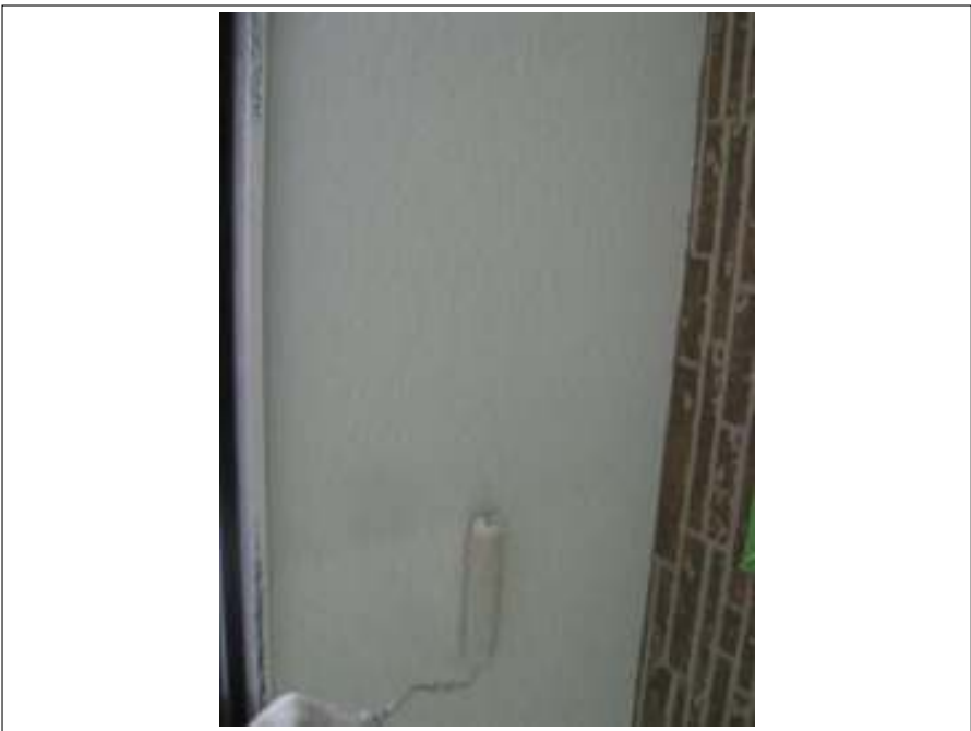
小庇軒天塗装施工中