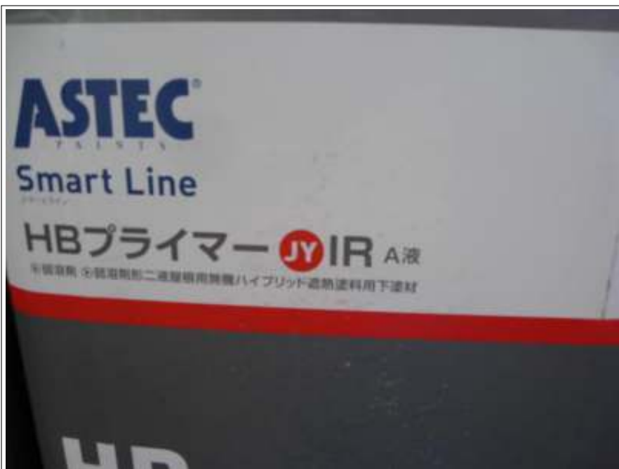
屋根下塗り使用材料