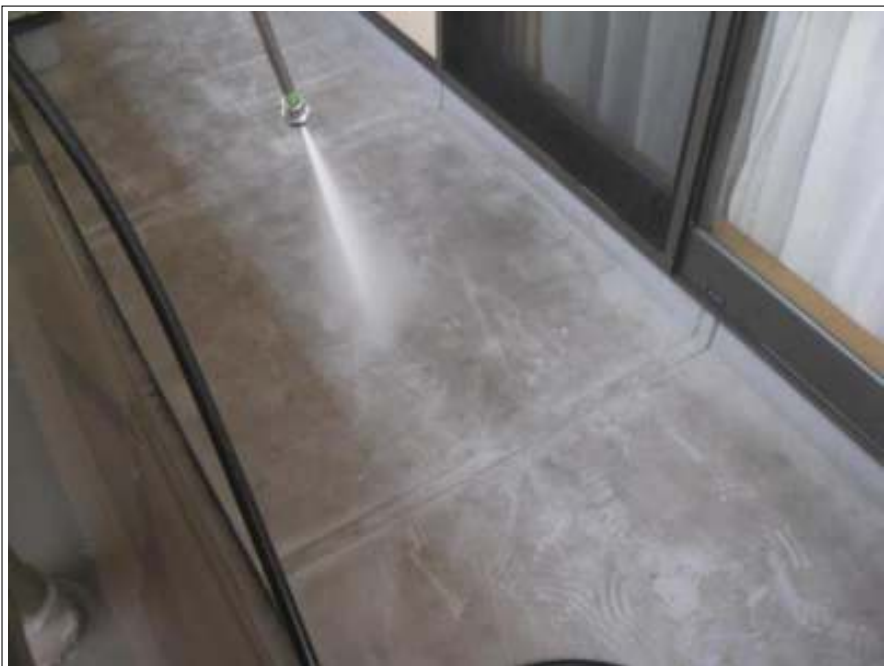
ベランダ高圧洗浄施工中