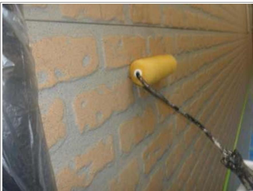
外壁バリアー施工中