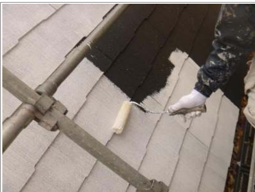
屋根塗装下塗り施工中