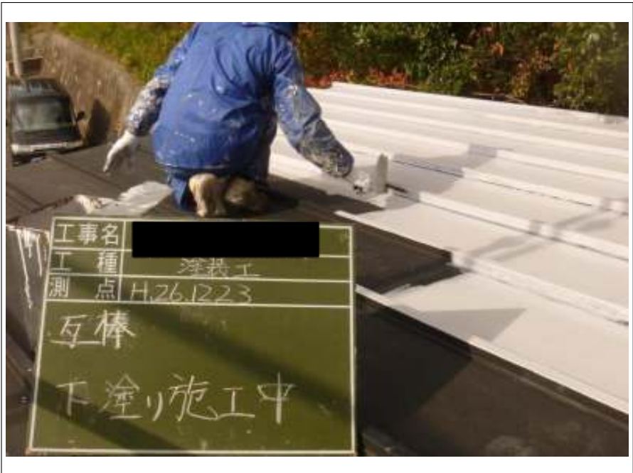
瓦棒塗装下塗り施工中