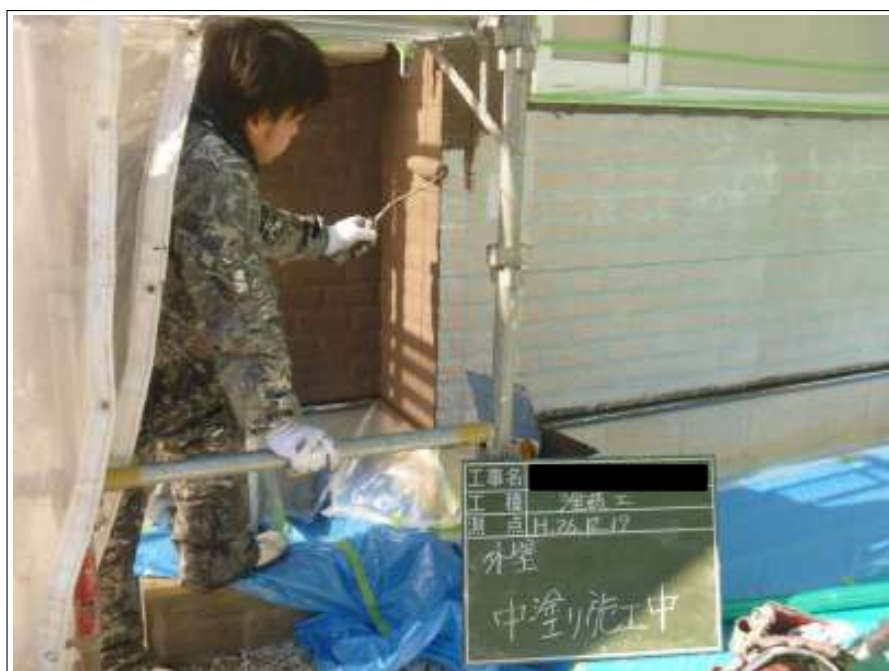
外壁塗装中塗り施工中