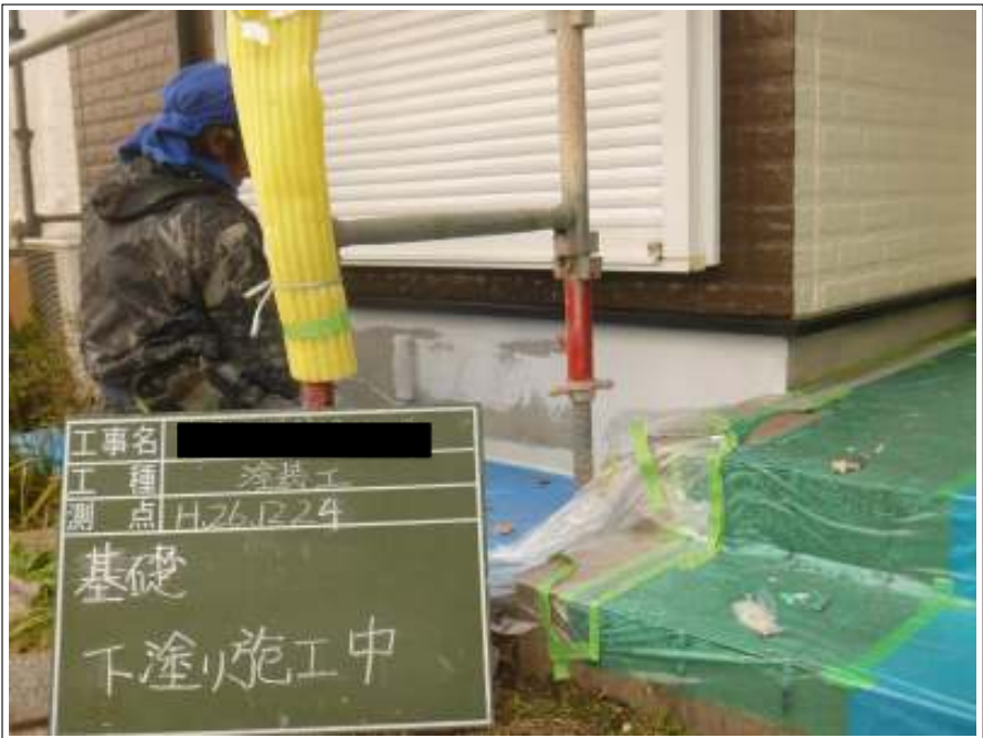
基礎塗装 1 回目施工中