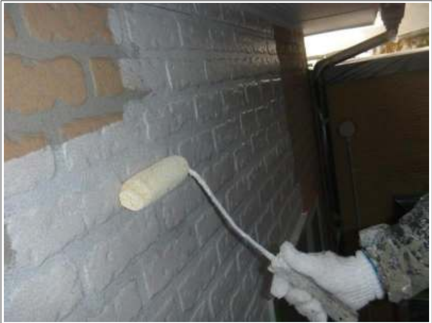
外壁塗装下塗り施工中