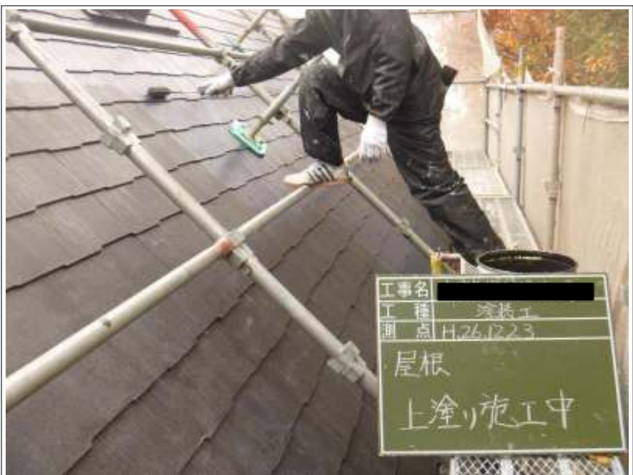
屋根塗装上塗り施工中