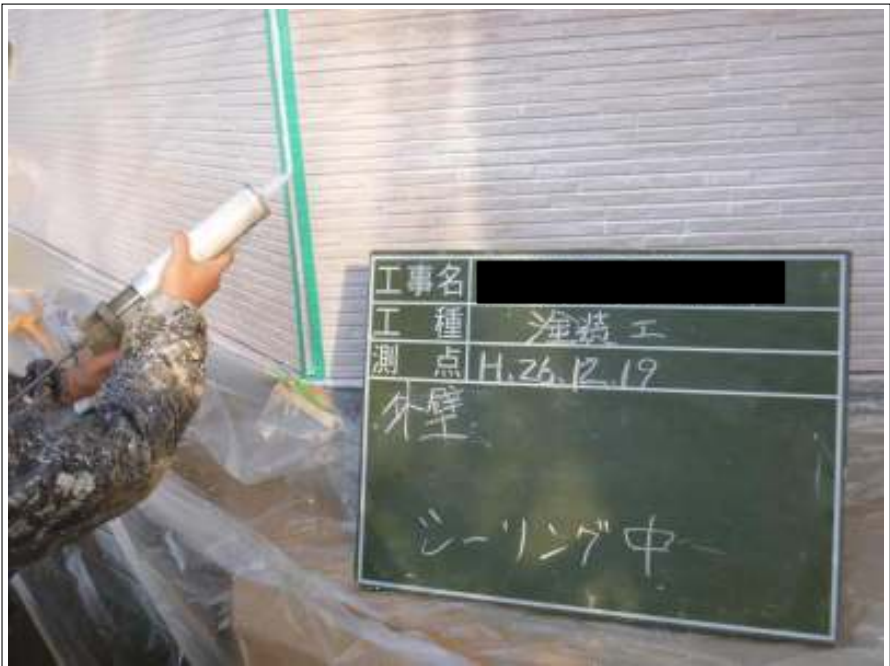
外壁シーリング補修施工中