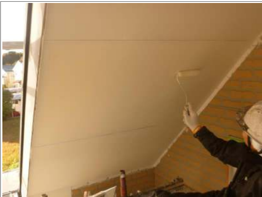
軒天塗装 1回目施工中