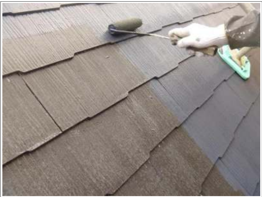
屋根塗装上塗り施工中