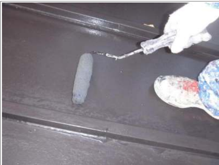
瓦棒塗装上塗り施工中