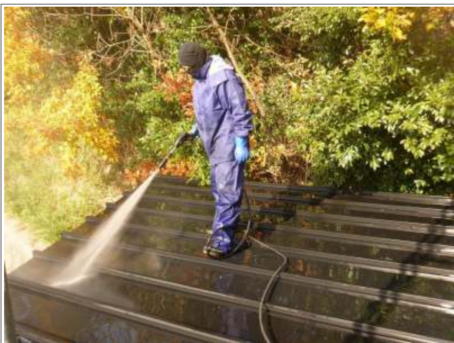
瓦棒高压洗净施工中