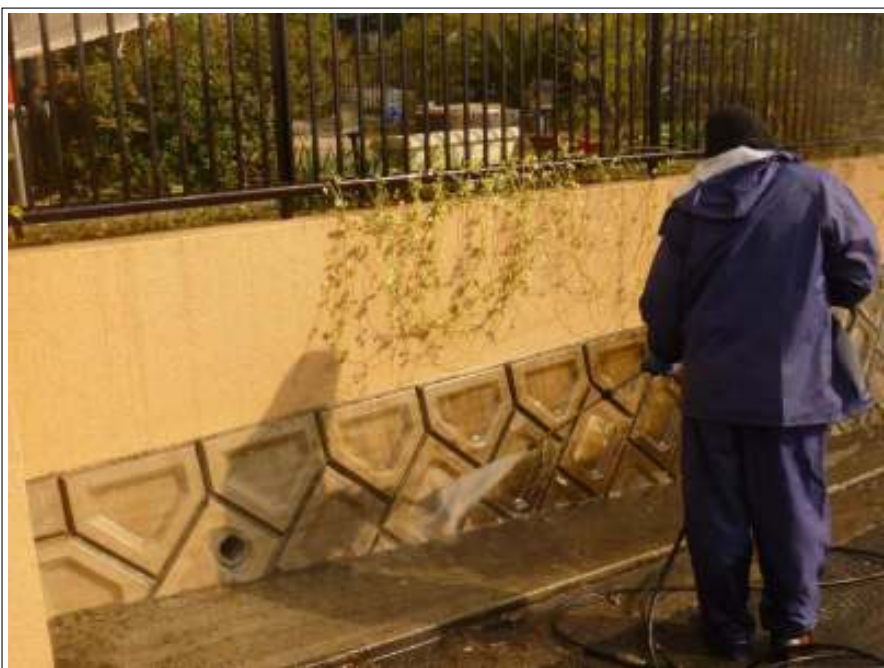
塀高圧洗淨施工中