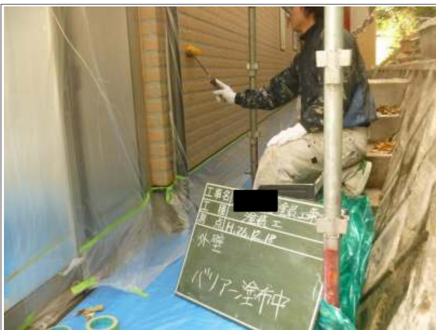
外壁バリアー施工中