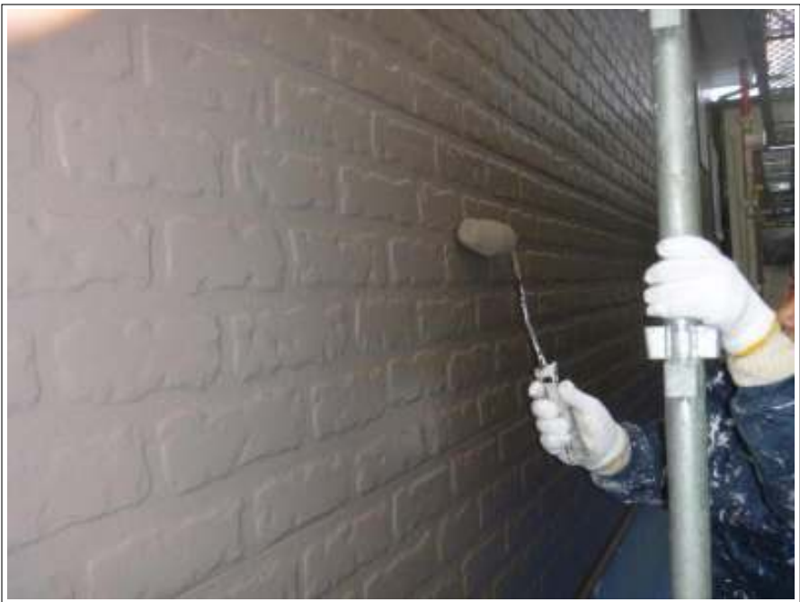
外壁塗装上塗り施工中