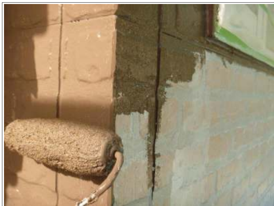
外壁塗装中塗り施工中