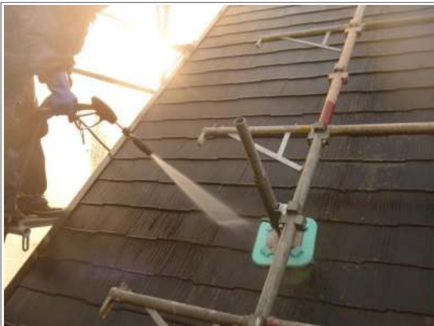
屋根高压洗净施工中