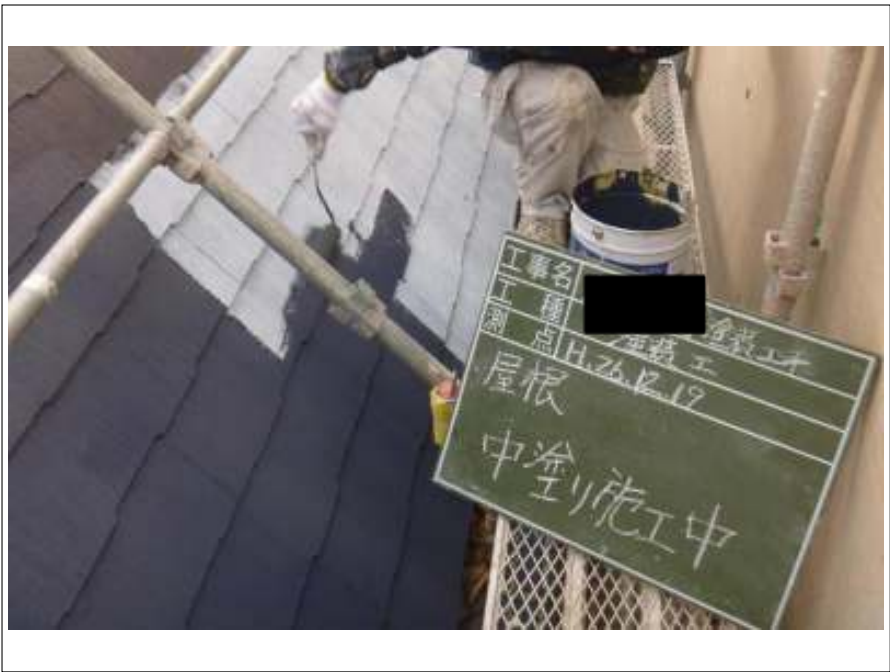
屋根塗装中塗り施工中