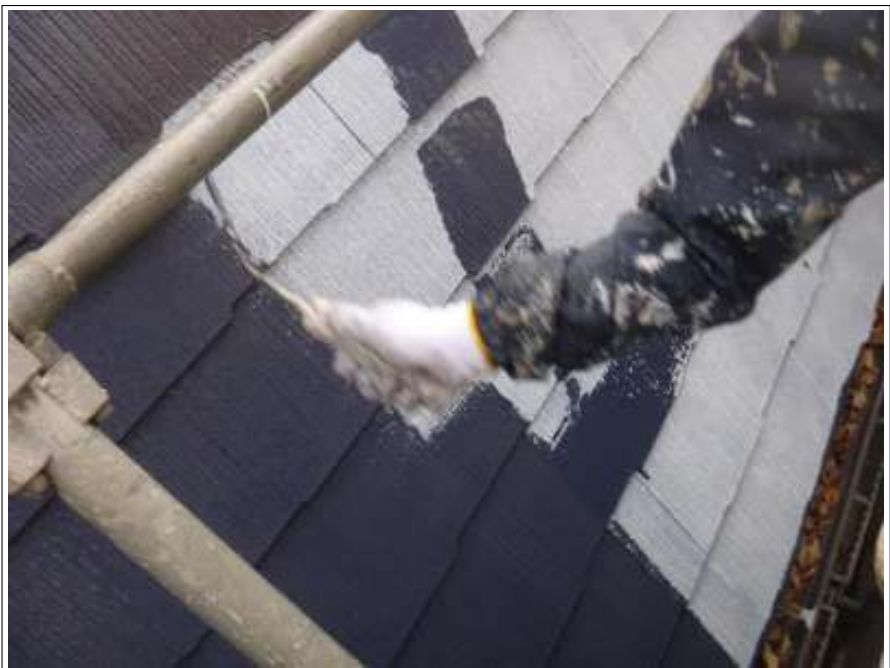
屋根塗装中塗り施工中