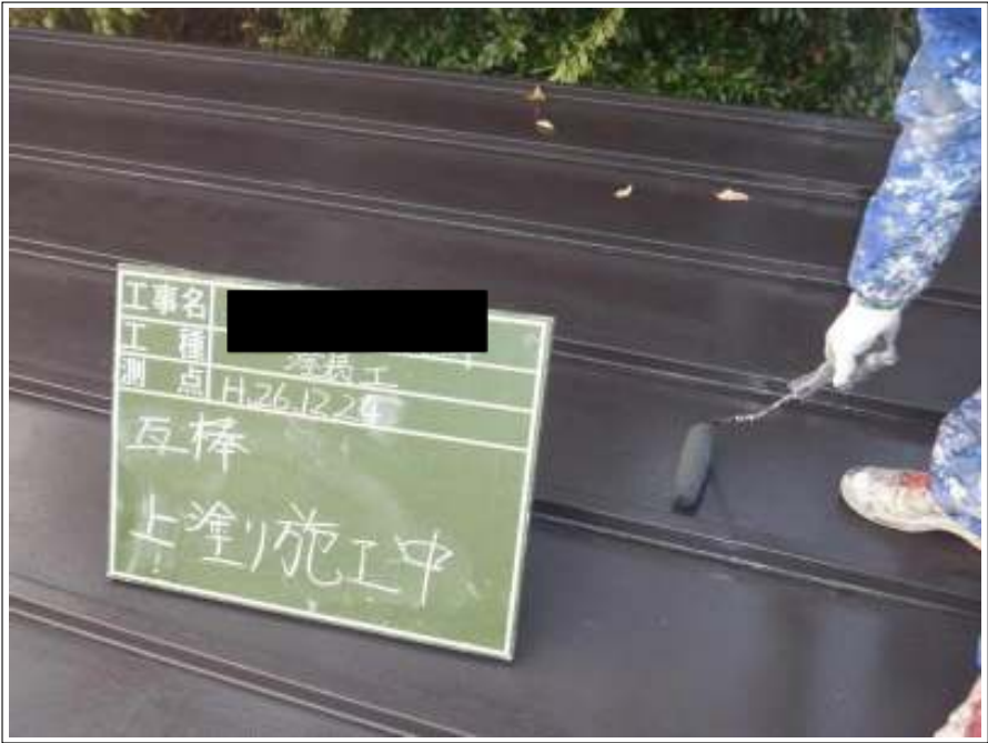
瓦棒塗装上塗り施工中