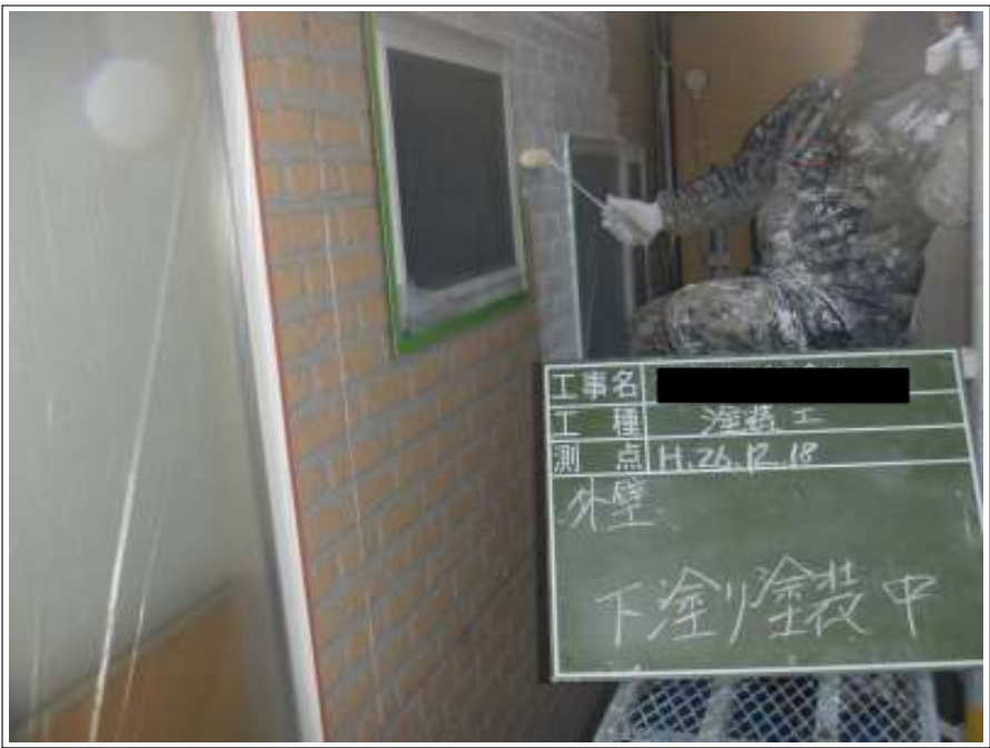
外壁塗装下塗り施工中