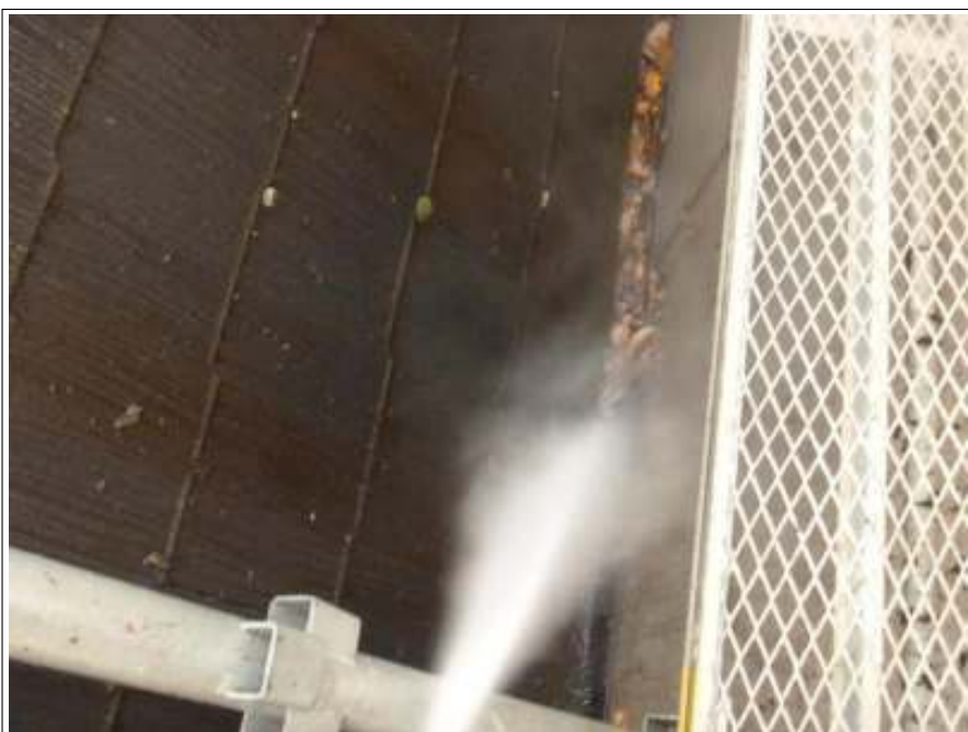
屋根高压洗净施工中