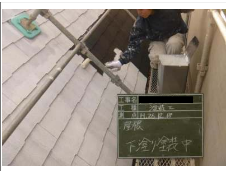
屋根塗装下塗り施工中