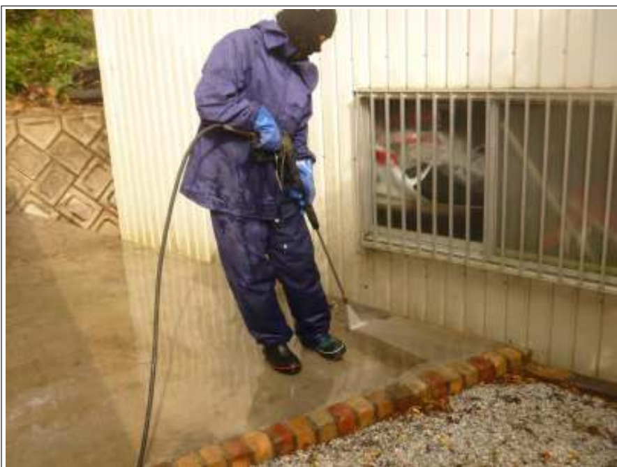
土間高圧洗淨施工中