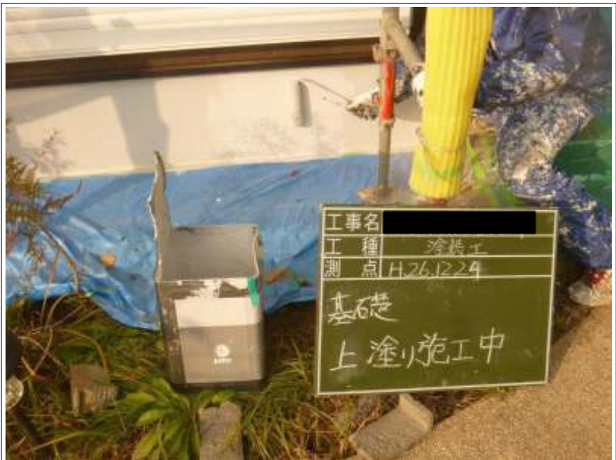
基礎塗装 2回目施工中