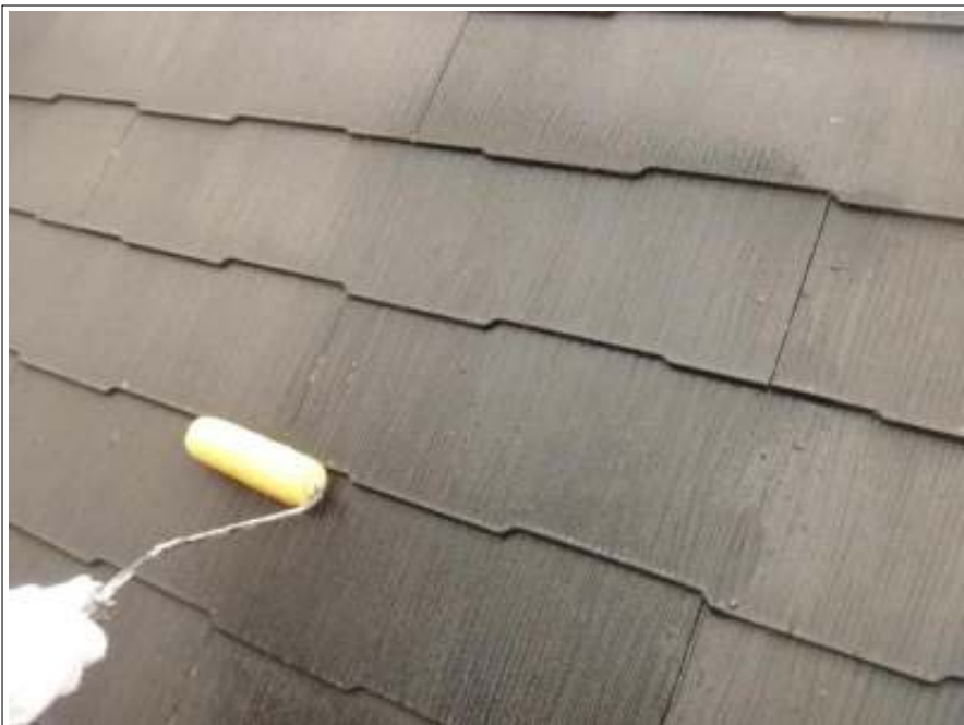
屋根バリアー施工中