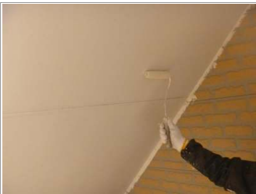
軒天塗装 2回目施工中