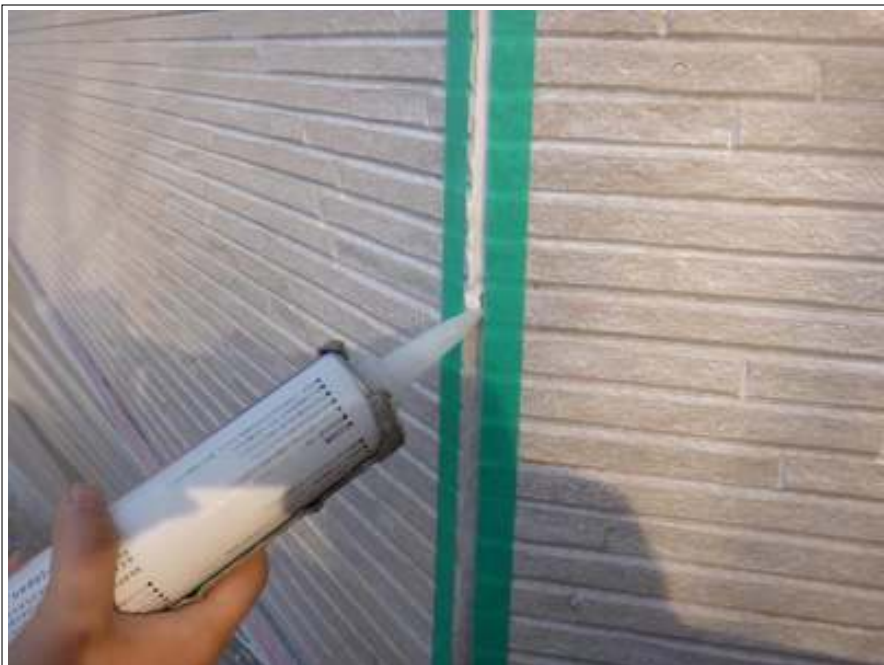
外壁シーリング補修施工中