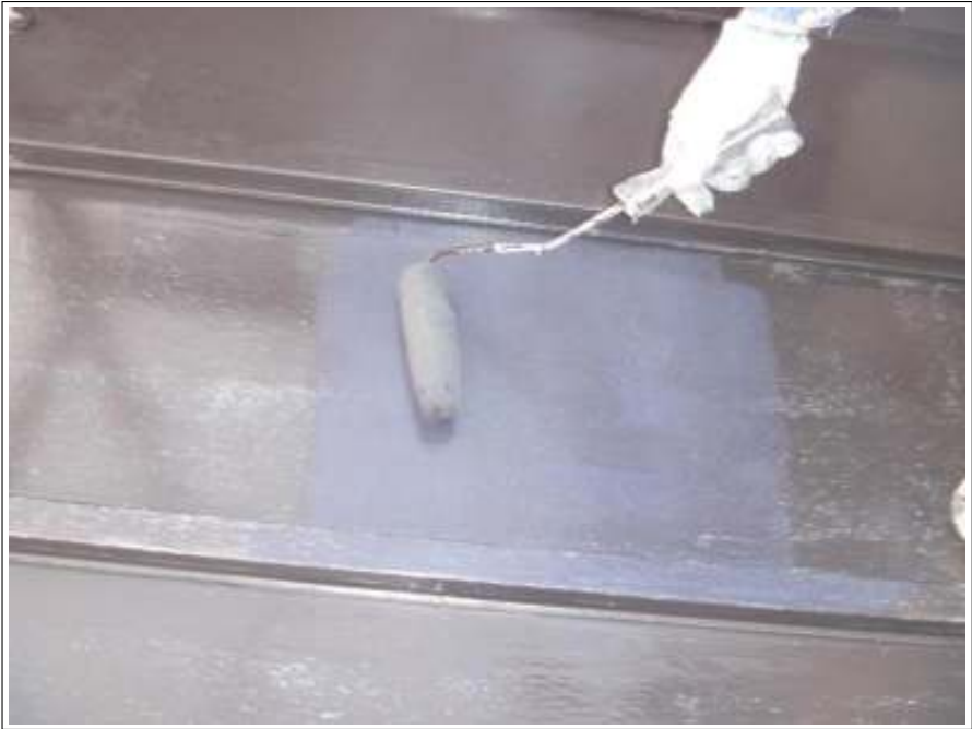
瓦棒塗装中塗り施工中