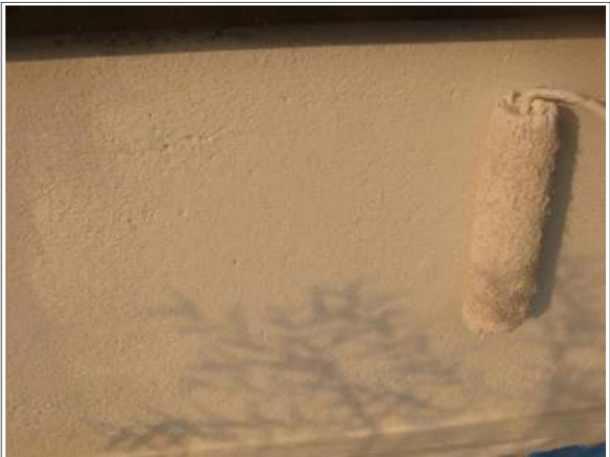
基礎塗装 2回目施工中