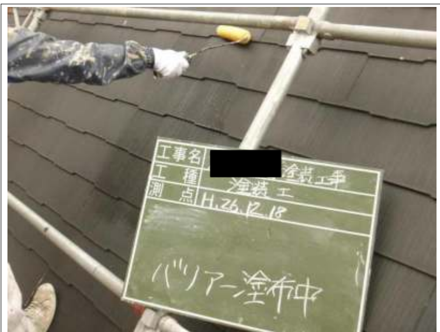
屋根バリアー施工中