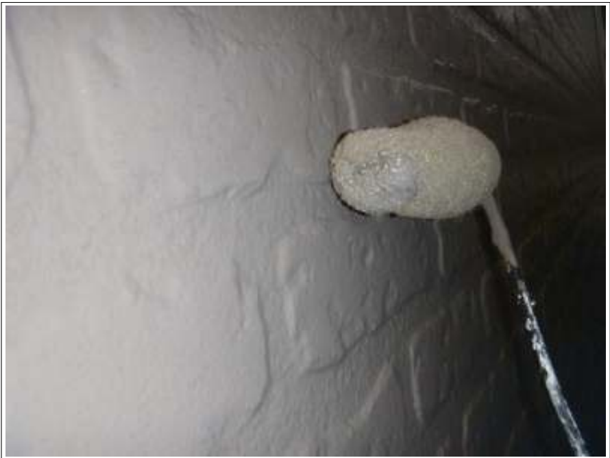
外壁塗装上塗り施工中