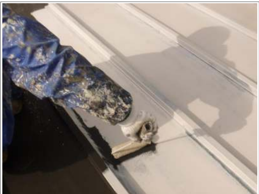
瓦棒塗装下塗り施工中