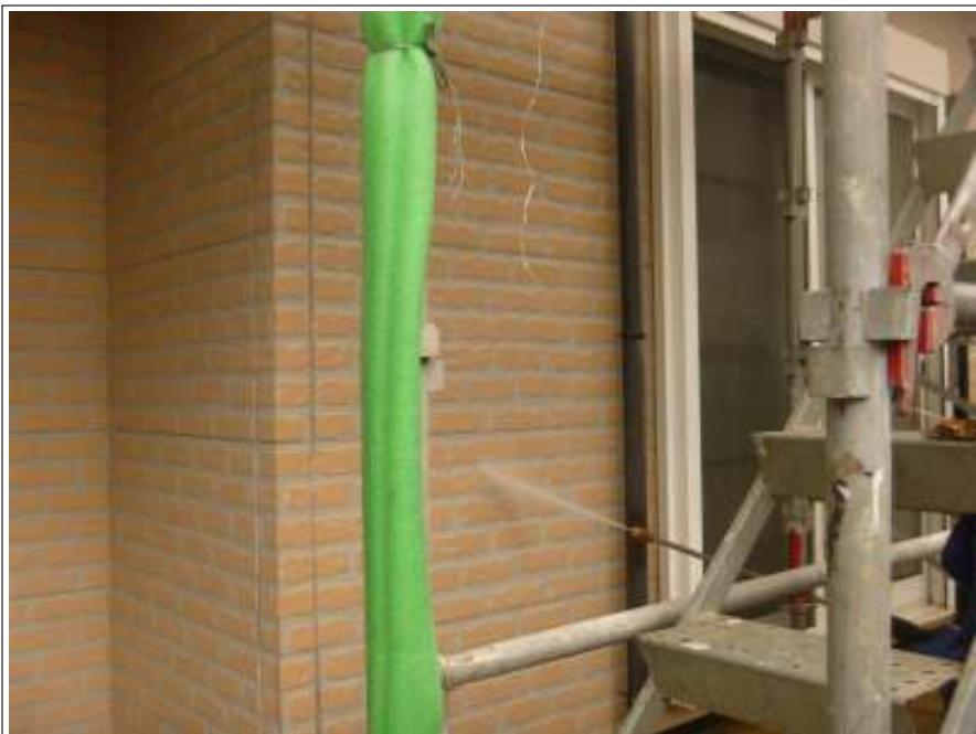
外壁高圧洗淨施工中