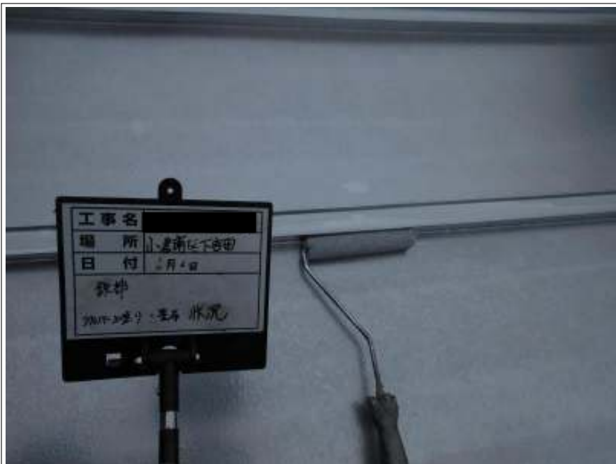
鉄部 上塗り施工中