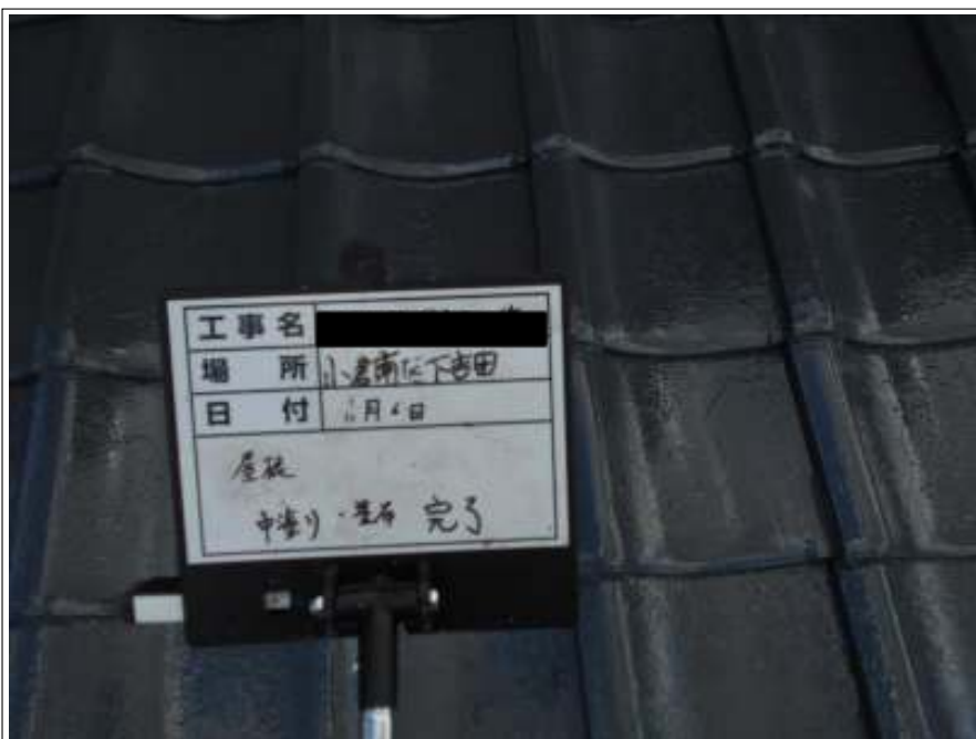
屋根 中塗り施工完了