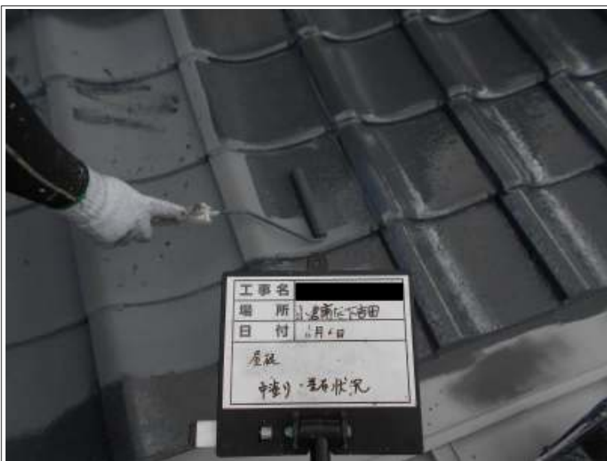
屋根 中塗り施工中