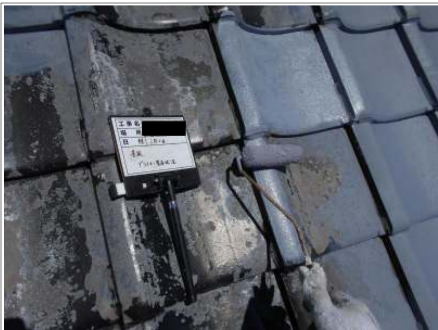
屋根 下塗り施工中