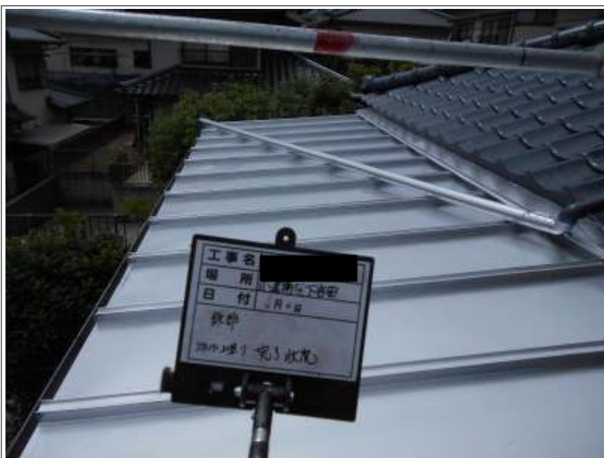
鉄部 上塗り施工完了