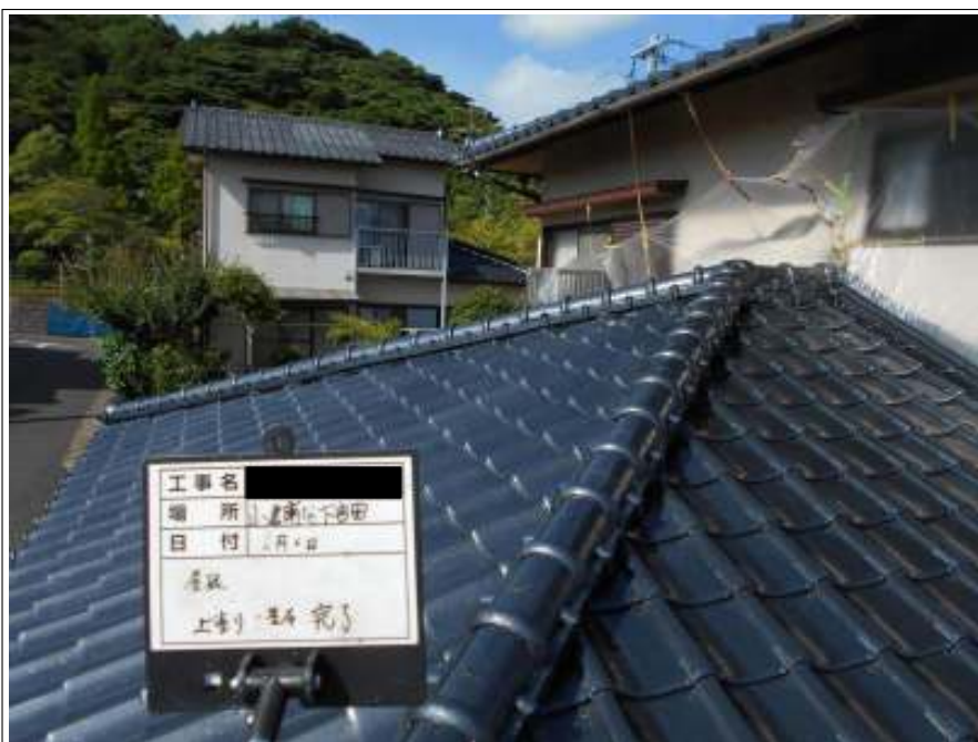
屋根 上塗り施工完了