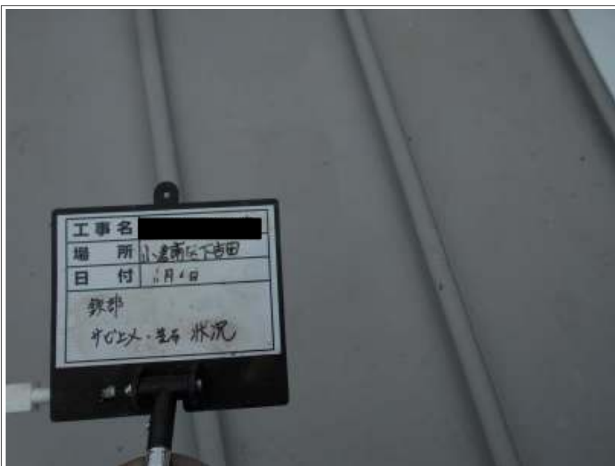
鉄部 サビ止め施工中