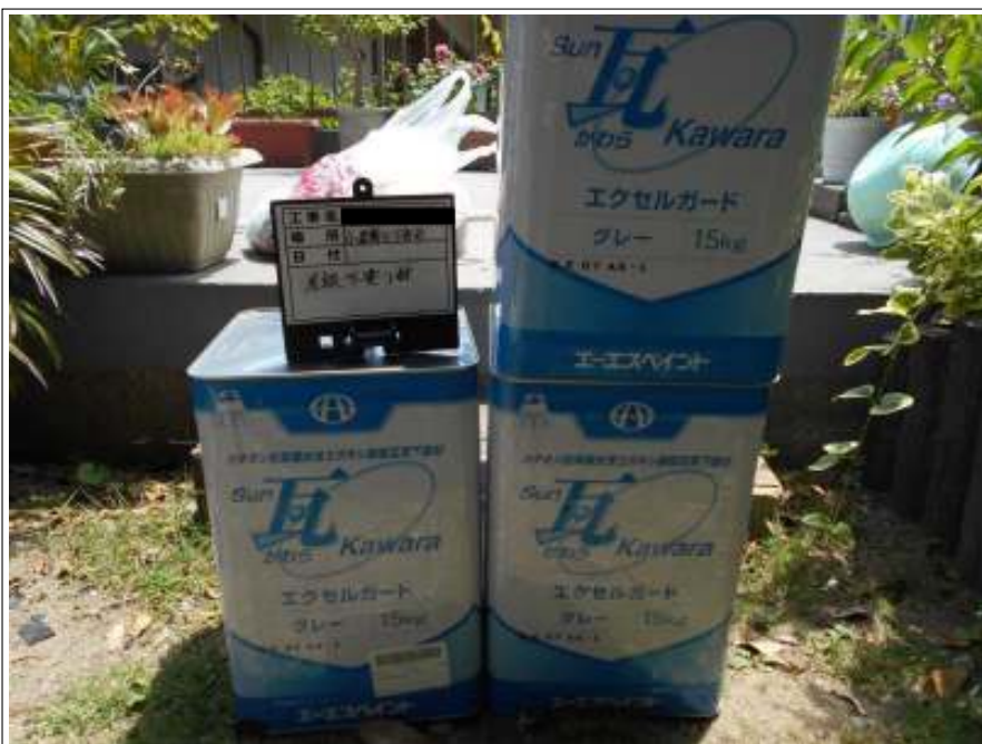
屋根 下塗り使用材料