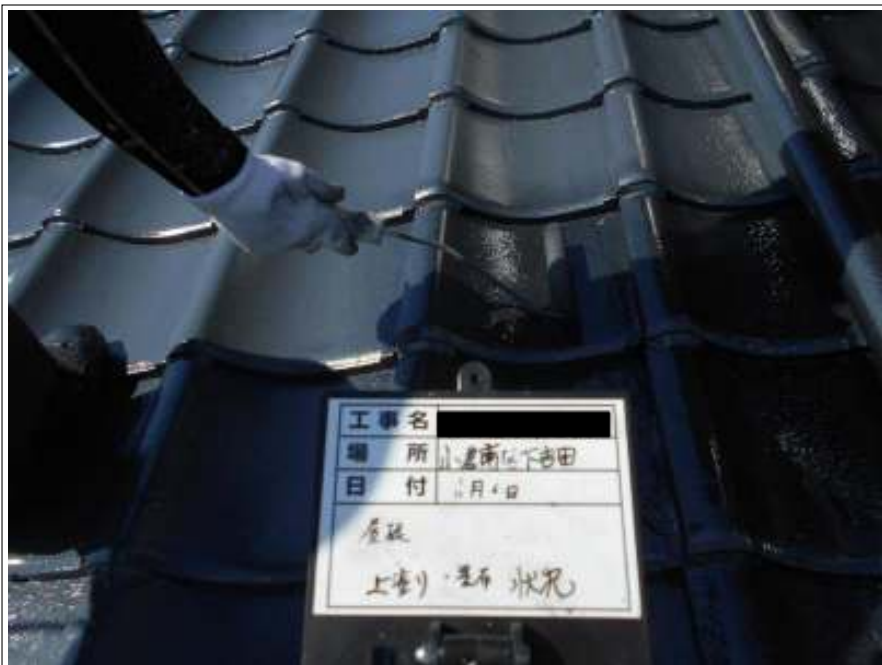
屋根 上塗り施工中