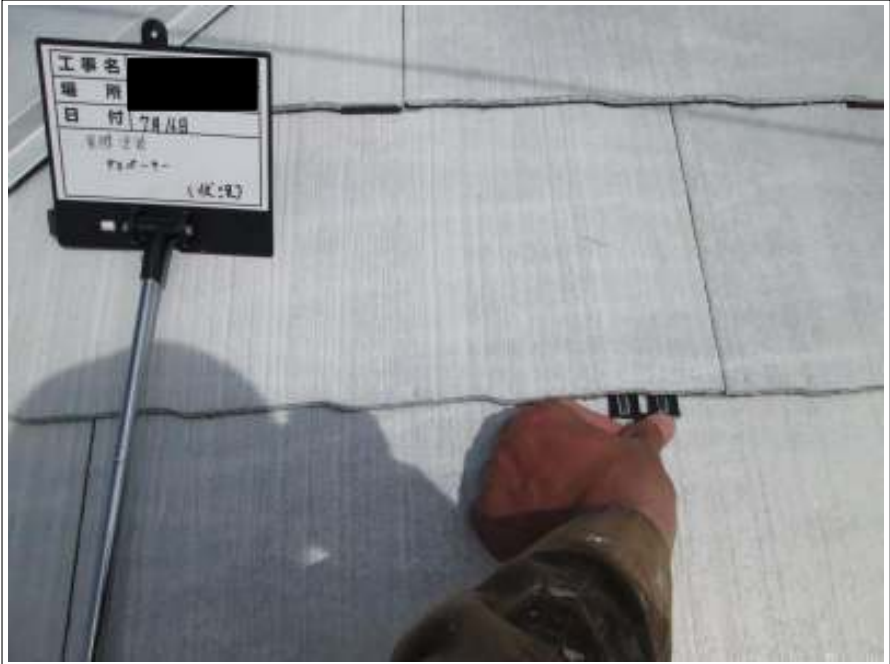
屋根 タスペーサー取付施工中