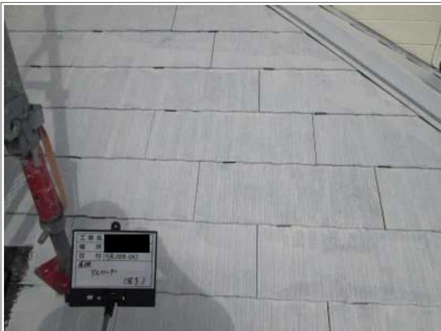
下屋根 タスペーサー取付施工完了