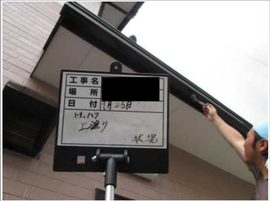
破風板 上塗り施工中