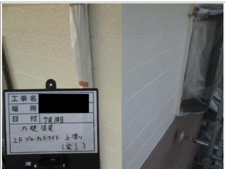
外壁 上塗り施工完了