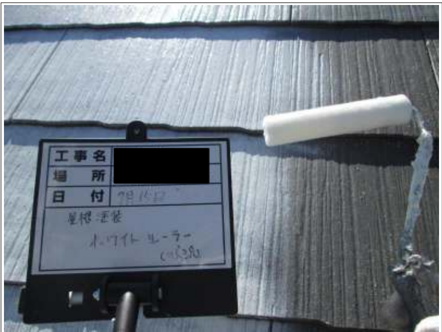
屋根 下塗り施工中