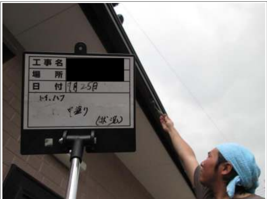
破風板 中塗り施工中