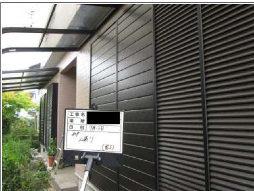
雨戸 上塗り施工完了