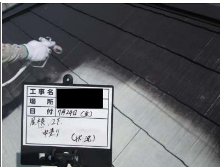
屋根 中塗り施工中