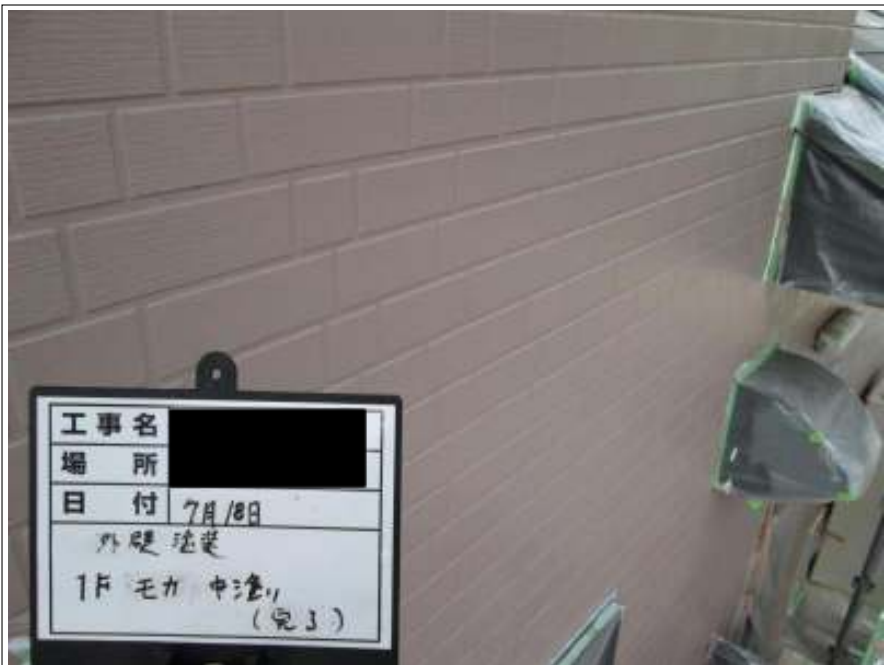
外壁 中塗り施工完了