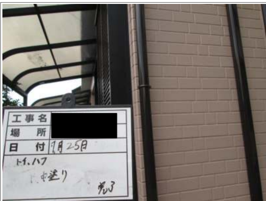
樋 中塗り施工完了