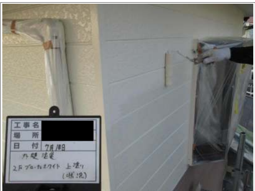
外壁 上塗り施工中