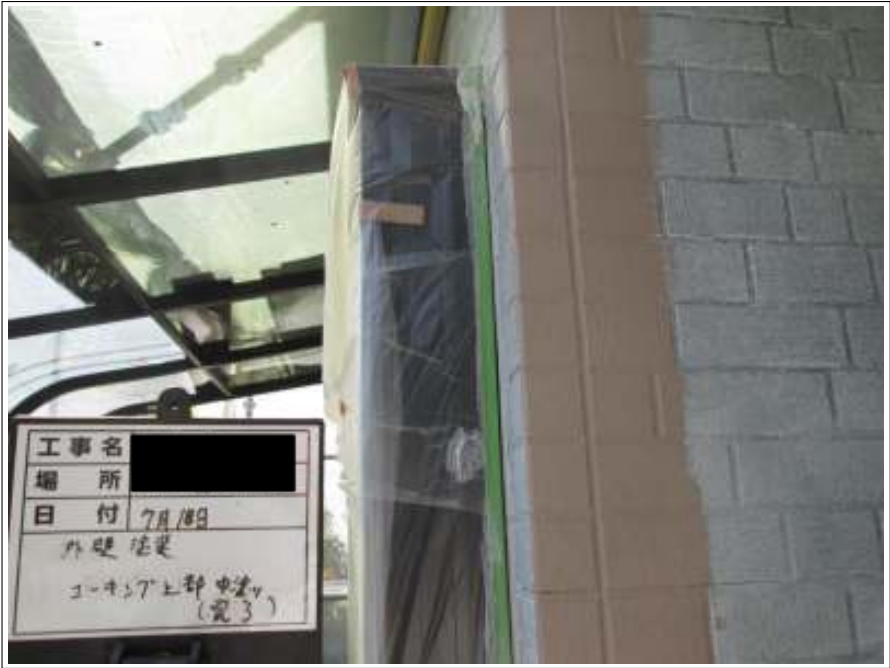
外壁 目地部増し塗り施工完了