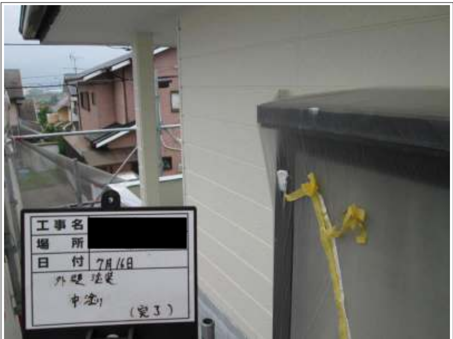
外壁 中塗り施工完了