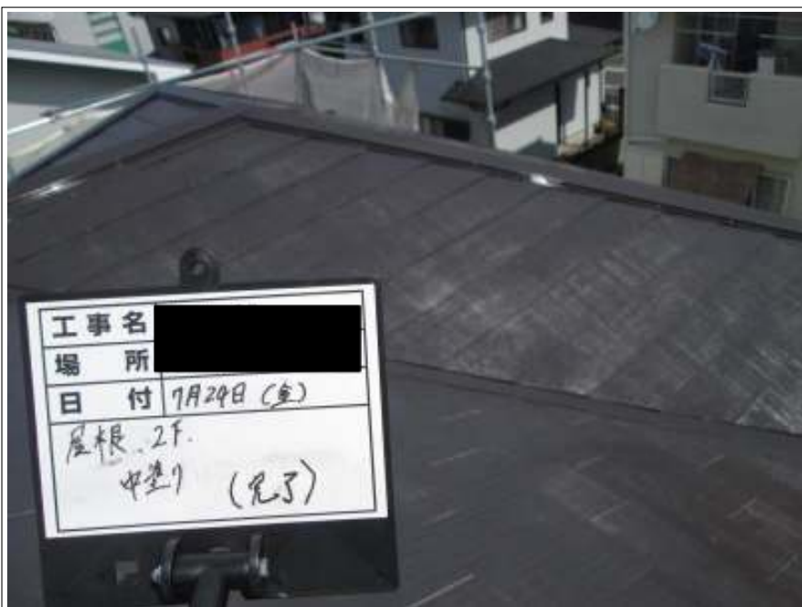
屋根 中塗り施工完了