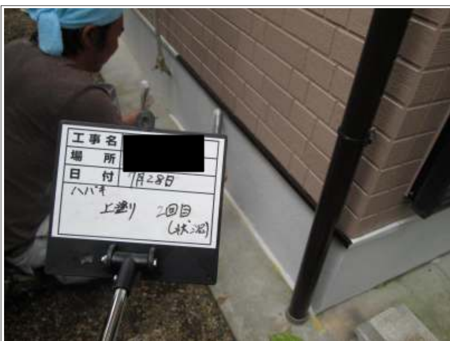
基礎 上塗り施工中(2回目)