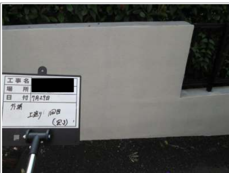
塀 上塗り施工完了(1回目)