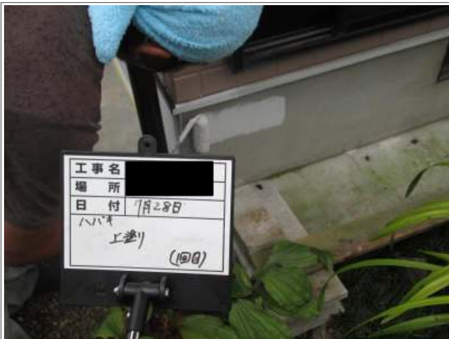
基礎 上塗り施工中(1回目)