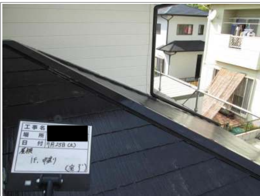
下屋根 中塗り施工完了