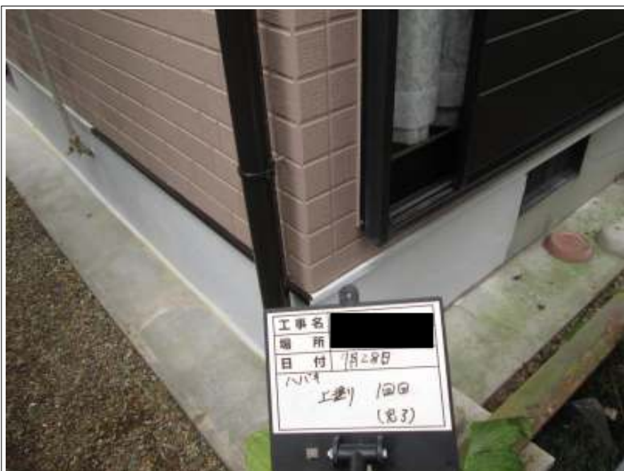
基礎 上塗り施工完了(1回目)