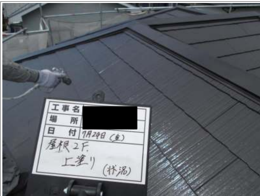
屋根 上塗り施工中