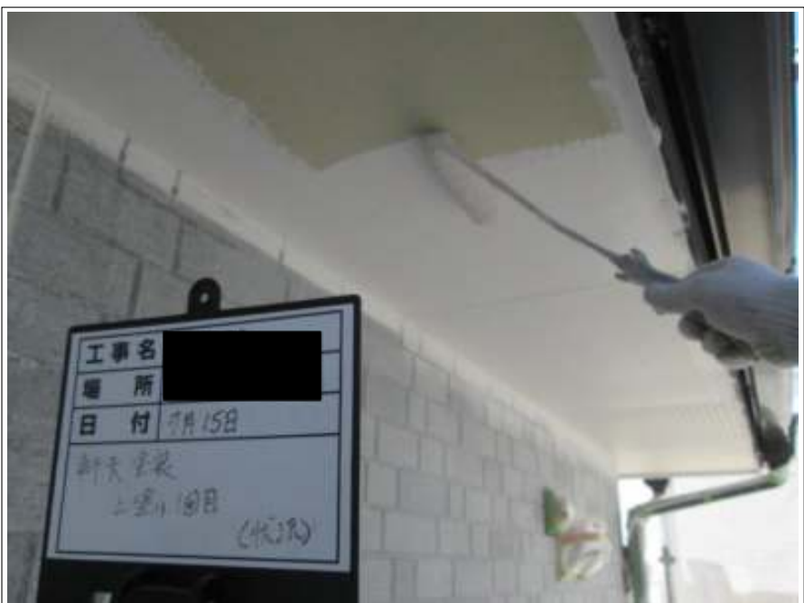
軒天 上塗り施工中(1回目)