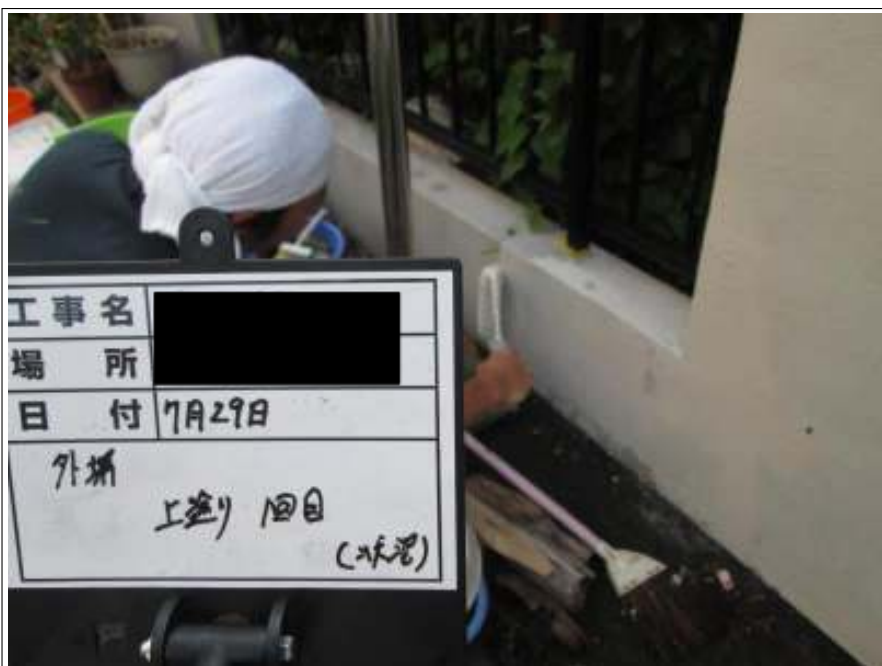
塀 上塗り施工中(1回目)