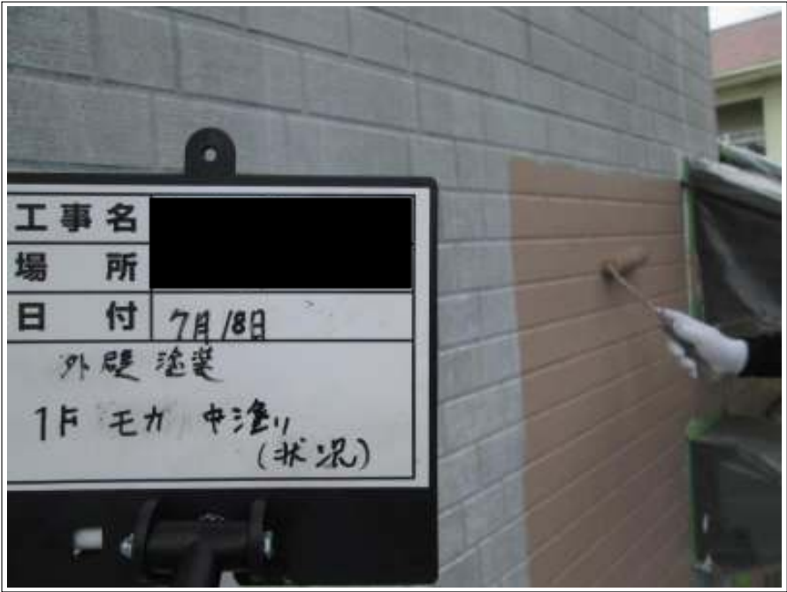
外壁 中塗り施工中