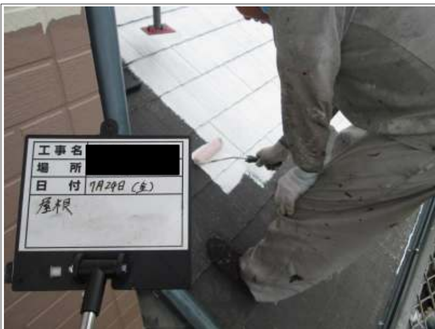
下屋根 下塗り施工中