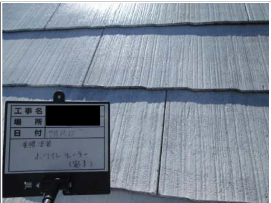
屋根 下塗り施工完了