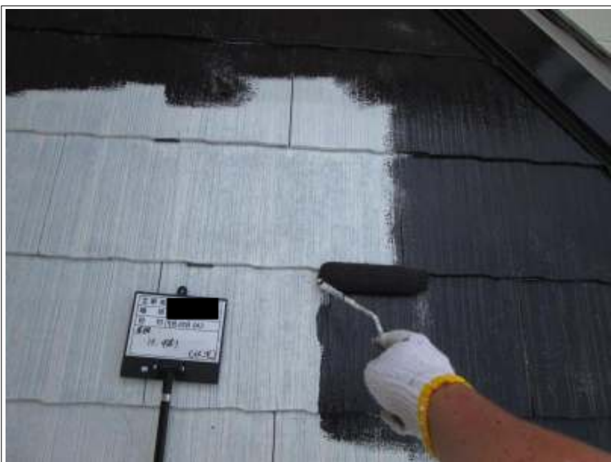
下屋根 中塗り施工中