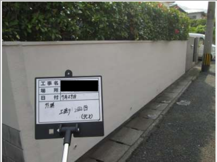
塀 上塗り施工完了(2回目)