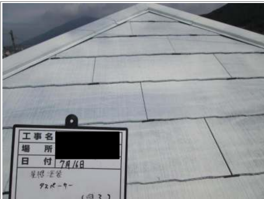
屋根 タスペーサー取付施工完了