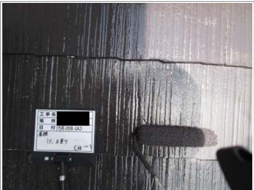
下屋根 上塗り施工中