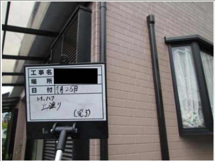
樋 上塗り施工完了