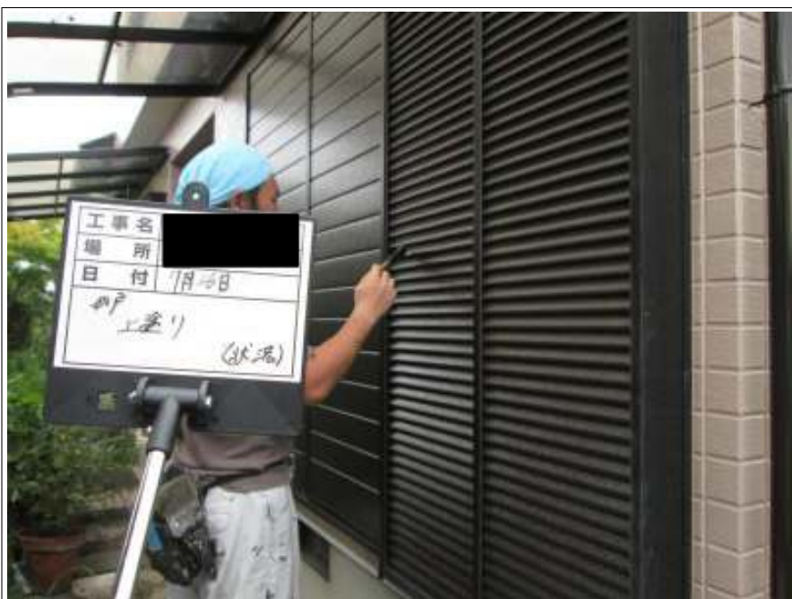
雨戸 上塗り施工中