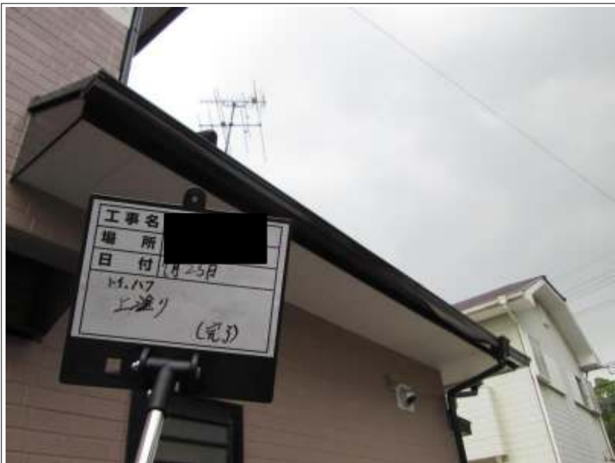
破風板 上塗り施工完了