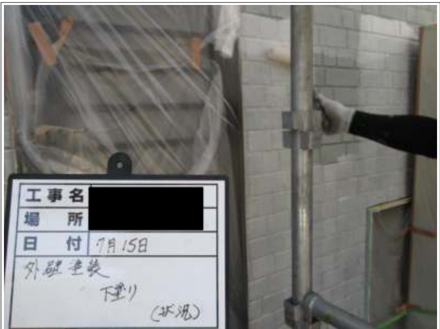
外壁 下塗り施工中