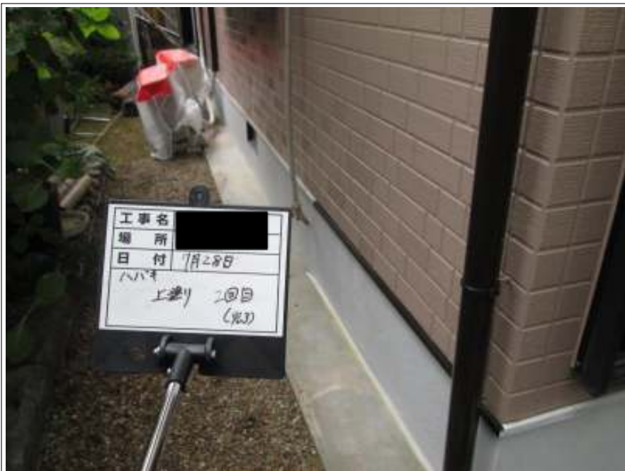
基礎 上塗り施工完了(2回目)