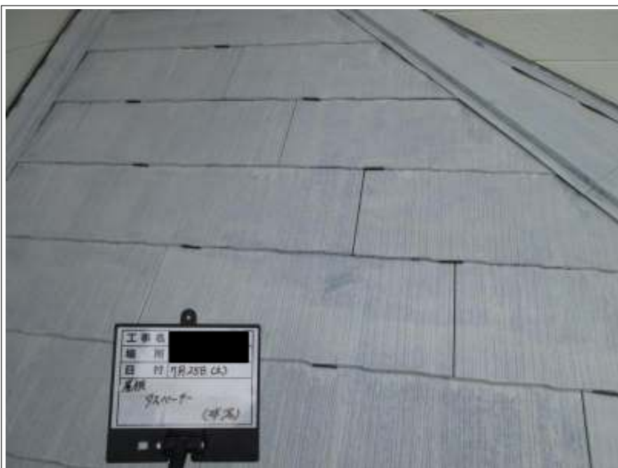
下屋根 タスペーサー取付施工中