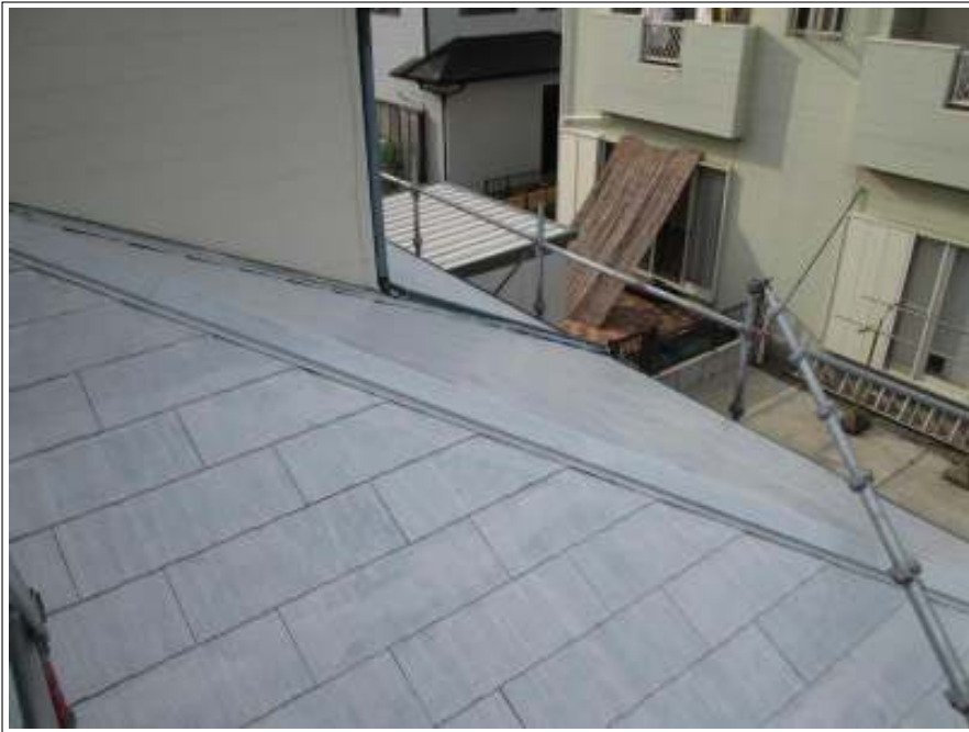
下屋根 下塗り施工完了