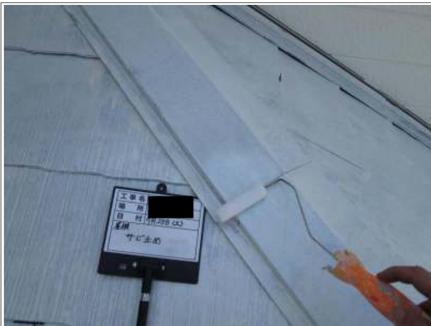
下屋根板金 サビ止め施工中