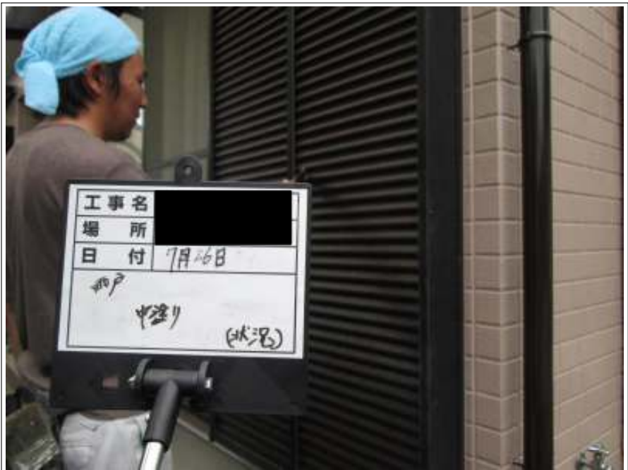
雨戸 中塗り施工中