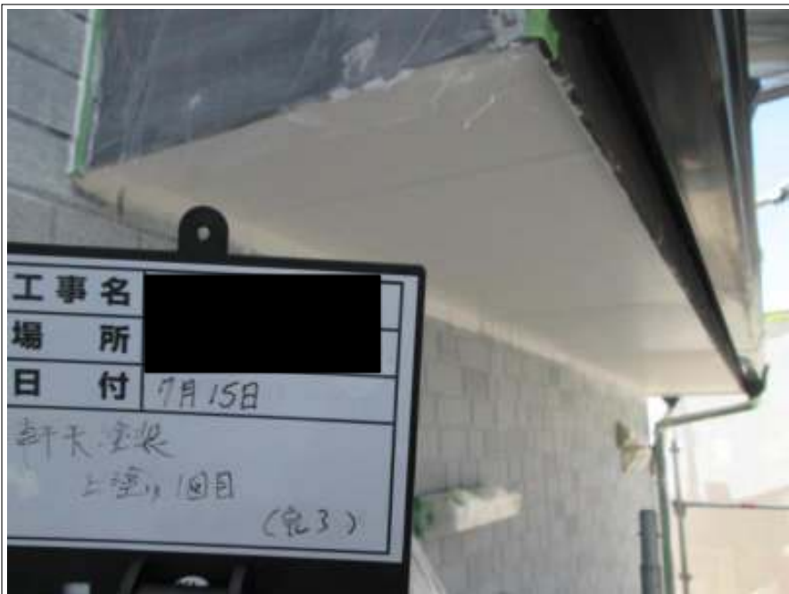
軒天 上塗り施工完了(1回目)