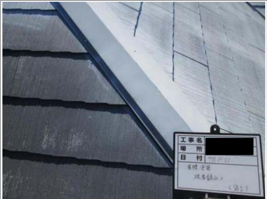
屋根板金 サビ止め施工完了