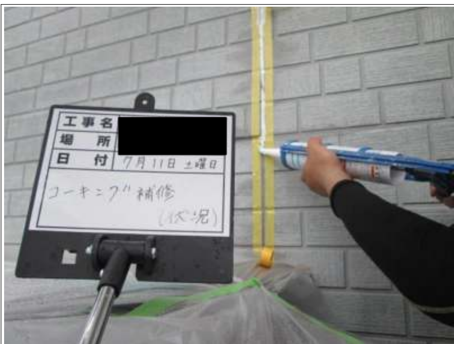
外壁 コーキング打ち替え 施工中