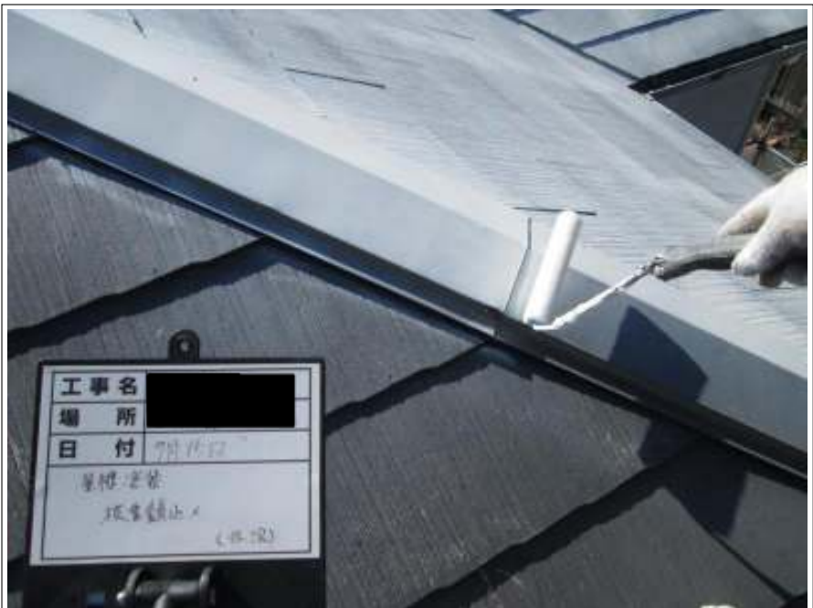
屋根板金 サビ止め施工中