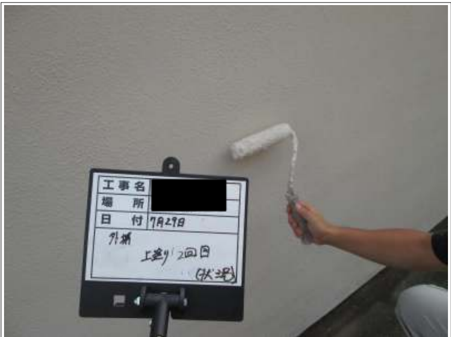
塀 上塗り施工中(2回目)