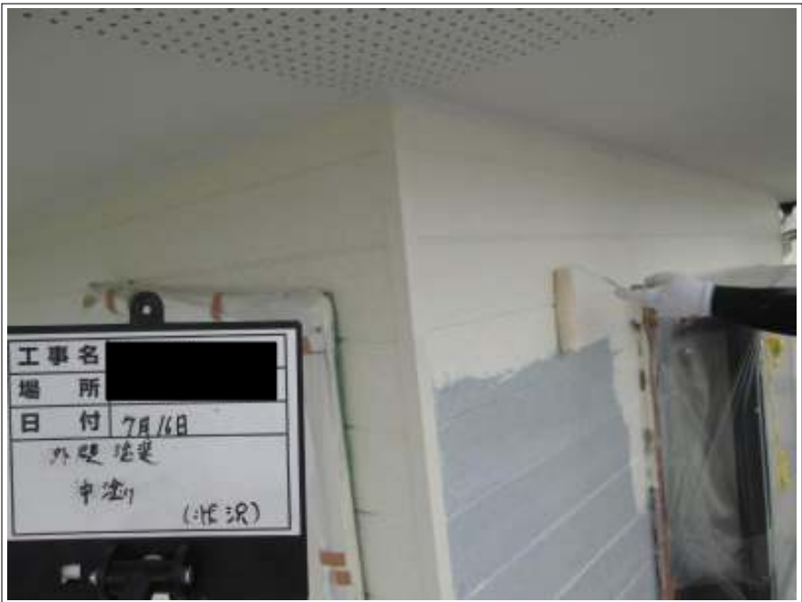
外壁 中塗り施工中