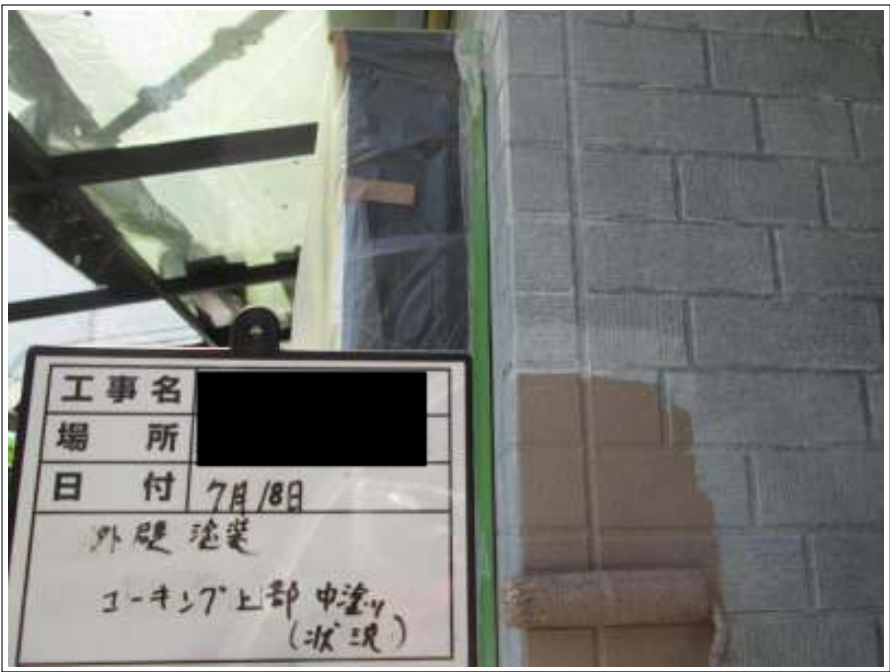
外壁 目地部増し塗り施工中