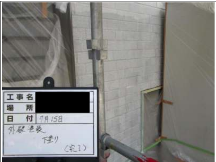
外壁 下塗り施工完了