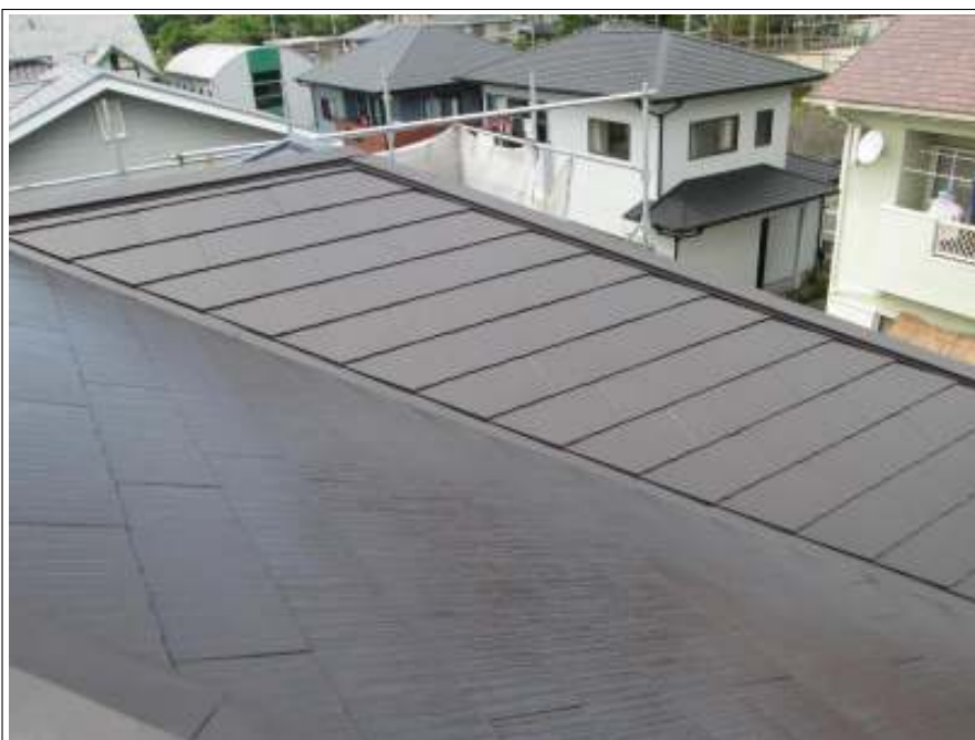
屋根 上塗り施工完了