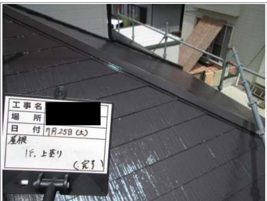
下屋根 上塗り施工完了