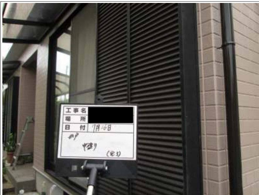
雨戸 中塗り施工完了