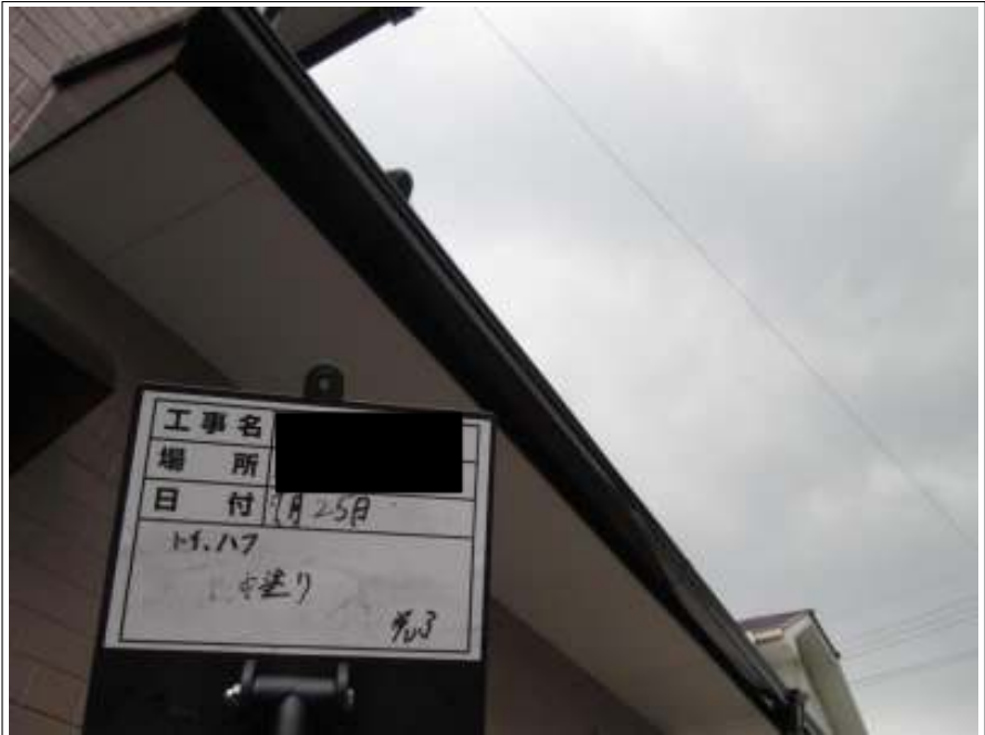
破風板 中塗り施工完了