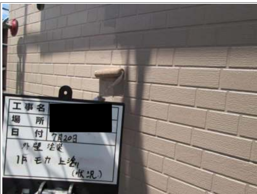
外壁 上塗り施工中