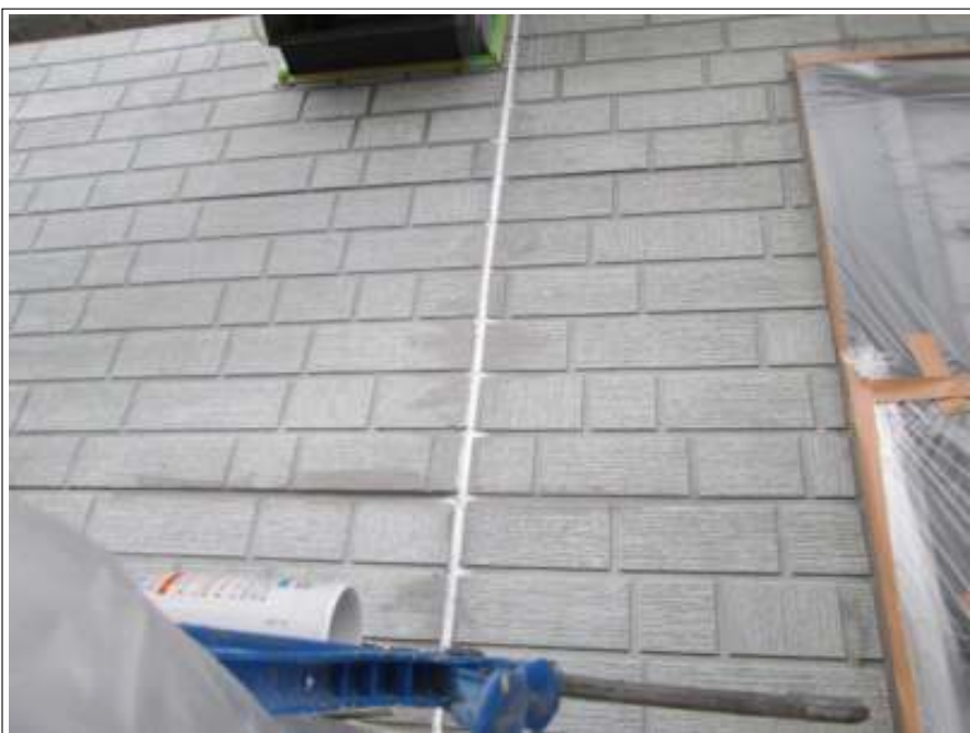
外壁 コーキング打ち替え 施工完了