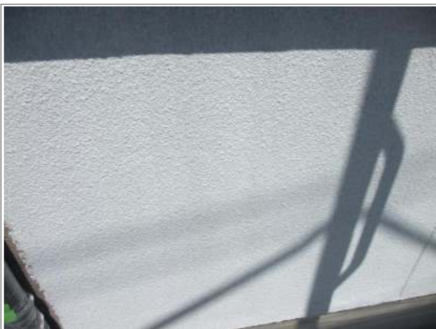
外壁 下塗り施工完了