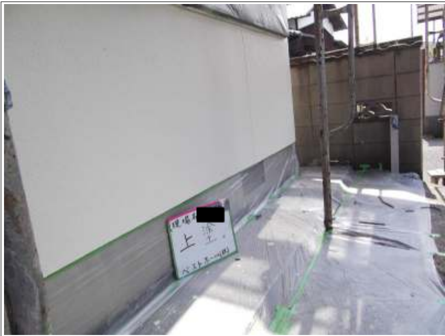
外壁 上塗り施工中