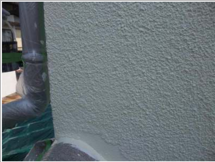
外壁 中塗り施工完了