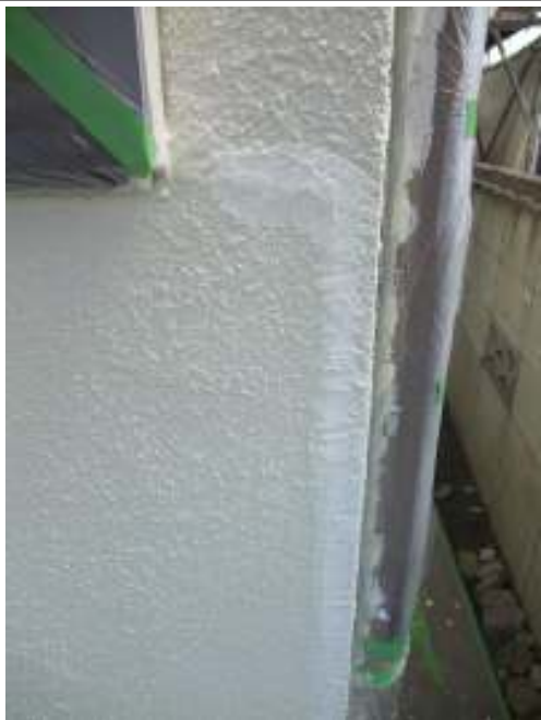
外壁 クラック補修施工完了