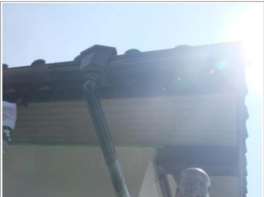
破風板・雨樋 施工完了