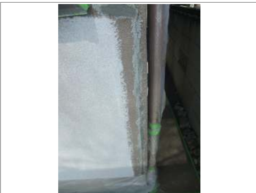
外壁 クラック補修施工前