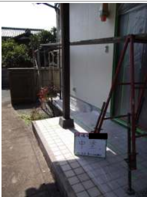
外壁 中塗り施工中