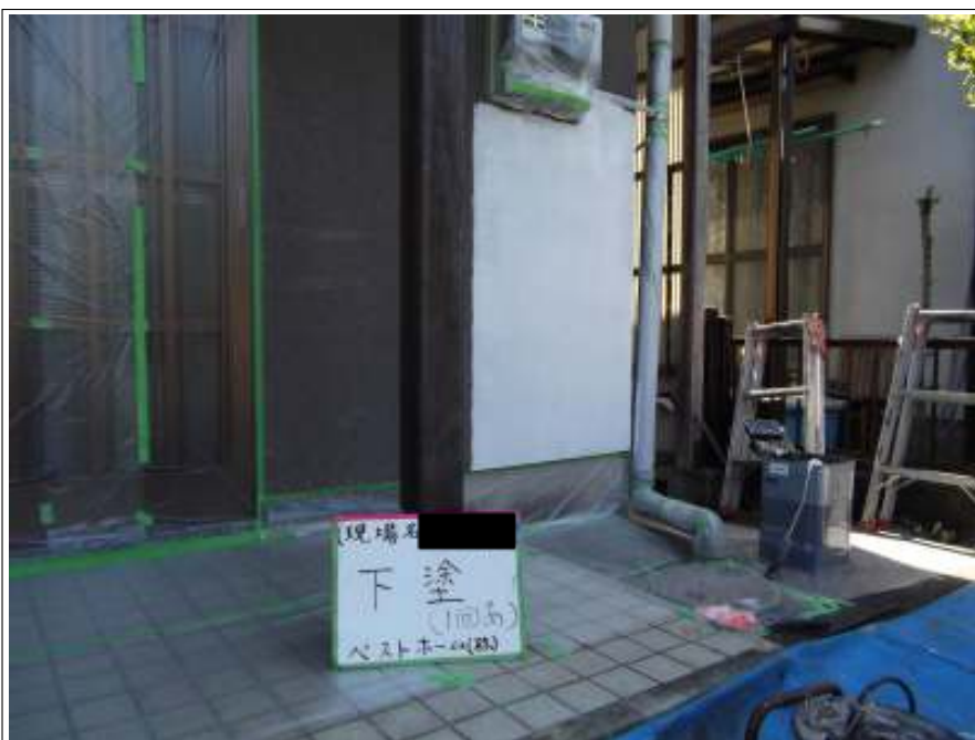
外壁 下塗り施工中