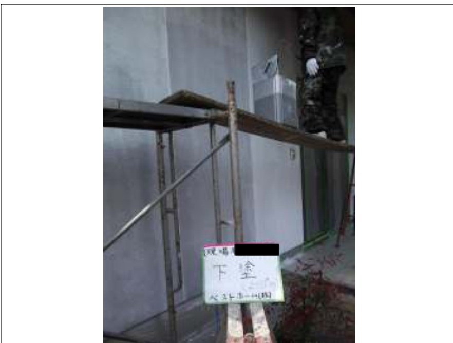
外壁 下塗り施工中