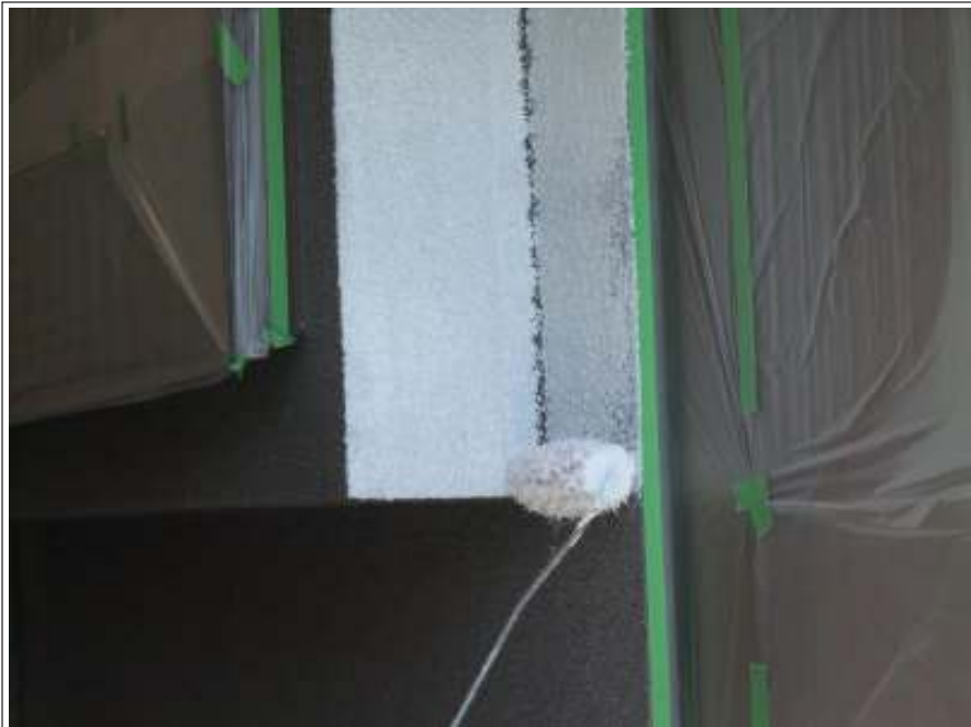
外壁 下塗り施工中