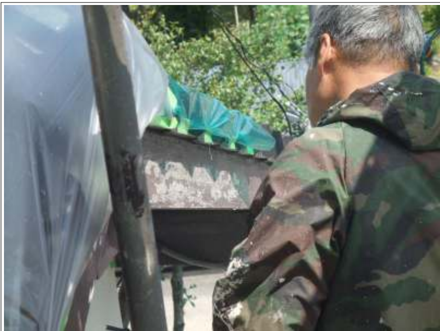
破風板 ケレン施工中