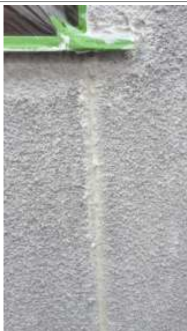
外壁 クラック補修施工完了