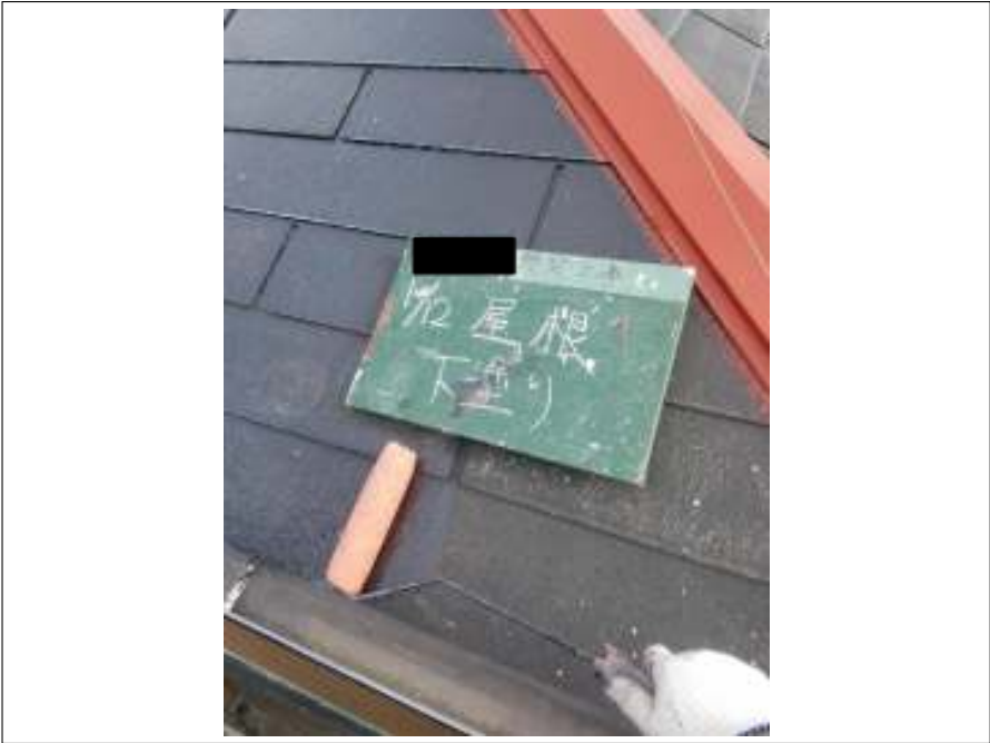
屋根 下塗り施工中