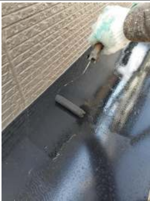
小庇 上塗り（2回目）施工中