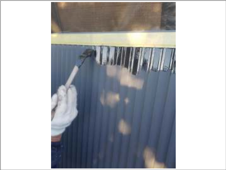
雨戸 上塗り（1回目）施工中