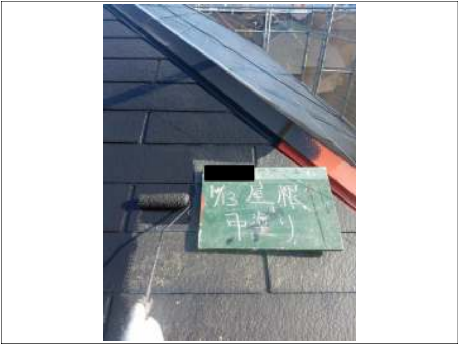
屋根 中塗り施工中