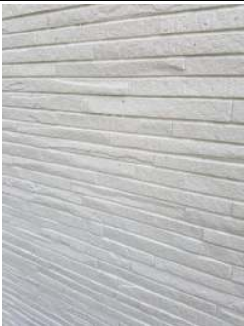
外壁 中塗り施工後