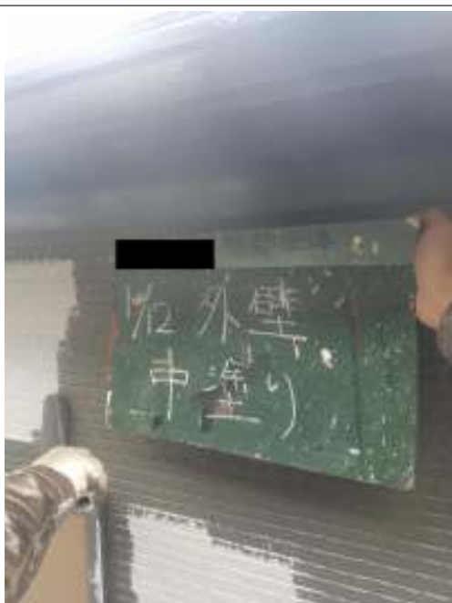
外壁 中塗り施工中