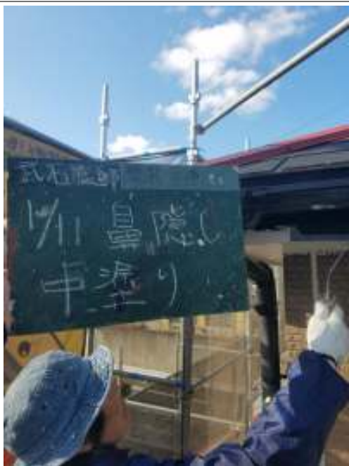
鼻隠し 中塗り施工中