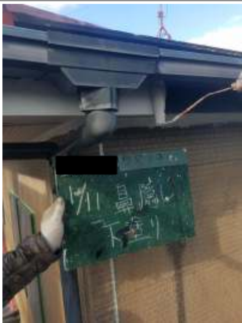
鼻隠し 下塗り施工中