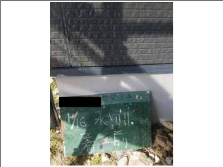
土台水切り 施工前