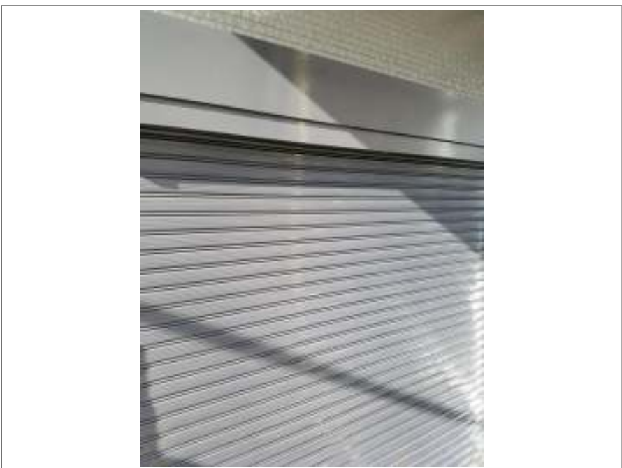
シャッター 施工完了