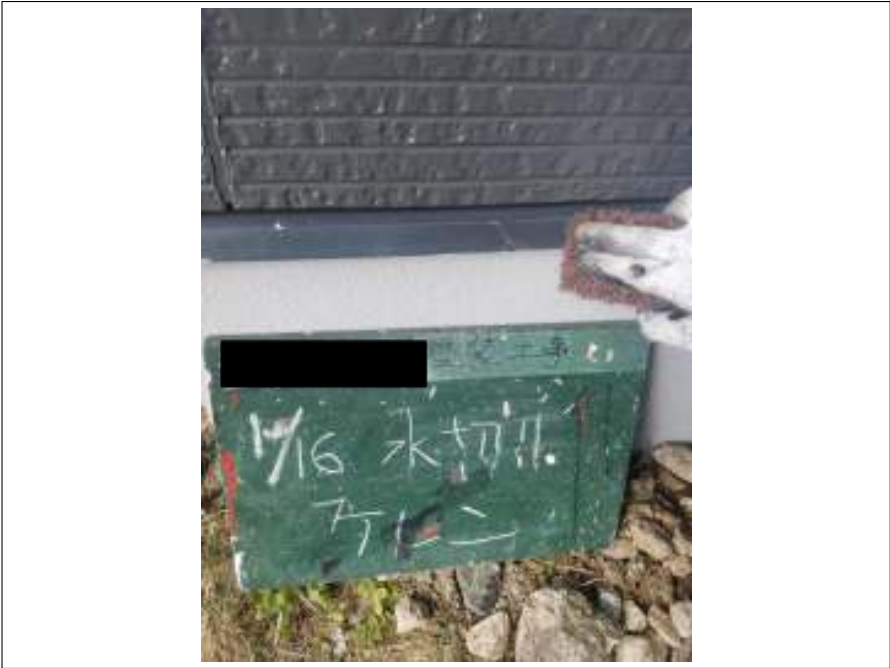
土台水切り ケレン処理施工中