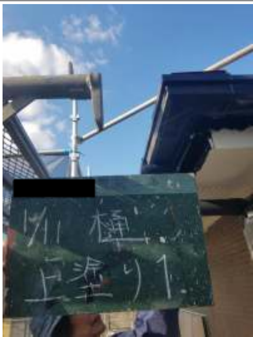
樋 上塗り（1回目）施工中