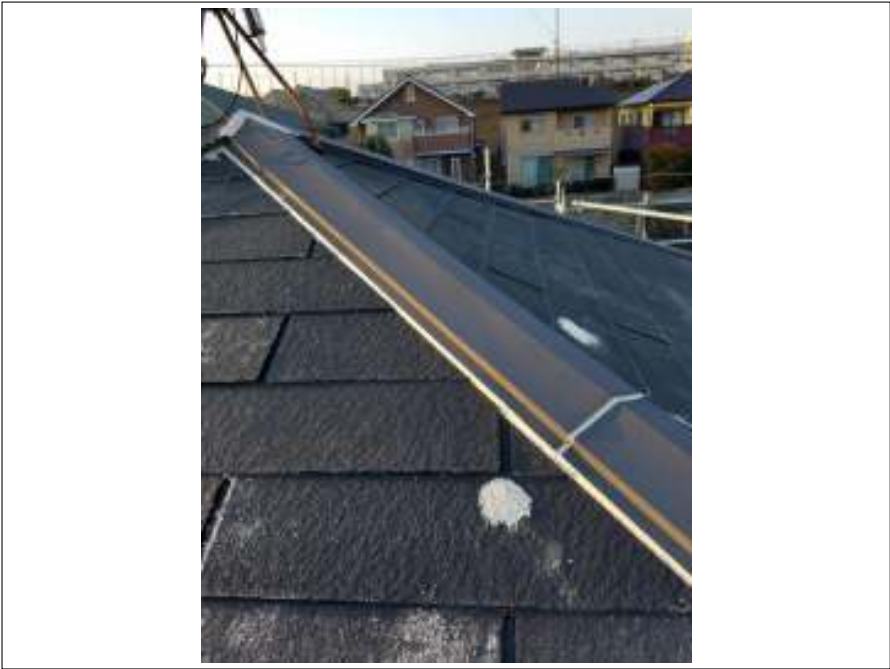
屋根 下地処理施工後