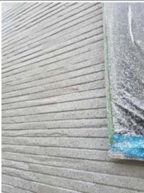
外壁 上塗り施工後