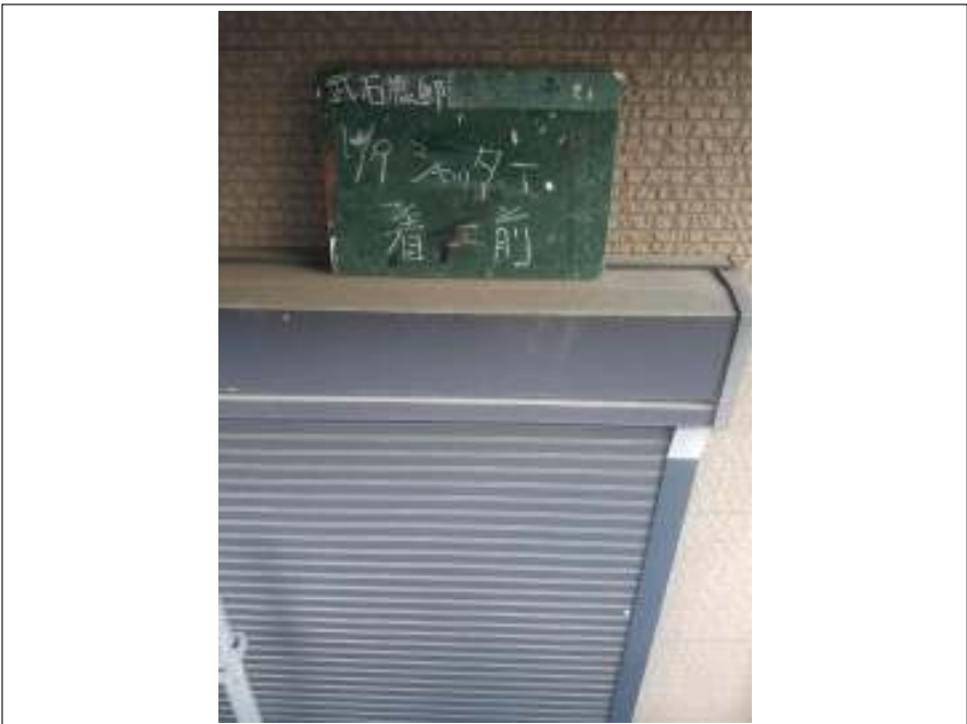
シャッター 施工前