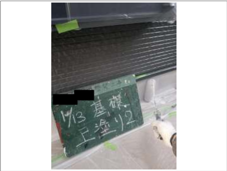
基礎 上塗り（2回目）施工中