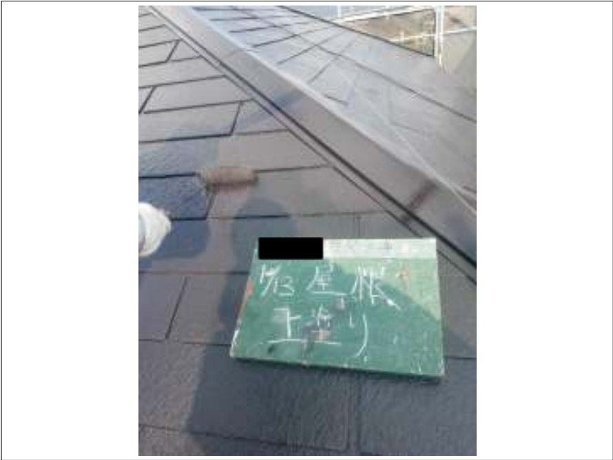
屋根 上塗り施工中