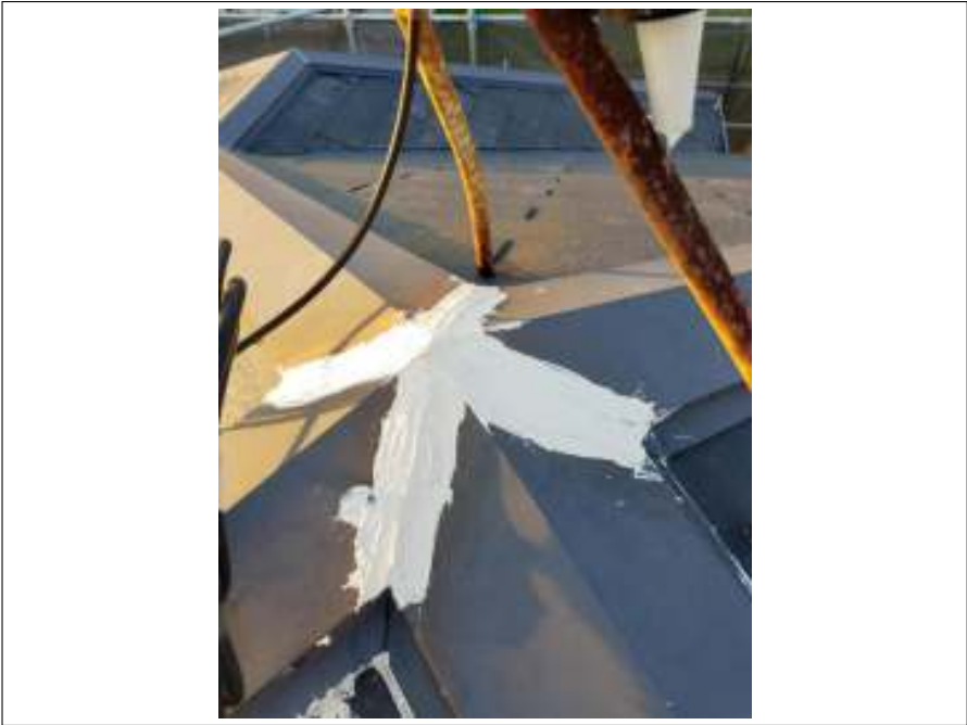
屋根 下地処理施工後