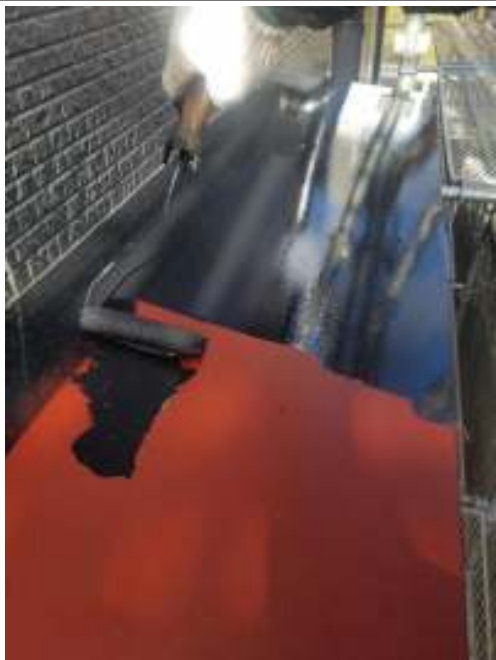
小庇 上塗り（1回目）施工中