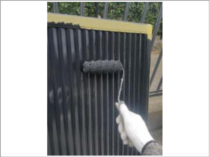
雨戸 上塗り（2回目）施工中