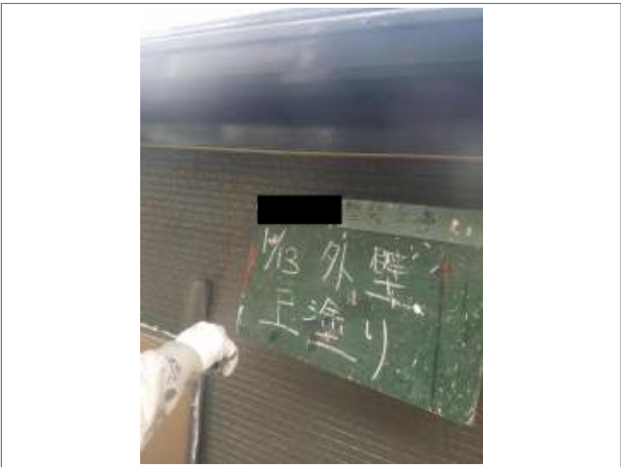
外壁 上塗り施工中