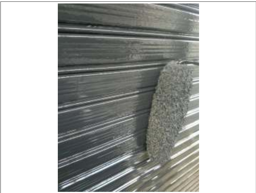
シャッター 上塗り(2回目) 施工中