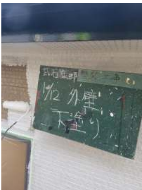
外壁 下塗り施工中