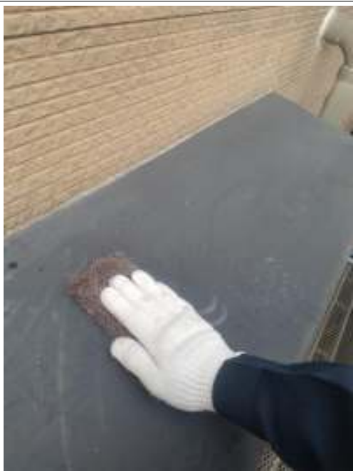
小庇 ケレン処理施工中