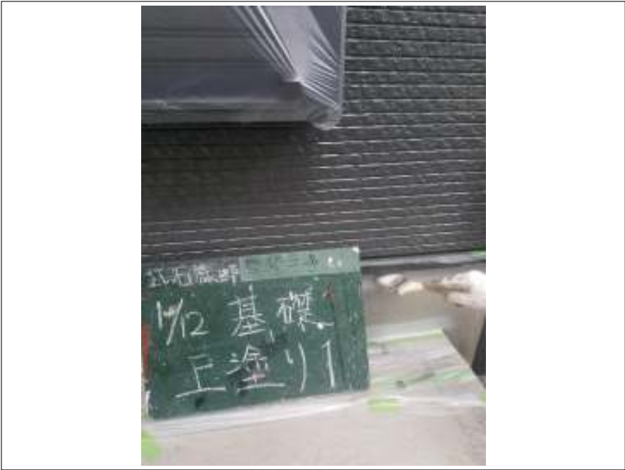
基礎 上塗り（1回目）施工中