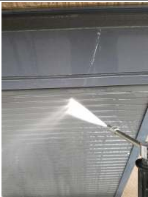
シャッター 高圧洗浄中