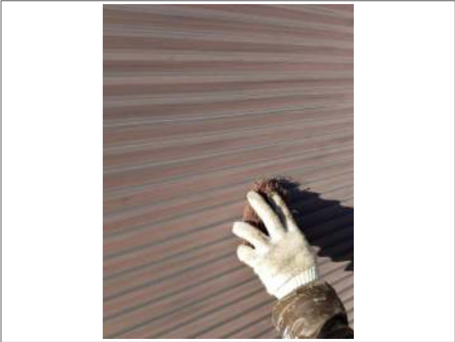
雨戸 ケレン処理施工中