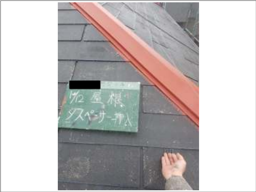
屋根 タスペーサー取付施工中