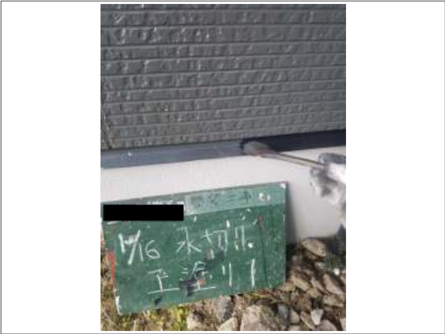
土台水切り 上塗り(1回目)施工中