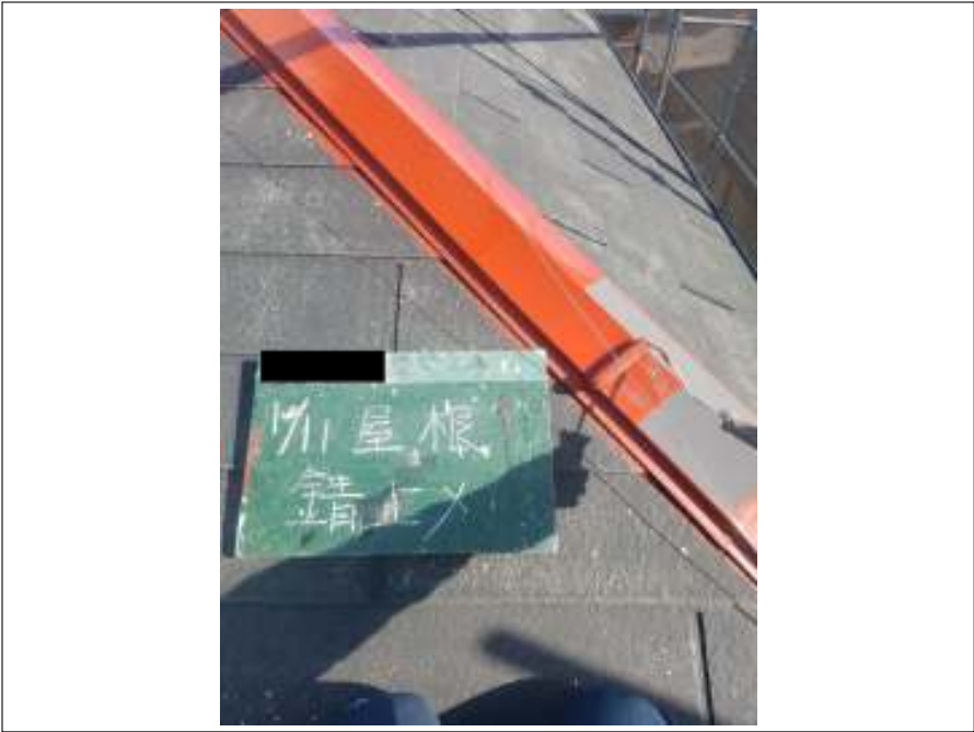
屋根板金 錆止め塗布