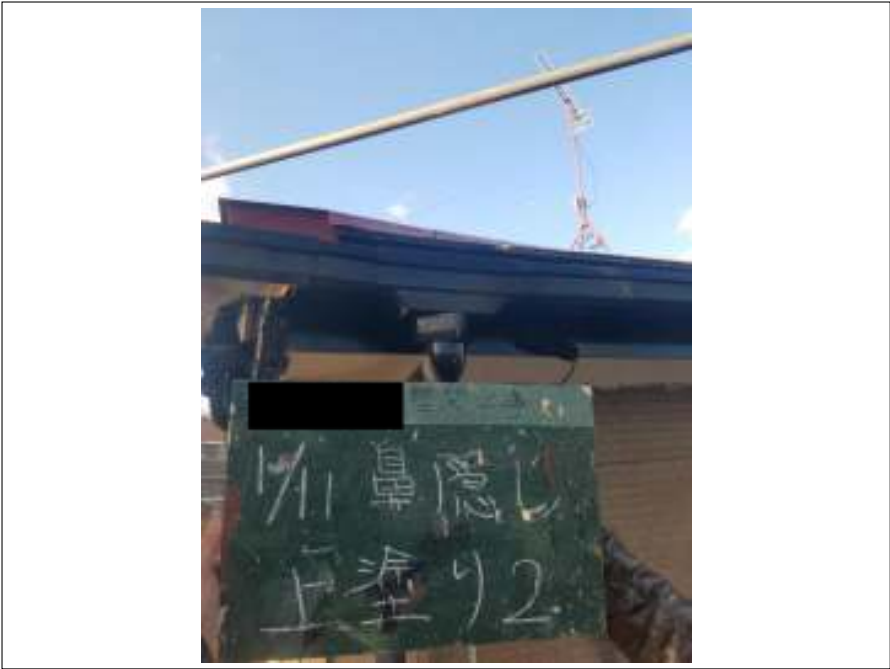
鼻隠し 上塗り施工中