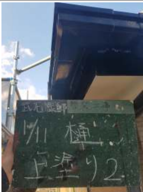
樋 上塗り（2回目）施工中