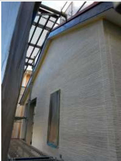
外壁 下塗り施工後