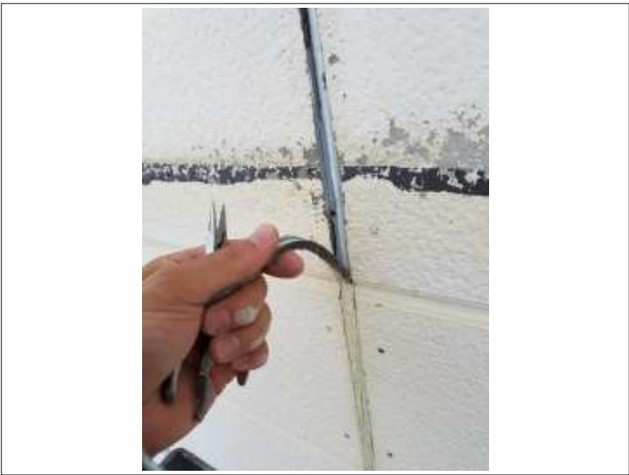
シーリング 既存撤去