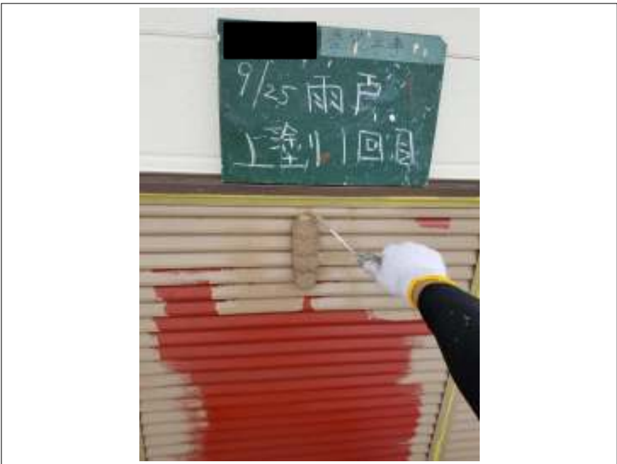
雨戸 上塗り（1回目）施工中