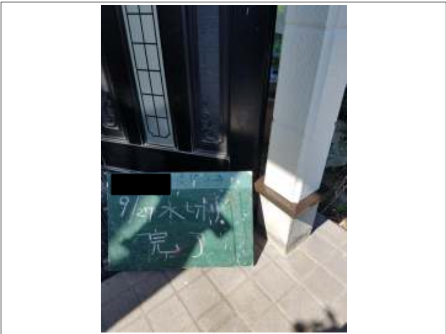
土台水切り 施工完了