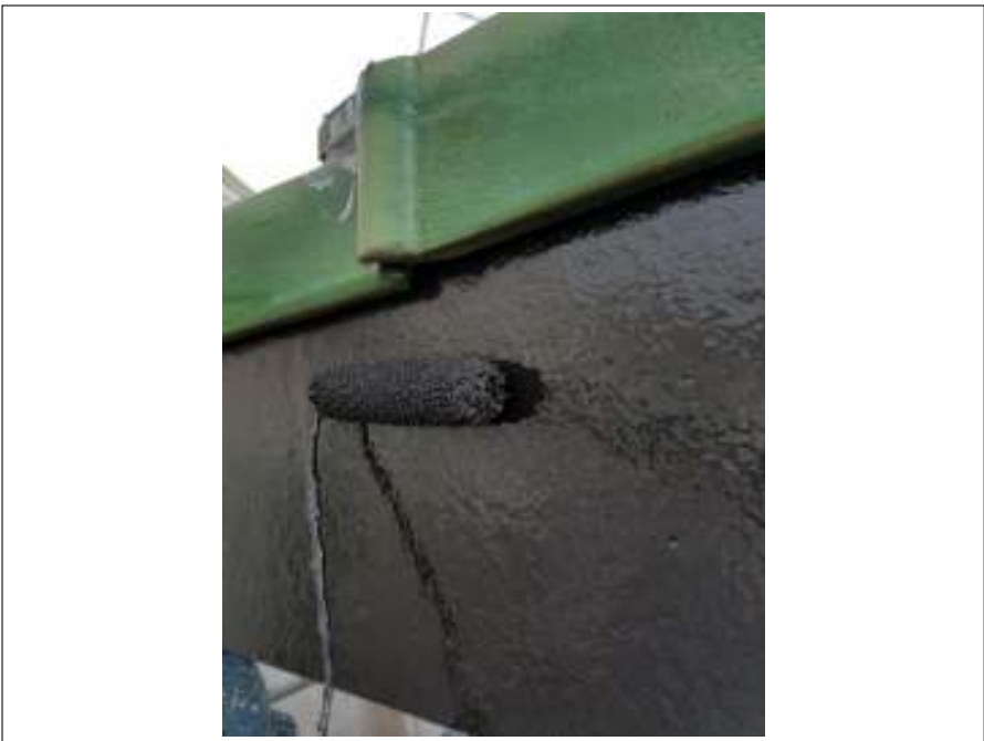
破風板 上塗り施工中