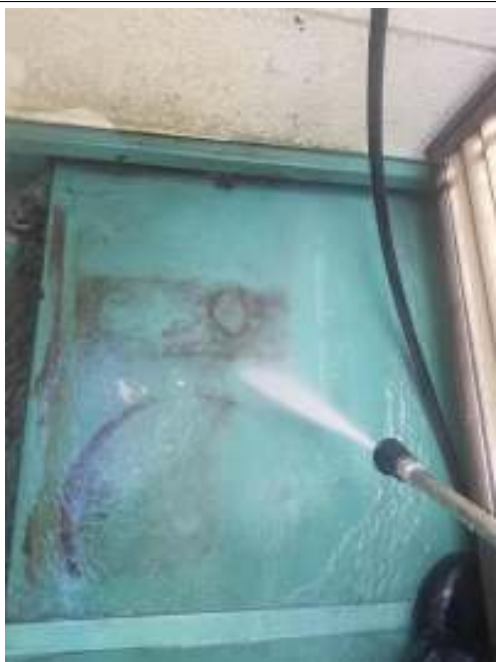
ベランダ 高圧洗浄中