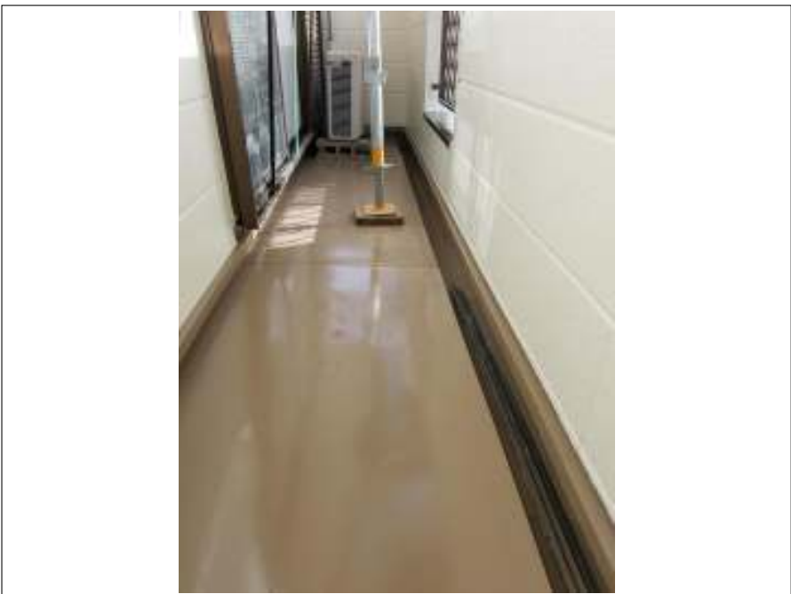
ベランダ 施工完了