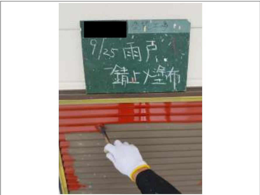
雨戸 サビ止め塗布施工中