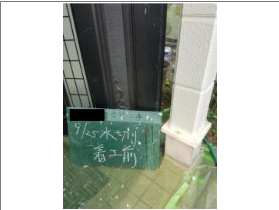
土台水切り 施工前