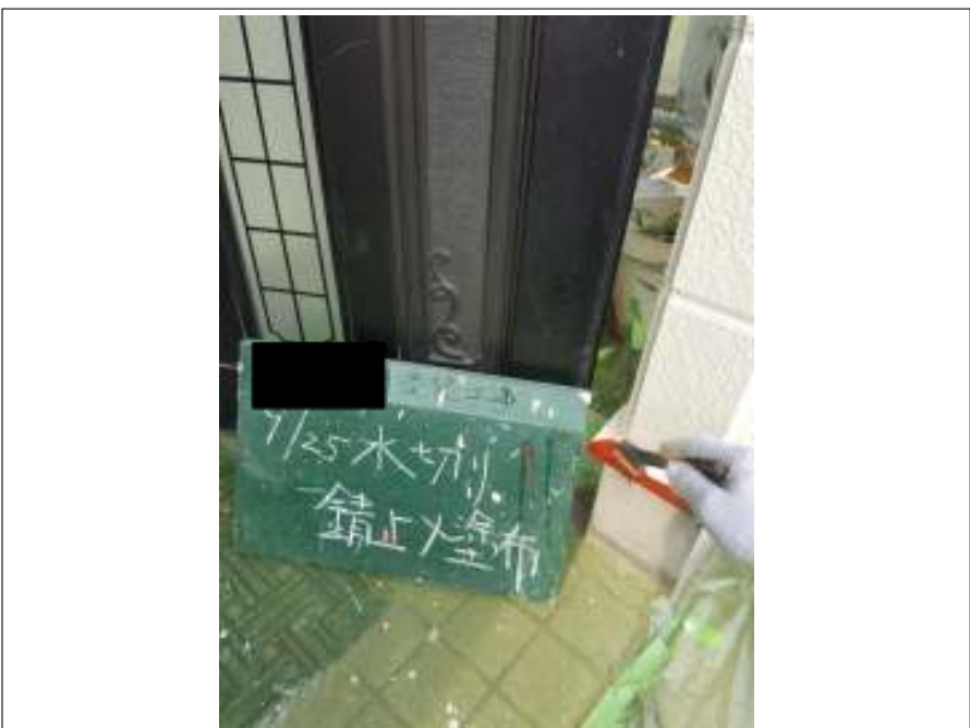
土台水切り 錆止め塗布施工中