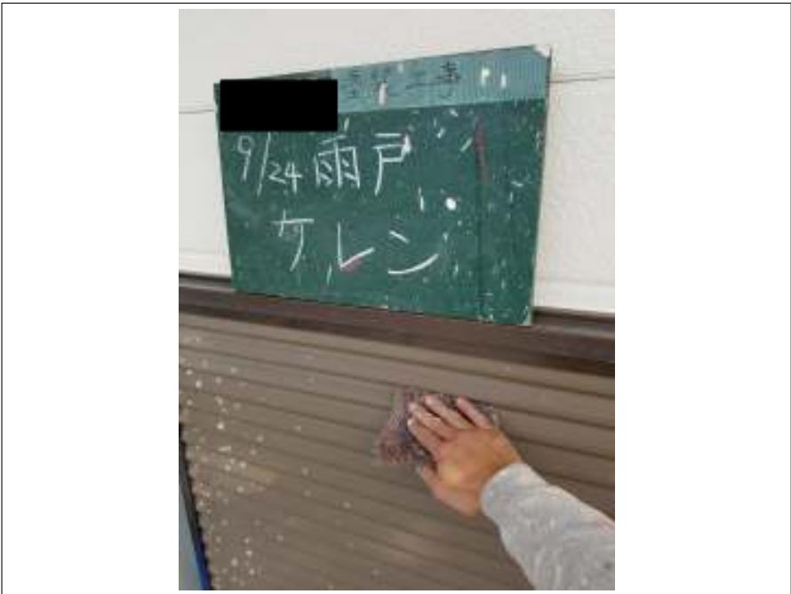
雨戸 ケレン処理施工中