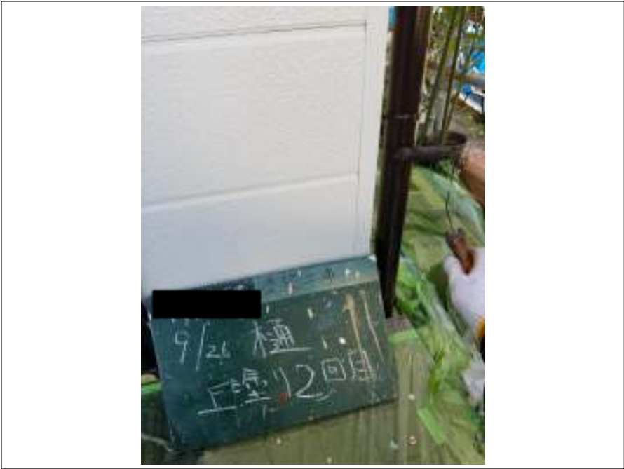
樋 上塗り (2回目) 施工中