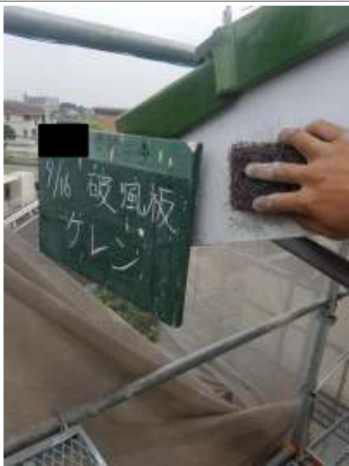
破風板 ケレン処理施工中