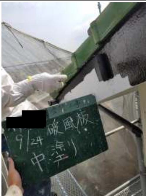
破風板 中塗り施工中