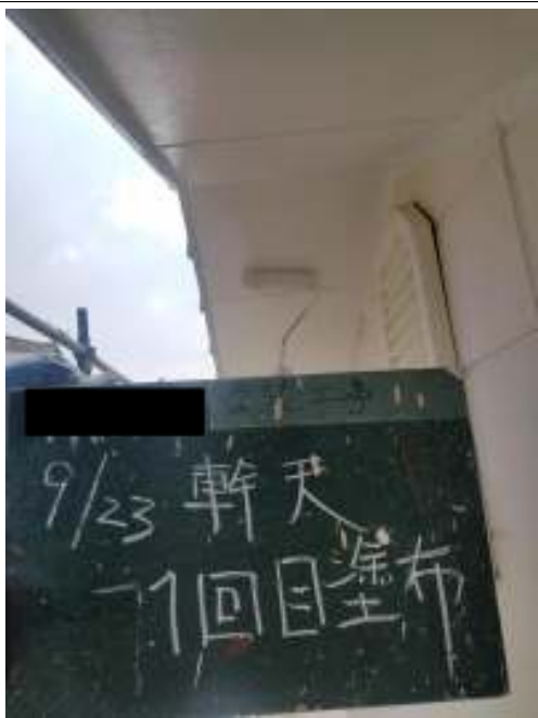
軒天 上塗り（1回目）施工中