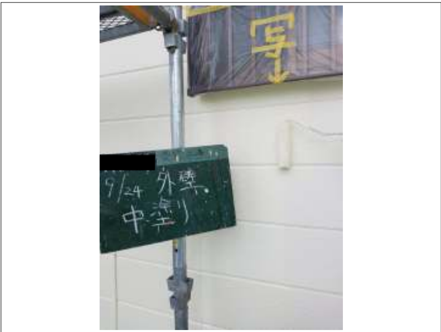
外壁 中塗り施工中