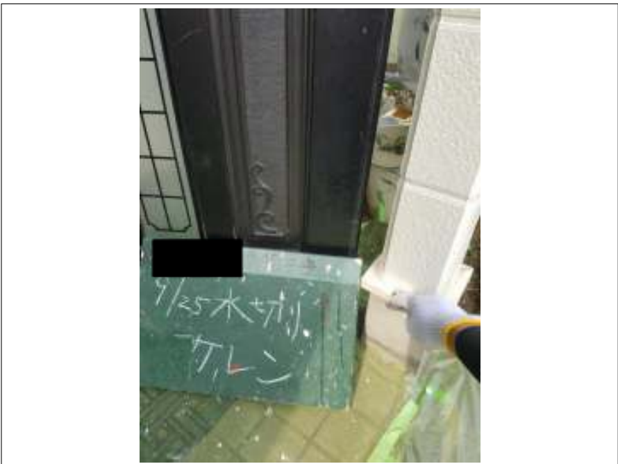
土台水切り ケレン処理施工中