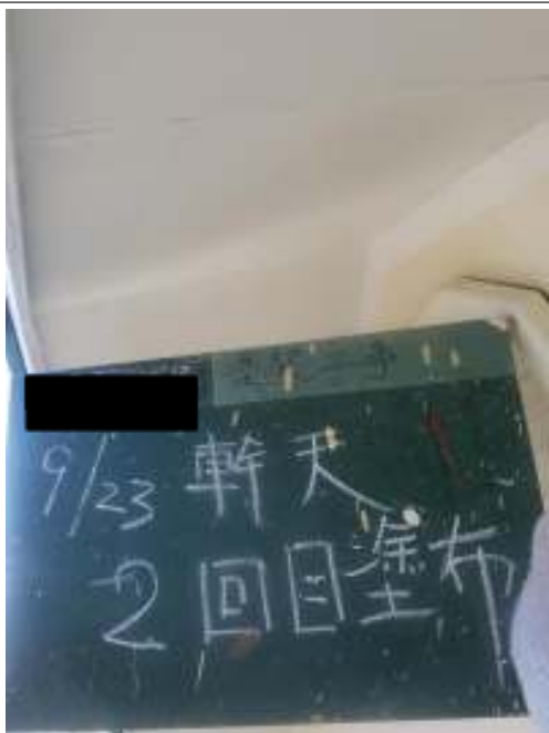
軒天 上塗り（2回目）施工中