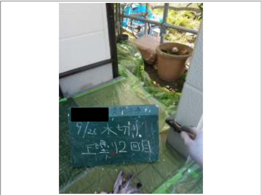
土台水切り 上塗り（2回目）施工中