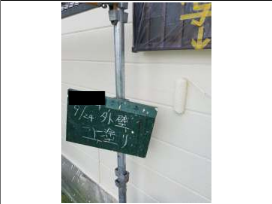
外壁 上塗り施工中