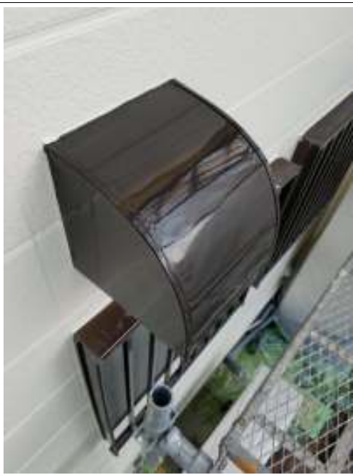
換気フード 施工完了