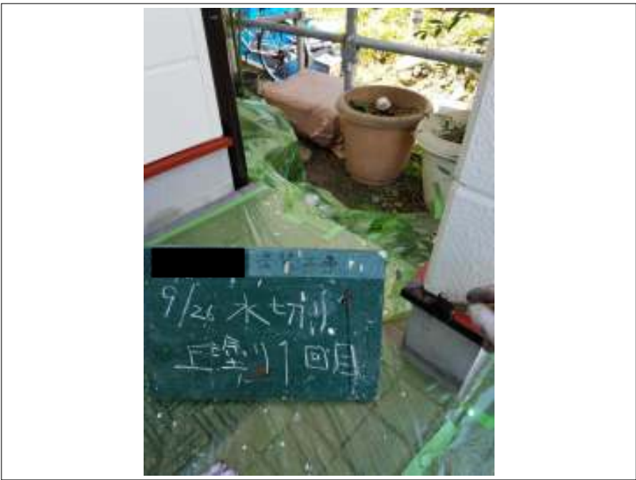
土台水切り 上塗り（1回目）施工中