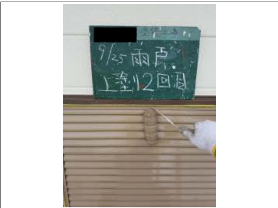
雨戸 上塗り（2回目）施工中