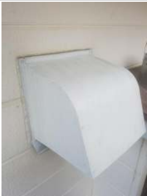
換気フード 施工前