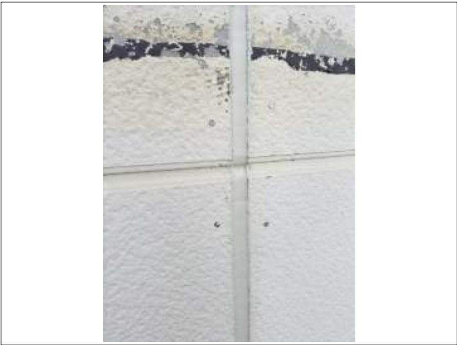
シーリング打ち替え 施工完了