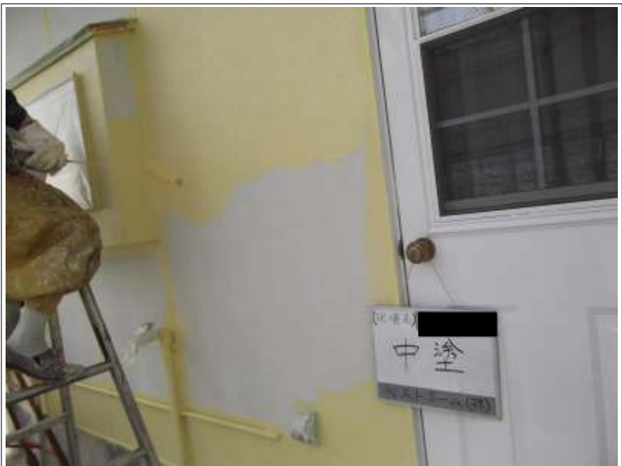
外壁 中塗り施工中