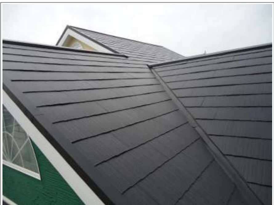
屋根 上塗り施工後