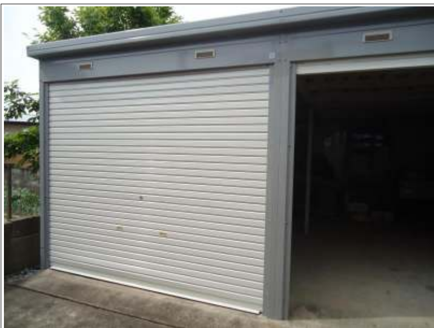
シャッター 施工後