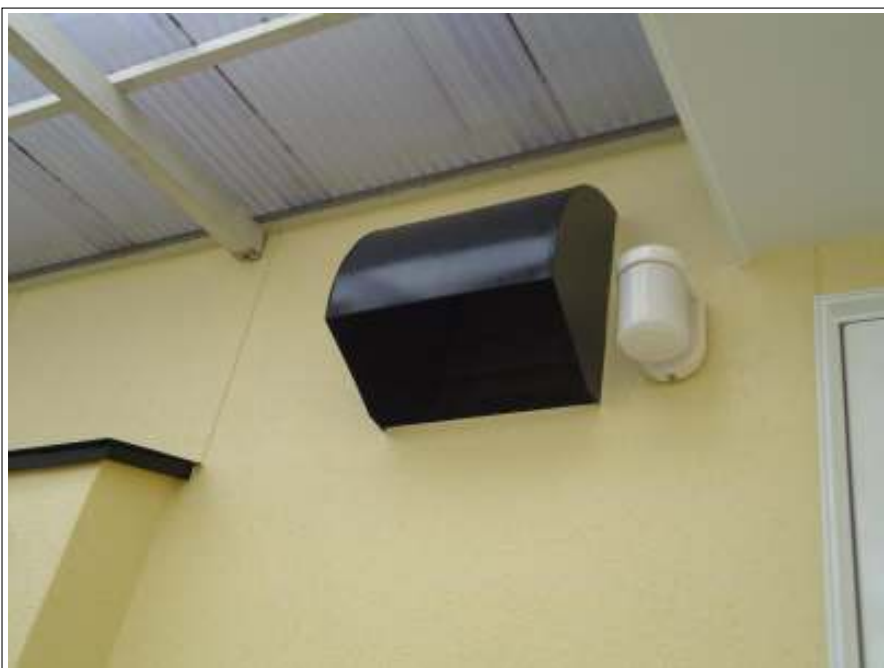
換気フード 施工後