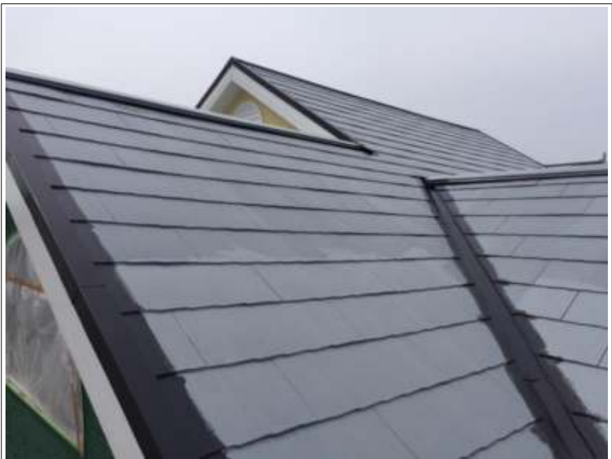
屋根 中塗り施工中