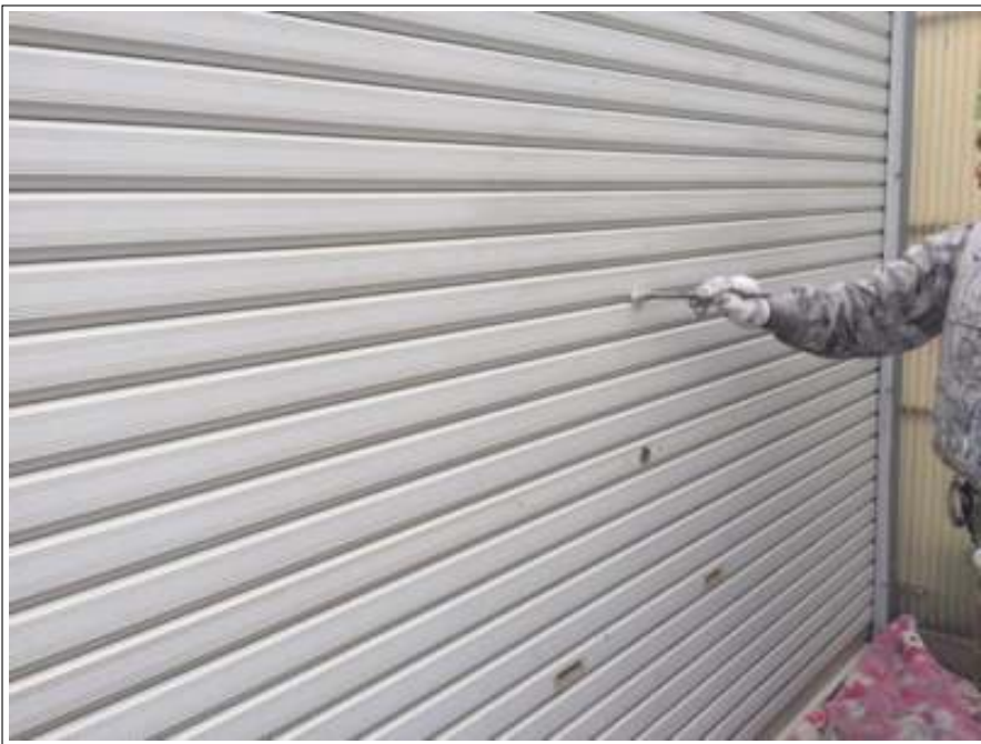
シャッター 上塗り施工中