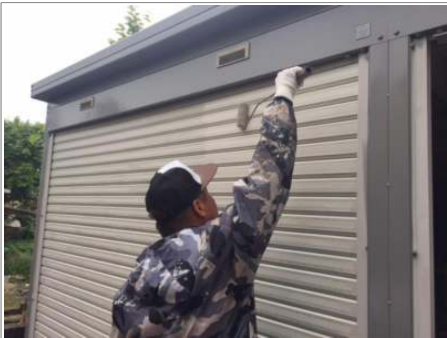
シャッター 上塗り施工中