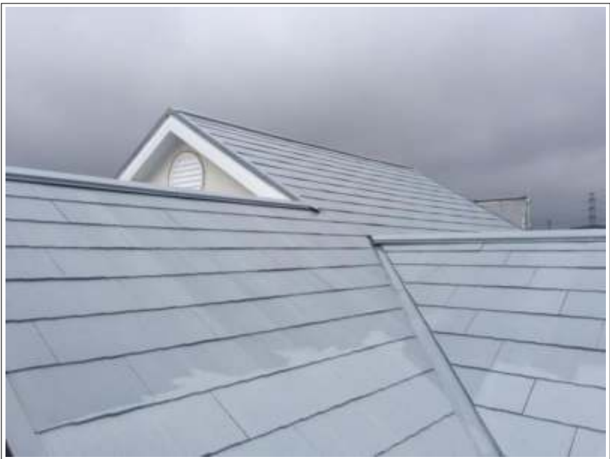
屋根 下塗り施工後