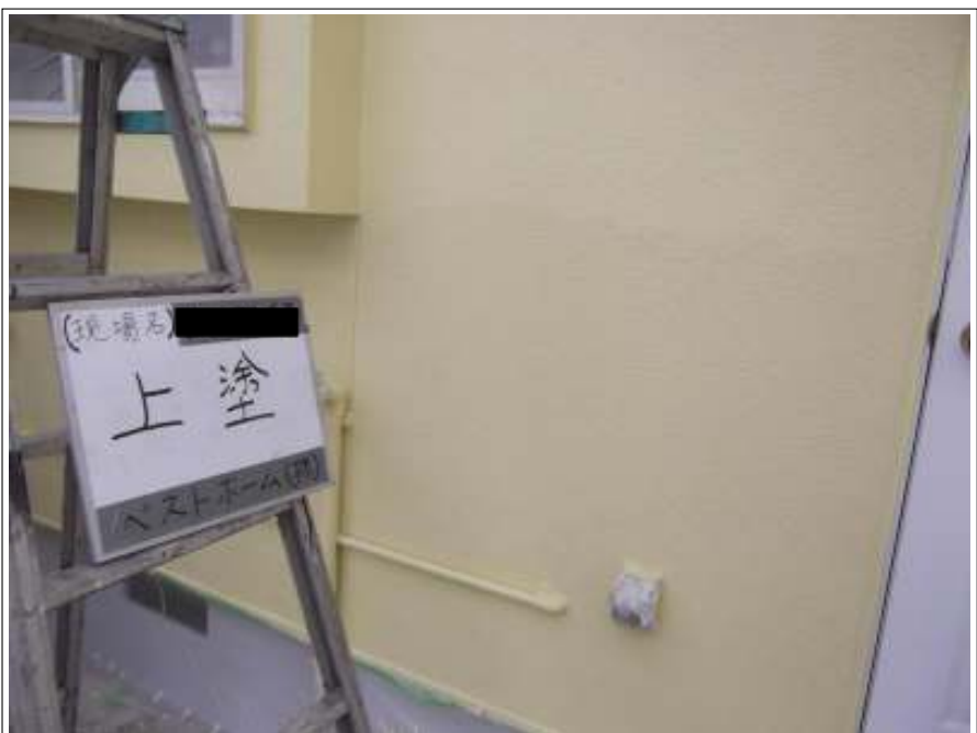
外壁 上塗り施工後