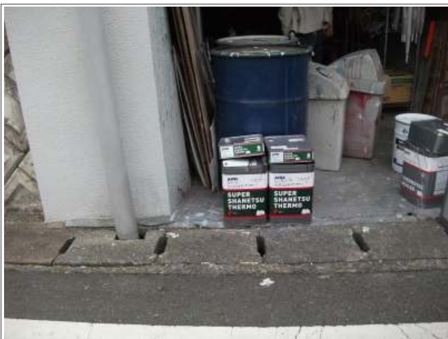
屋根 上塗り使用材料空缶