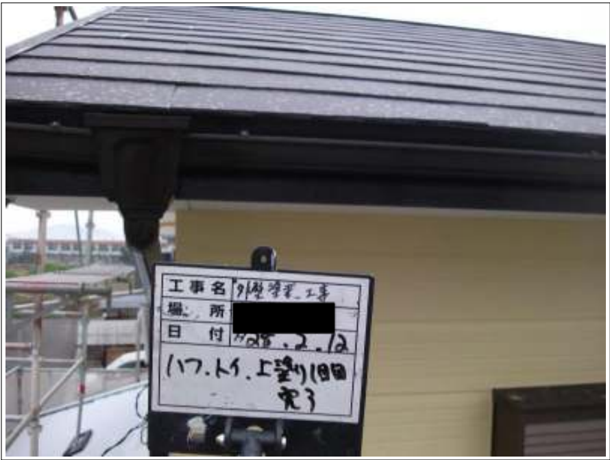
破風・樋 上塗り（1回目）施工後