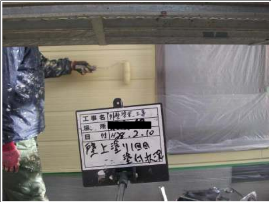
外壁 上塗り（1回目）施工中