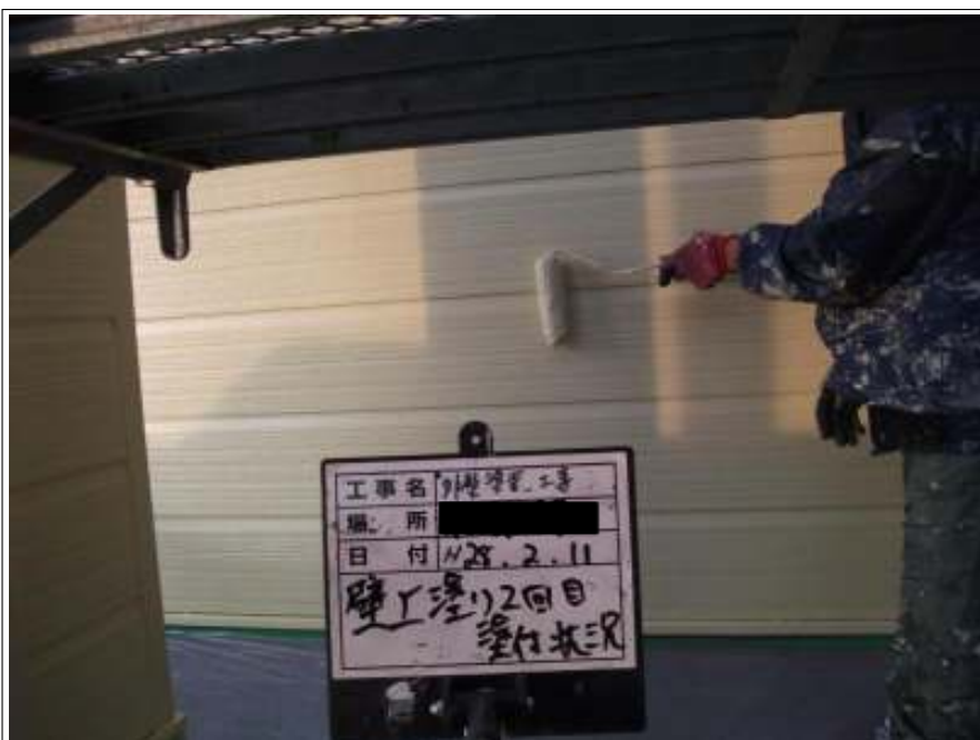
外壁 上塗り（2回目）施工中