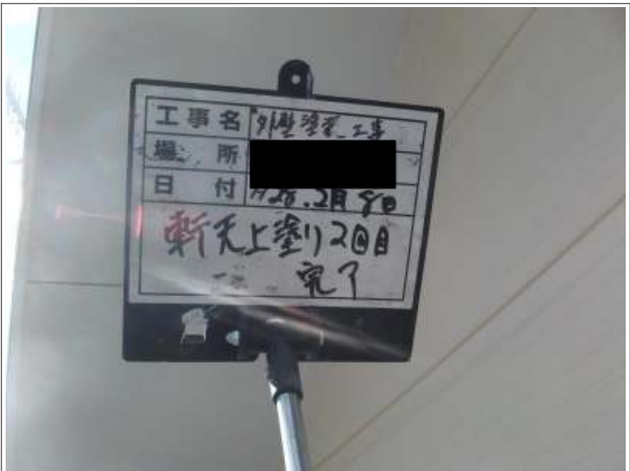
軒天 上塗り（2回目）施工後