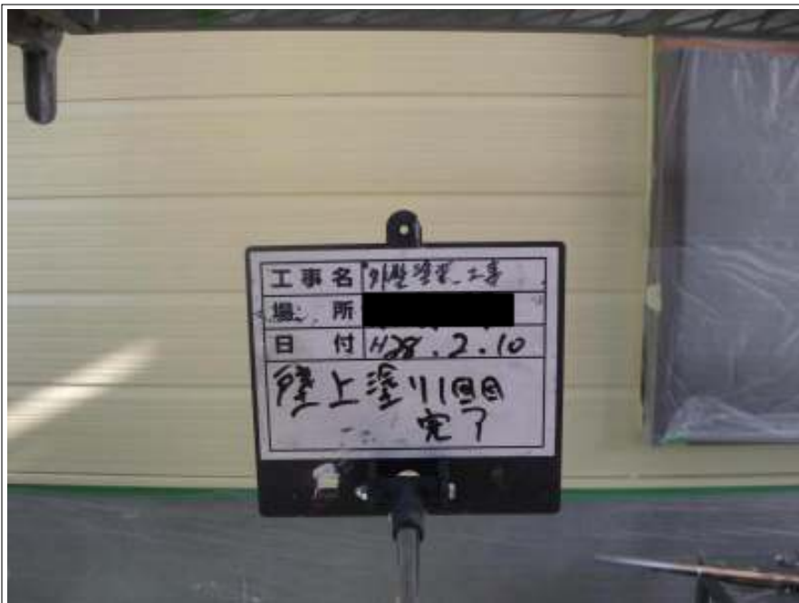
外壁 上塗り（1回目）施工後