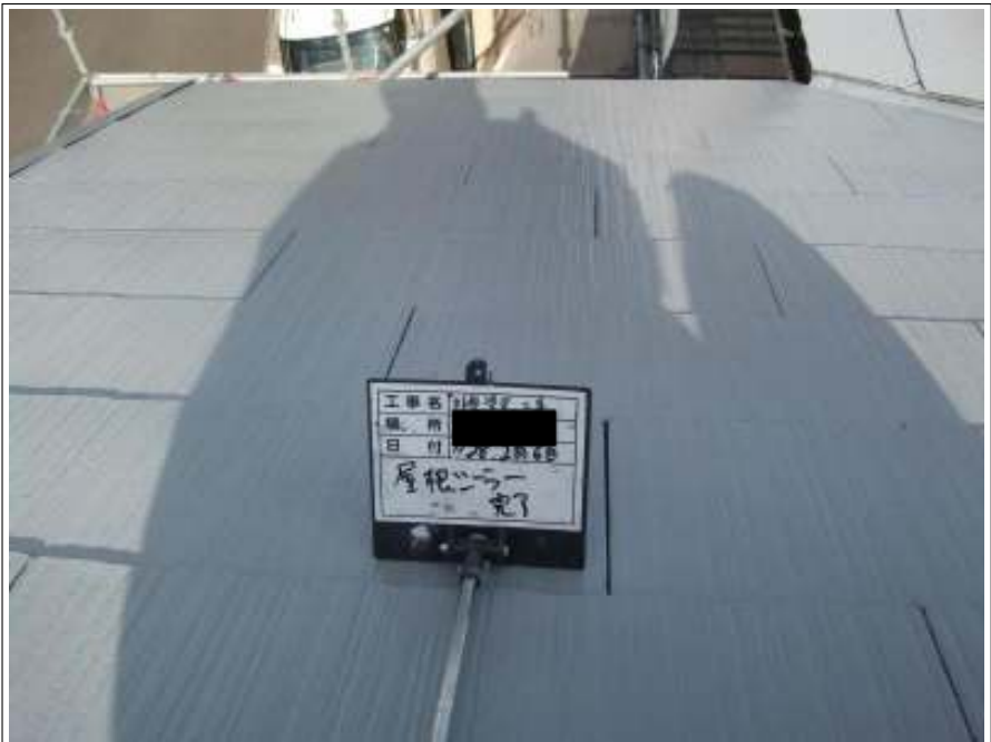
屋根 下塗り施工後