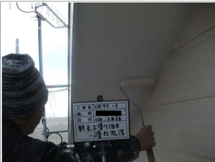
軒天 上塗り（1回目）施工中