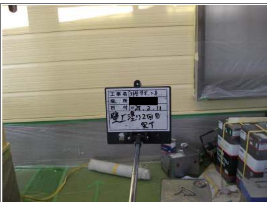
外壁 上塗り（2回目）施工後