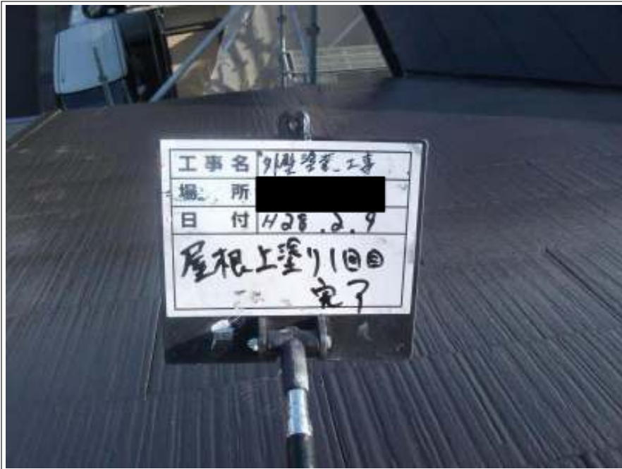
屋根 上塗り（1回目）施工後