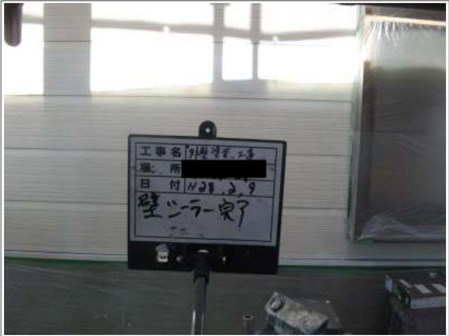
外壁 下塗り施工後