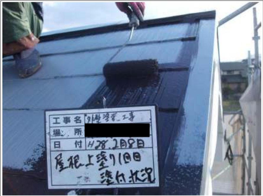
屋根 上塗り（1回目）施工中