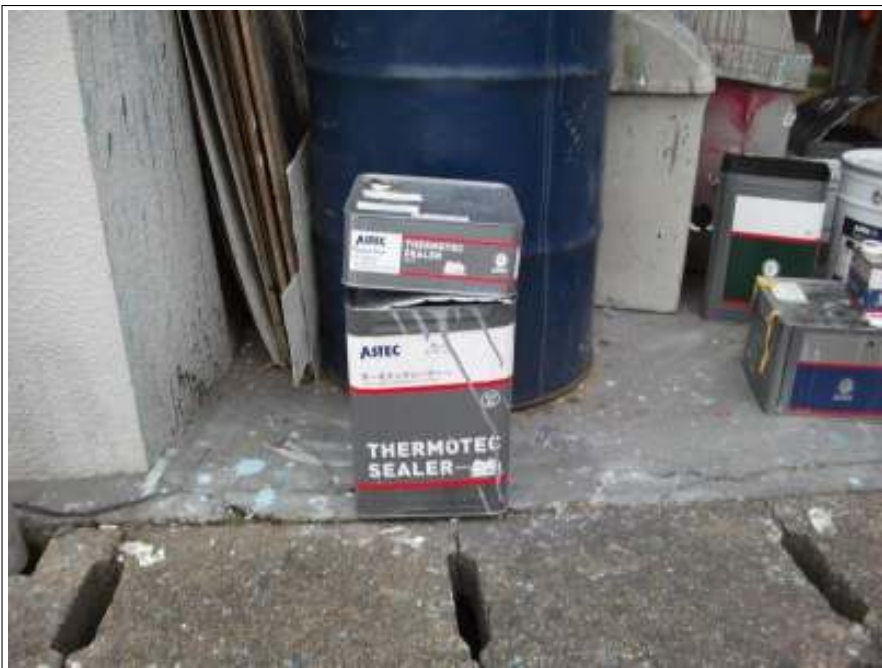
屋根 下塗り使用材料空缶