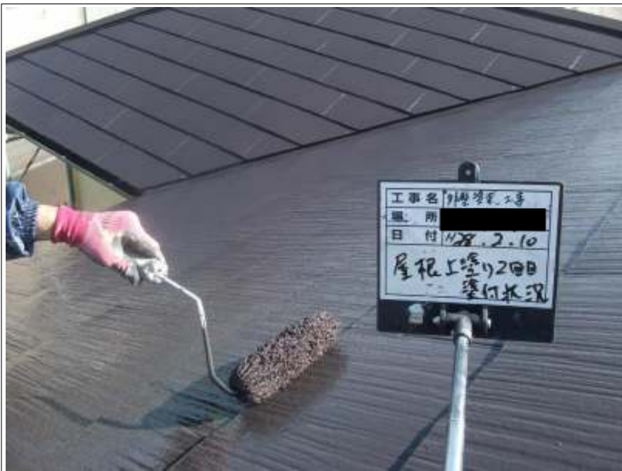
屋根 上塗り（2回目）施工中