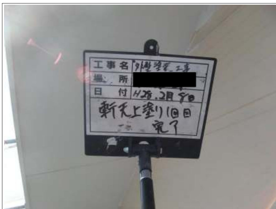
軒天 上塗り（1回目）施工後