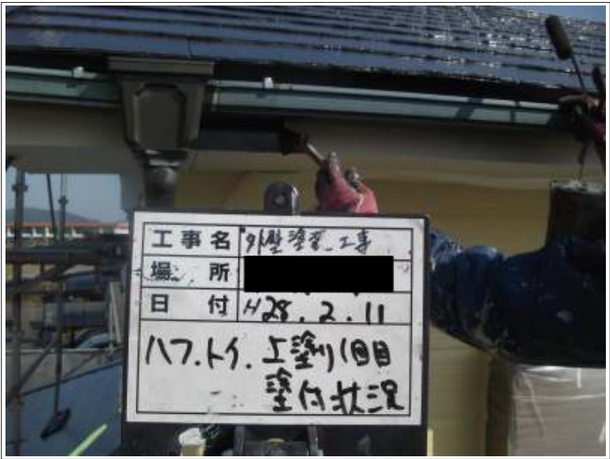
破風・樋 上塗り（1回目）施工中