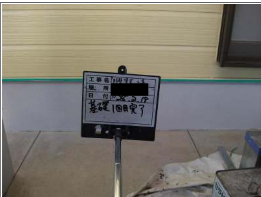
基礎塗り（1回目）施工後