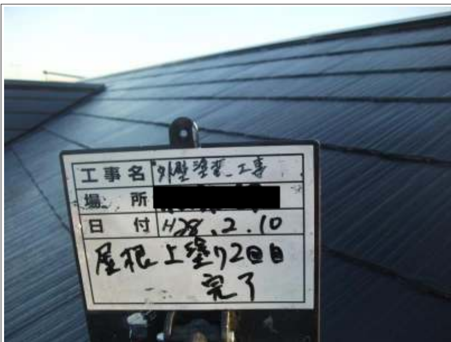
屋根 上塗り（2回目）施工後