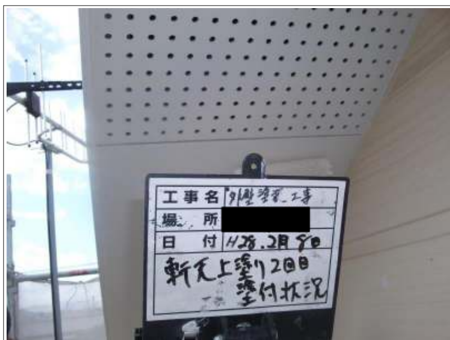
軒天 上塗り（2回目）施工中