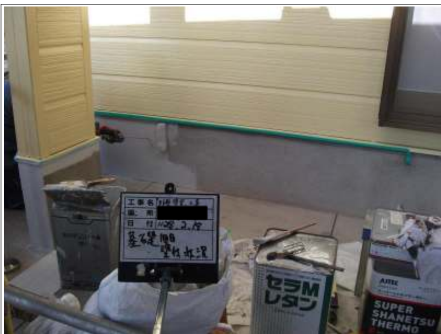
基礎塗り（1回目）施工中