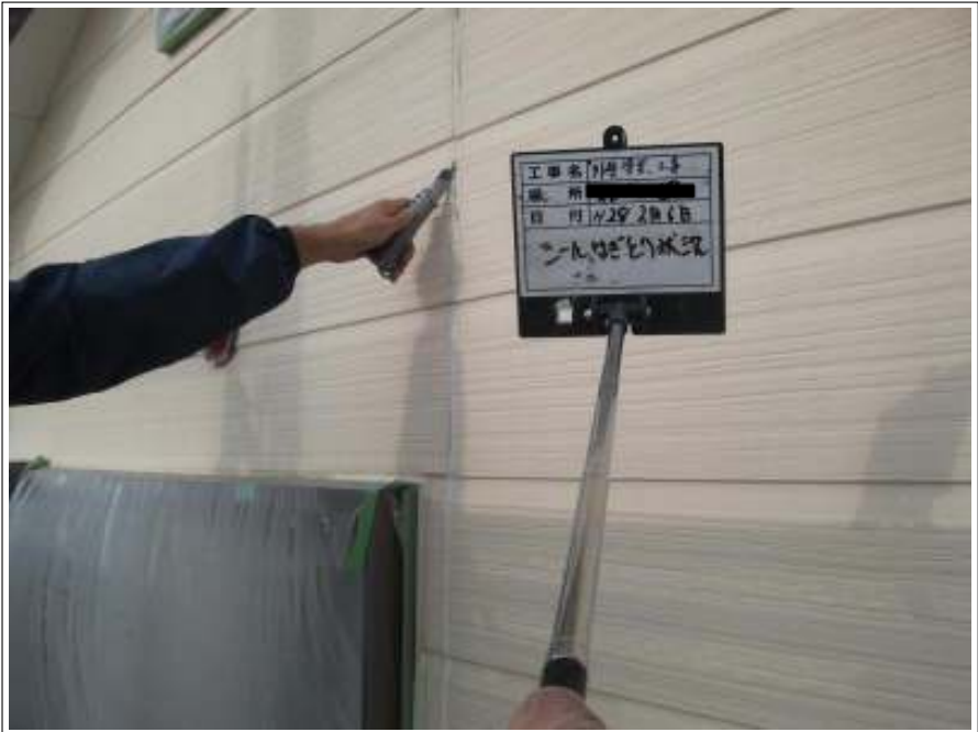
シーリング撤去 施工中