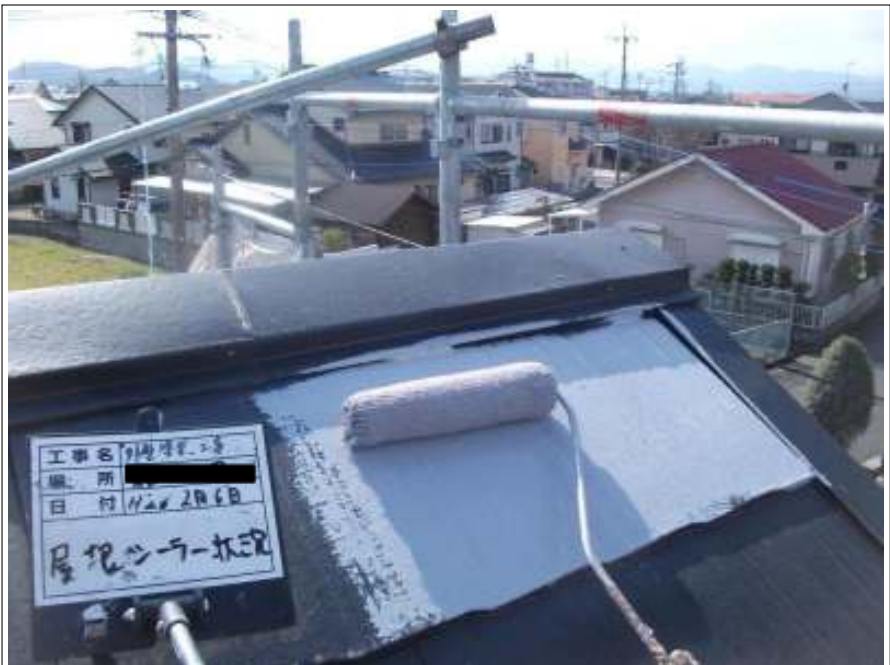
屋根 下塗り施工中