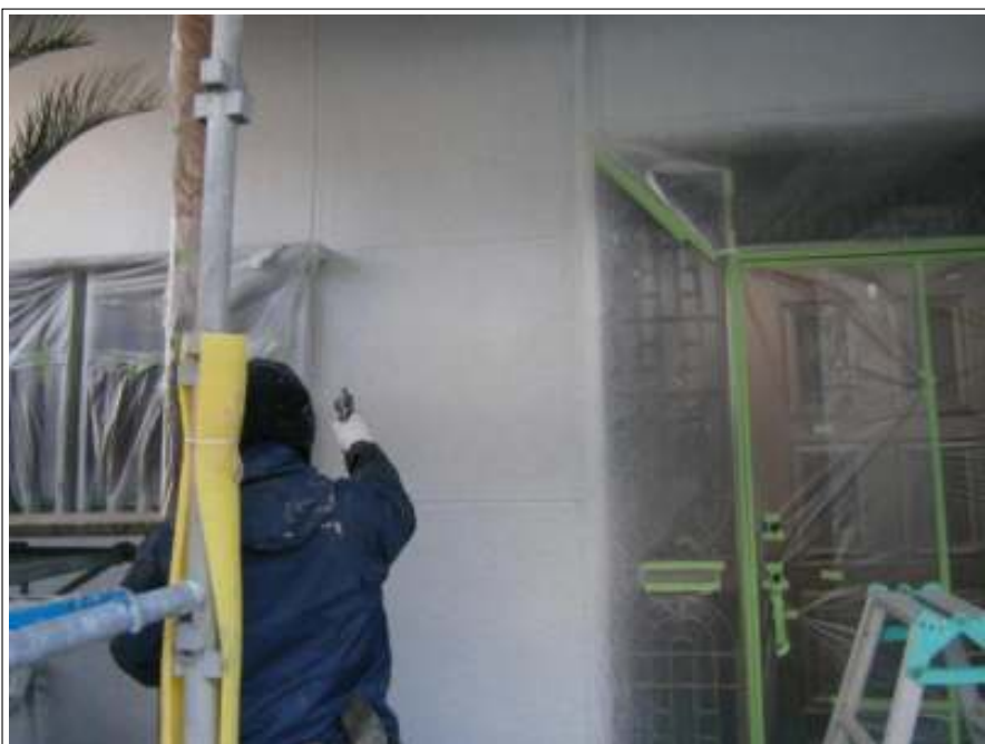
外壁 上塗り施工中