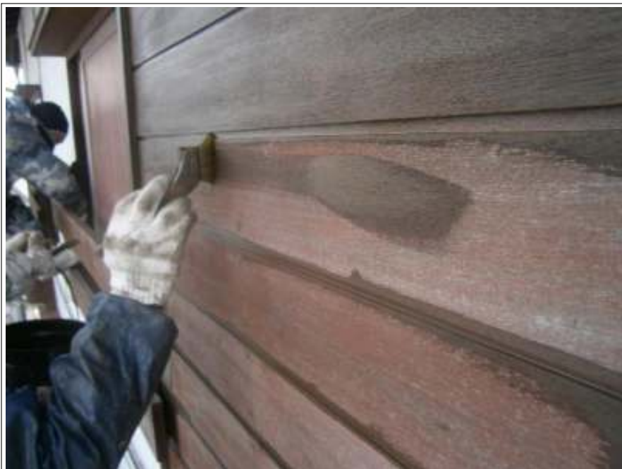
木部 上塗り施工中