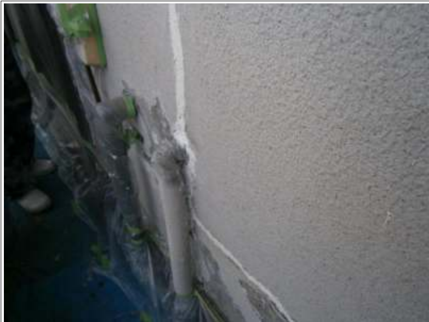
外壁 クラック補修