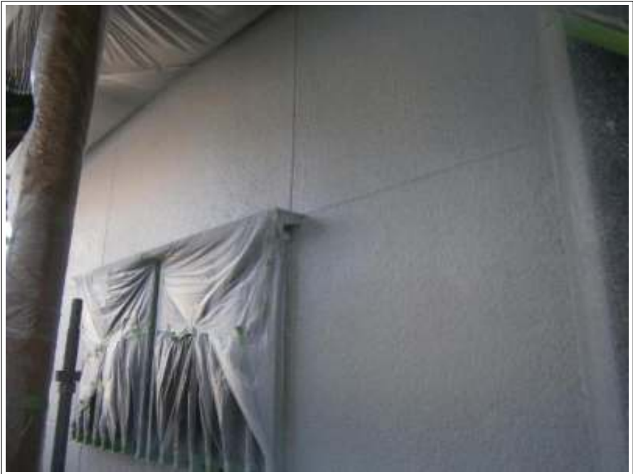
外壁 上塗り施工後