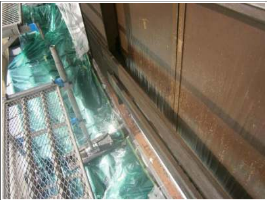
木部 上塗り施工中