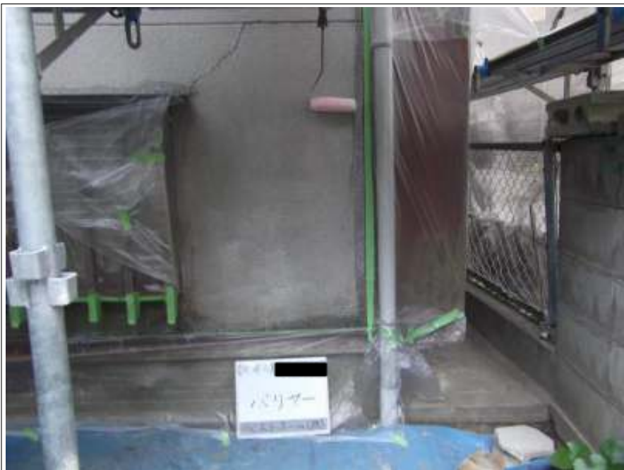
外壁 バリアー塗布 施工後