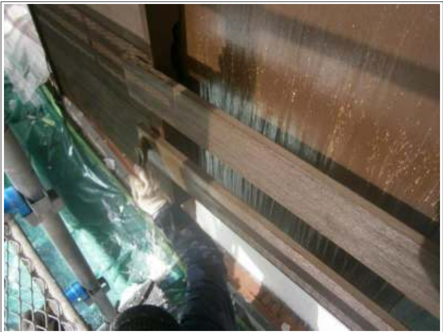
木部 上塗り施工中