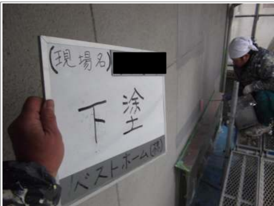
外壁 下塗り施工中