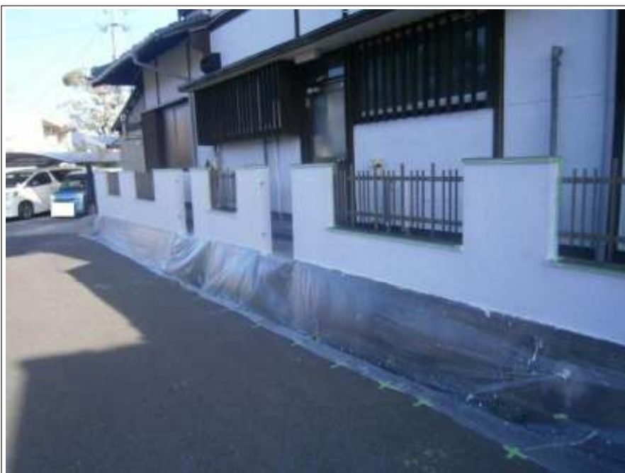
塀 上塗り（1回目）施工後