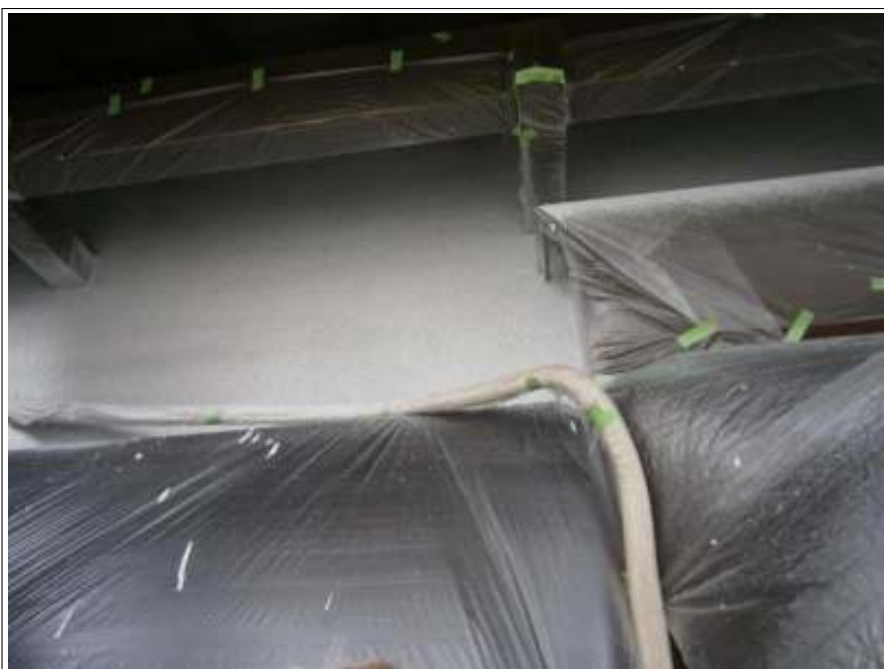
外壁 中塗り施工後