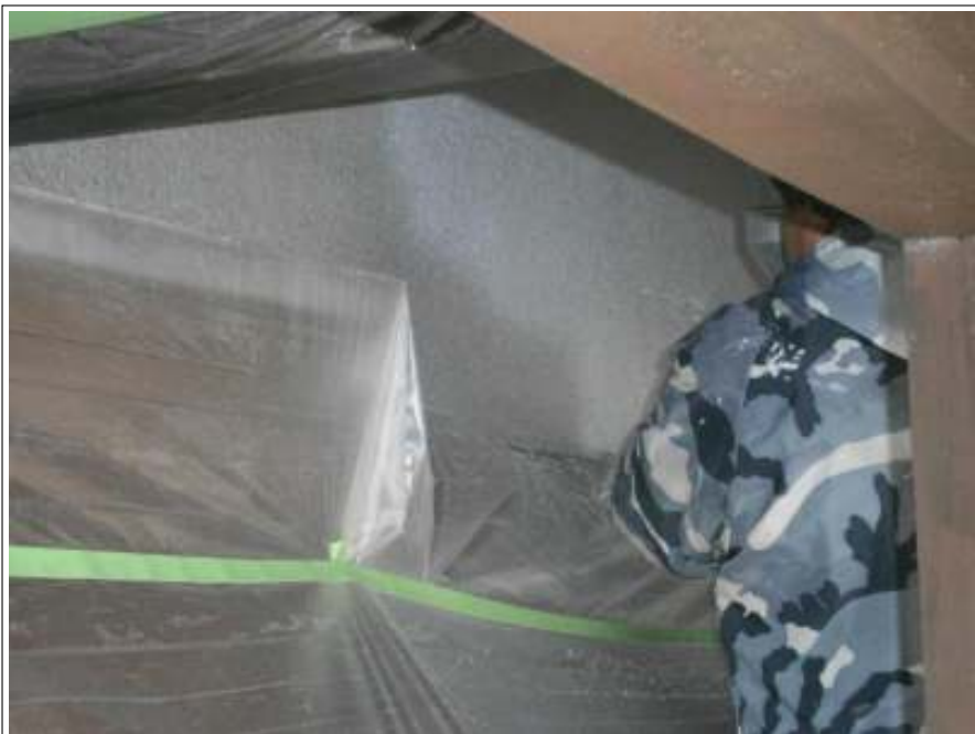
外壁 中塗り施工中