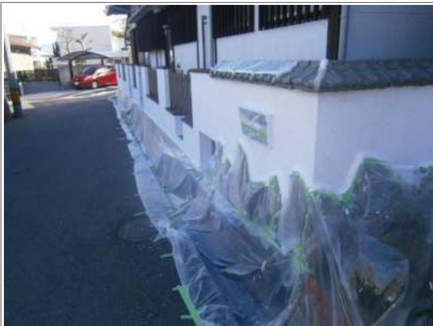
塀 上塗り（2回目）施工後